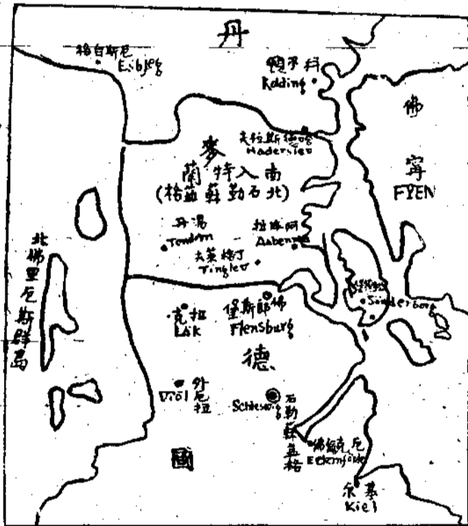
德丹邊境圖 譯者作

漢森 H. P. Hanssen 在 Jahre-sübersicht 書中，一九三三——三四年的報告，有這樣一段：