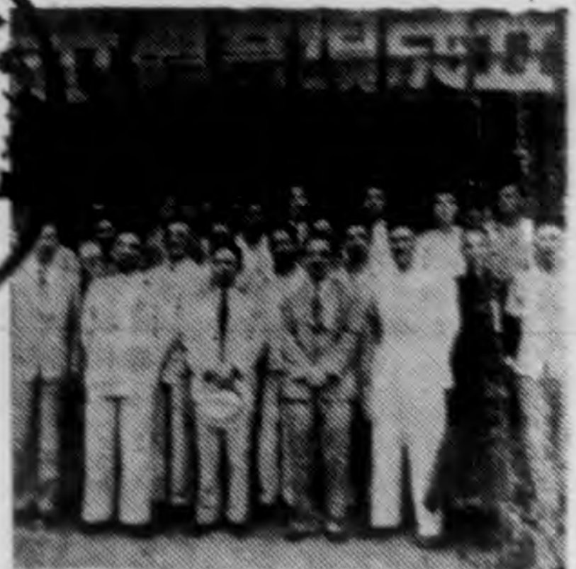
↑ 市立體育場本年七月一日成立