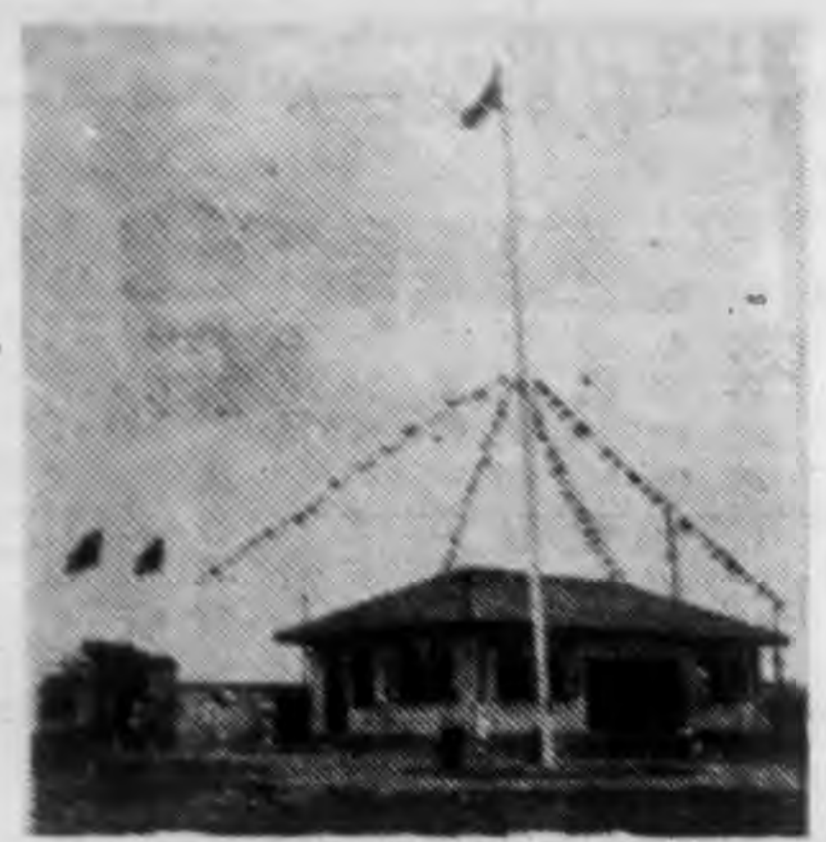
↑ 市立體育場之一角