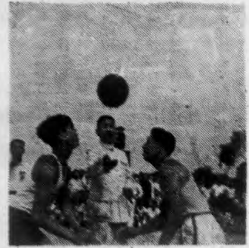
↑ 舉行籃球比賽等體育表演