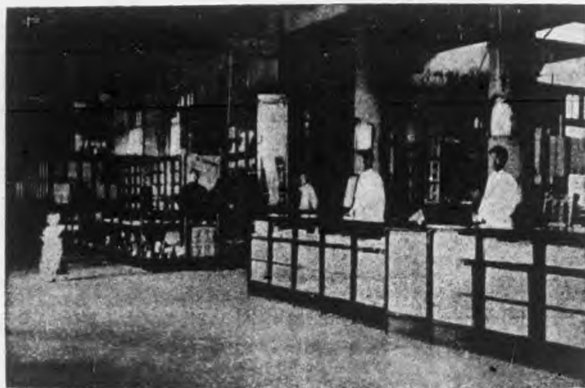
堂店店支區北館分沙長館本

從教材審查談到小學用書的推銷 大部參攷書概述(一) 雜誌講話 青年售貨員須知(八) 獻給同行的第十二封信 現代公民常識(三)