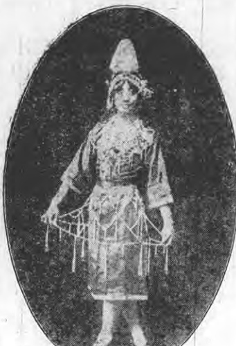
小翠花之七擒孟獲 (備攝夫人)