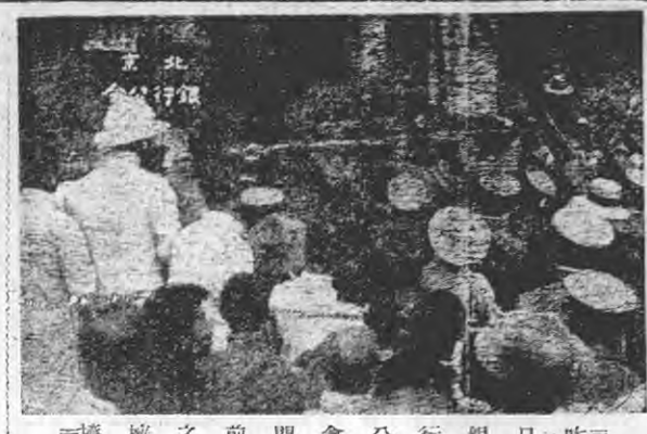
昨日銀行公會之情形