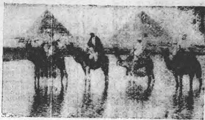
也也角三者見望以能進進方後進行之戰戰河河尼尼及埃

注意時間 自七月九日起每日七點開場 星期日七點開場 星期一七點開場 星期二七點開場 星期三七點開場 星期四七點開場 星期五七點開場 星期六七點開場 星期日七點開場 星期一七點開場 星期二七點開場 星期三七點開場 星期四七點開場 星期五七點開場 星期六七點開場 星期日七點開場