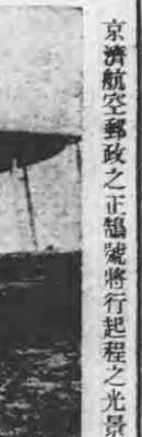
京濟航空郵政之正編將行起程之光景