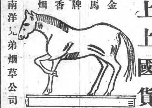
南洋兄弟烟草公司 贈品 帶等 表金 換金 張可 存多 券積 有獎 內贈 每罐