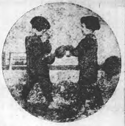
英兒之童練武... 此係英國兒童熱心練武... 習武之門...