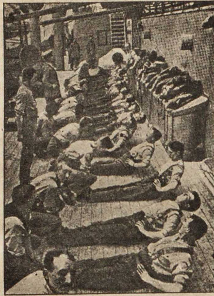
Англійскіе матросы на палубѣ военного судна продѣлываютъ гимнастическія упражненія.