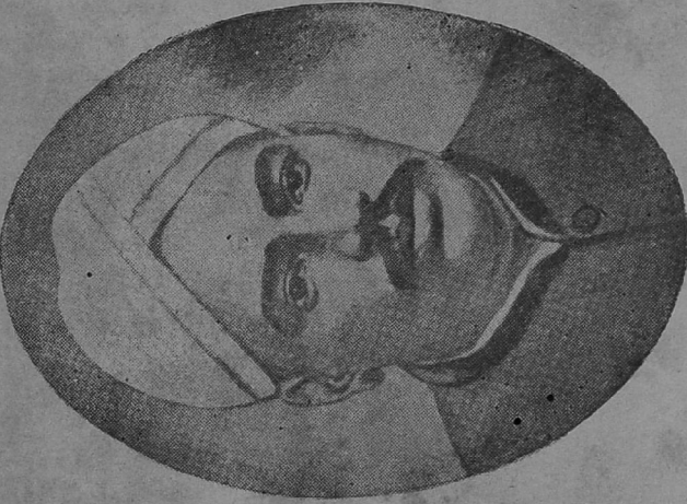
வ. உ. சிதம்பரம் பிள்ளை