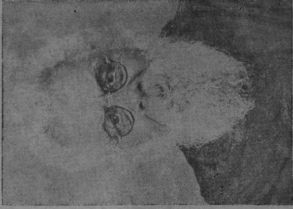
பெரியார் ஈ. வே.ரா