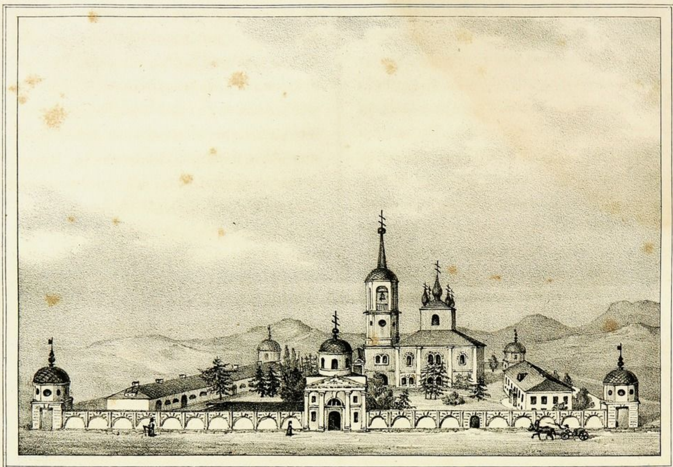
ВИДЪ АЛЕКСАНДРО ОШВЕНСКОЙ ОБИТЕЛИ.