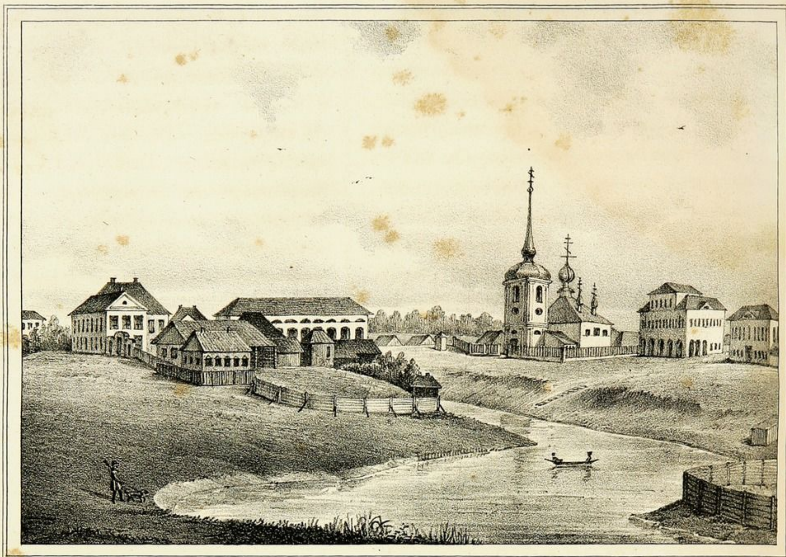
Видъ ВЫТЕГРЫ И МАРИИНСКАГО КАНАЛА.