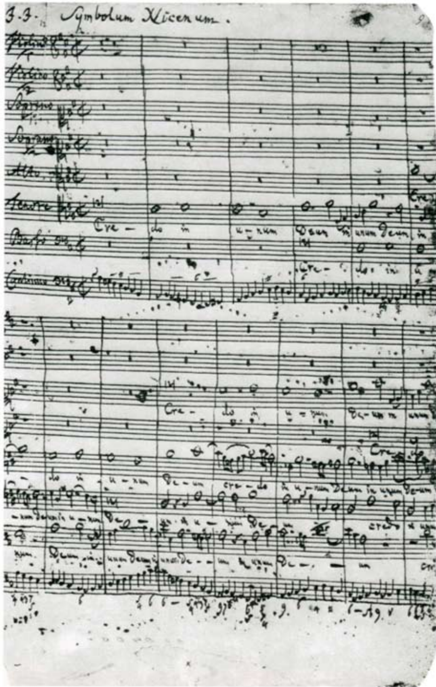
Fragment uit het manuscript van de H-moll-Messe, 1748

De grootmeester van de Duitse barok deed er meer dan twintig jaar over om zijn 'Hohe Messe' te voltooien. Dit gegeven is op zichzelf al bijzonder, gezien de gewoonte van de componist om enorme hoeveelheden muziek af te werken op zeer korte tijd. Zo is het bekend dat hij tussen 1723 en 1729 ongeveer 300 cantates produceerde. De mis is ook de laatste compositie die Bach afwerkte voor zijn overlijden, een echte zwanenzang. Dit doet sterk vermoeden dat de componist er zelf een grote inhoudelijke en muzikale betekenis aan toekende. De mis is wellicht ook het eerste werk van Bach dat herkend werd door de critici en onderzoekers als een uitzonderlijk muziekstuk; in 1817 reeds beschreef de criticus en uitgever Hans-Georg Nägeli de Mis in si-klein als "het grootste muziekwerk van alle tijden en alle volkeren". Dit is opmerkelijk, gezien de toondichter uit Leipzig tijdens zijn leven nauwelijks bekendheid genoot, en er de eerste eeuw na zijn dood vaak geringschattend werd geschreven over zijn oeuvre. Welk belang had de mis in het levenswerk van Johann Sebastian Bach, en waarom bekleedt het zo'n voorname plaats in onze muziekgeschiedenis?