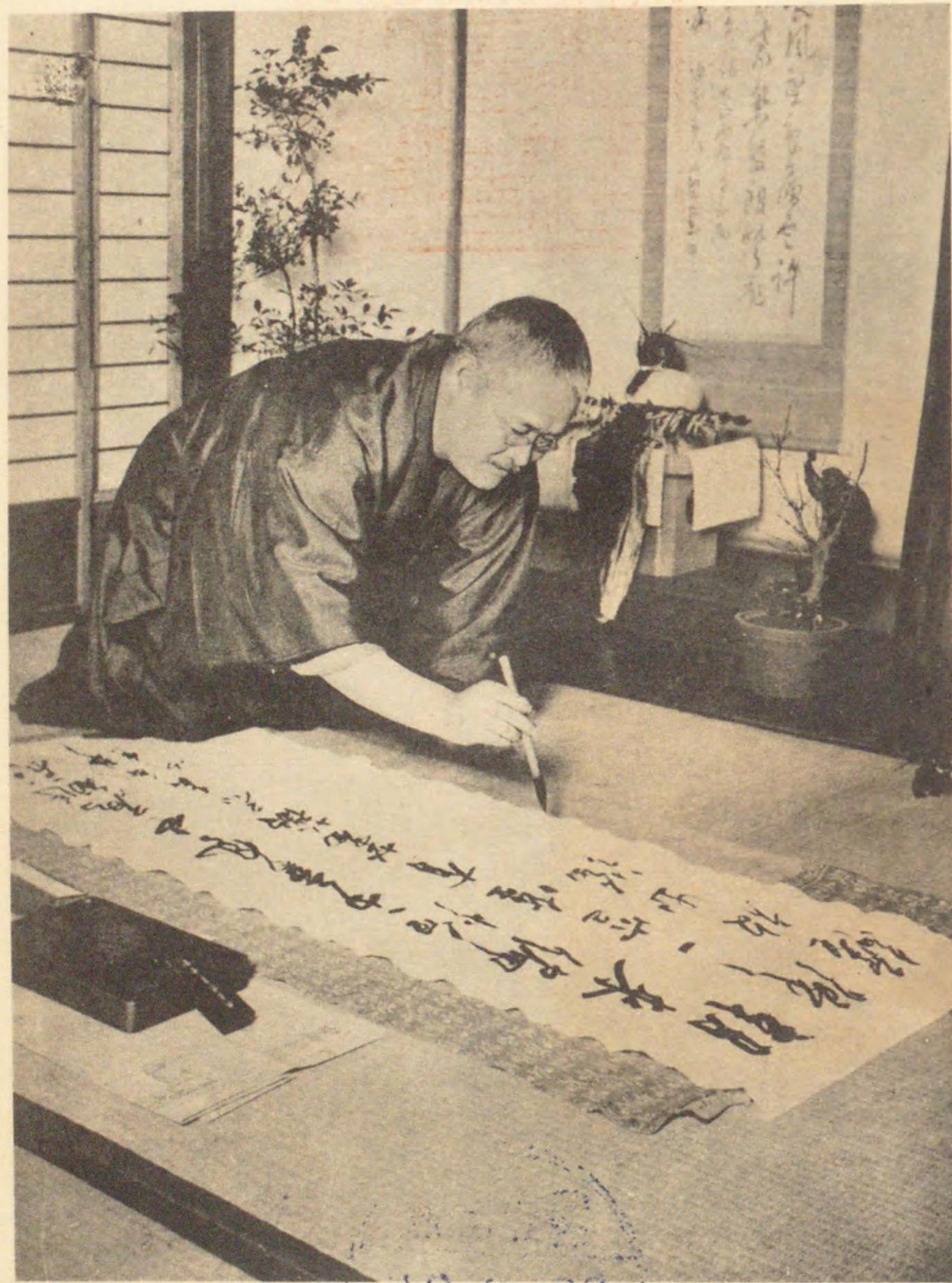
著 者 (大正十一年一月)