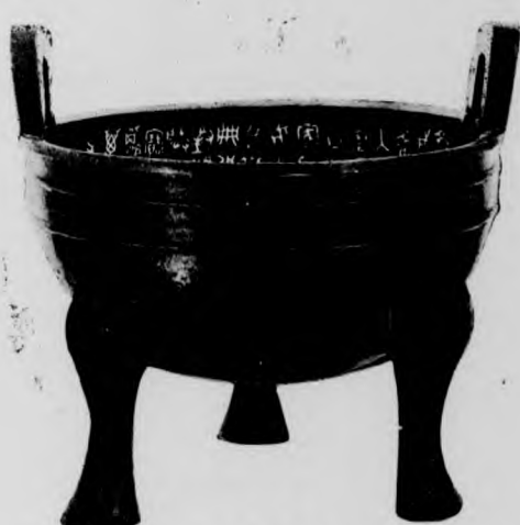
原藏錄 神宮、西清樓 經甲編 卷一云 高一丈 四寸八 分、耳 高二寸 二分、口徑 八寸三 分、腹 圍二尺 七寸八 分、重 二百兩