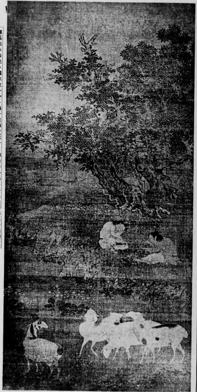
圖為絹本設色、縱三尺一分、橫一尺四寸六分、劉松年小傳、詳見本刊第九十六期、

詔宮傳聖主恩私 此比吾以百福時 影如寫寤寐鏡 幽多青鳥不 搖池 傳火燭引燃暴 火穿相衣傳補 衰 絲線重 多枯信史 筆綠 意名 台盡 其 若