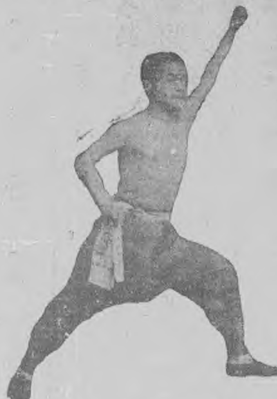
名家 票中 徐教 春師 羽爺 打之 魚架 殺勢

伶人的地位，表面似乎高了，但是那只有僅僅幾個所謂紅伶人。而來結交這般紅伶人的偉人，所結交的大都是屬於「名旦」，為什麼專結識「名旦」，那或者是因為這般「名旦」是溫柔；是多情；是嬌媚；一假如真為此，那麼又何常不是「玩相公」？或者是「旦角」的藝術比「生角」——「淨角」——「末角」——「丑角」……高超得多。也許是為此吧！