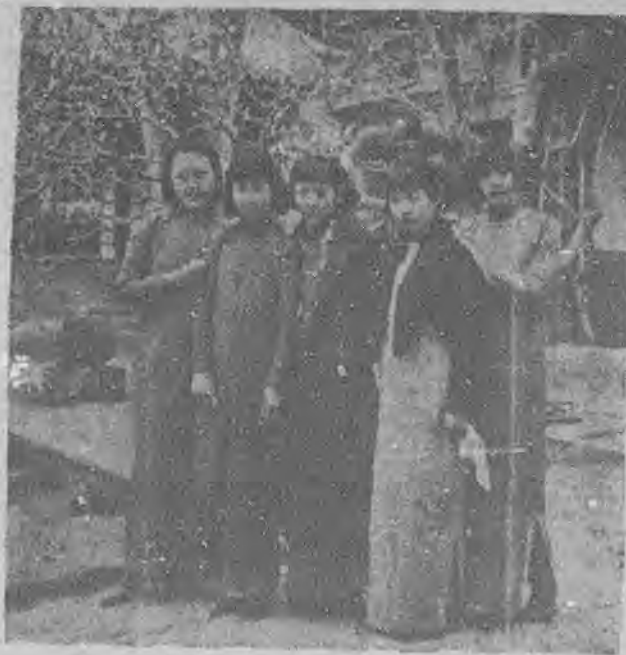
中國大學吳精董生宋秀 牛維義孫秋女士佳攝

當夜神將要把陽光帶走了的時候，正是暮色倉倉，惱人的景象，從陰暗處吹來的風，當然是較白天冷的，更是走讀的學生全都回家了，只剩了住校的一百幾