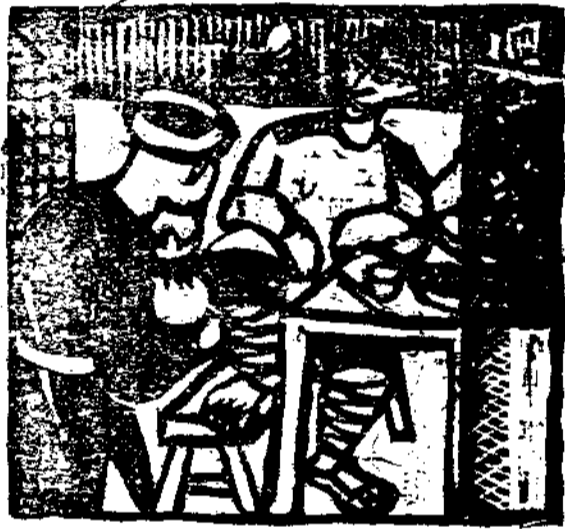
他喊裏店酒在陝小(二)