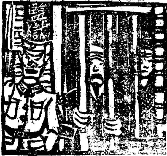
罪加上罪六老王奇居積國款公用辦(八)