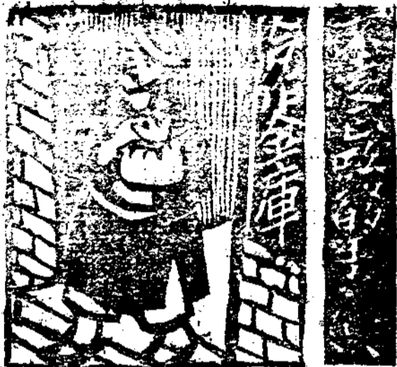
款借此次員社得調六老王(一)