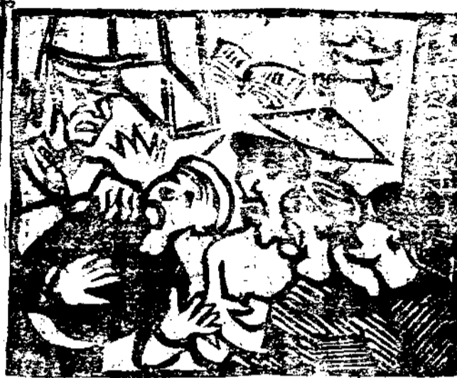
吉太之留陳小款索粉員益南軒查費聯單(七)