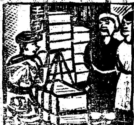
財大了發經已御仿酒他門進物貨(六)