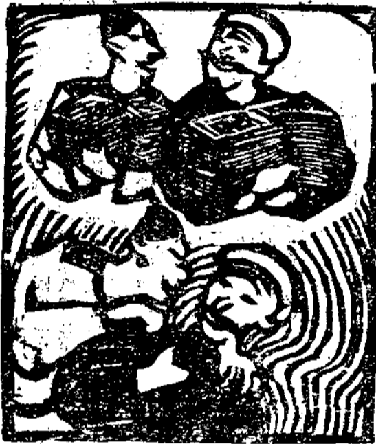
來夢財發起做就門他賣買殺處說(四)