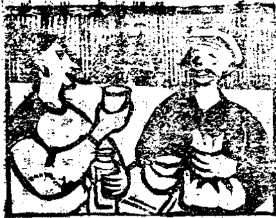
快活不好快活開人開(三)