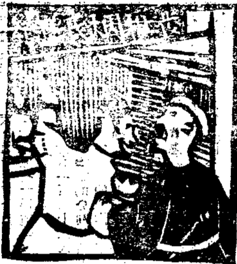
貨百辦縣款新州瑞(五)