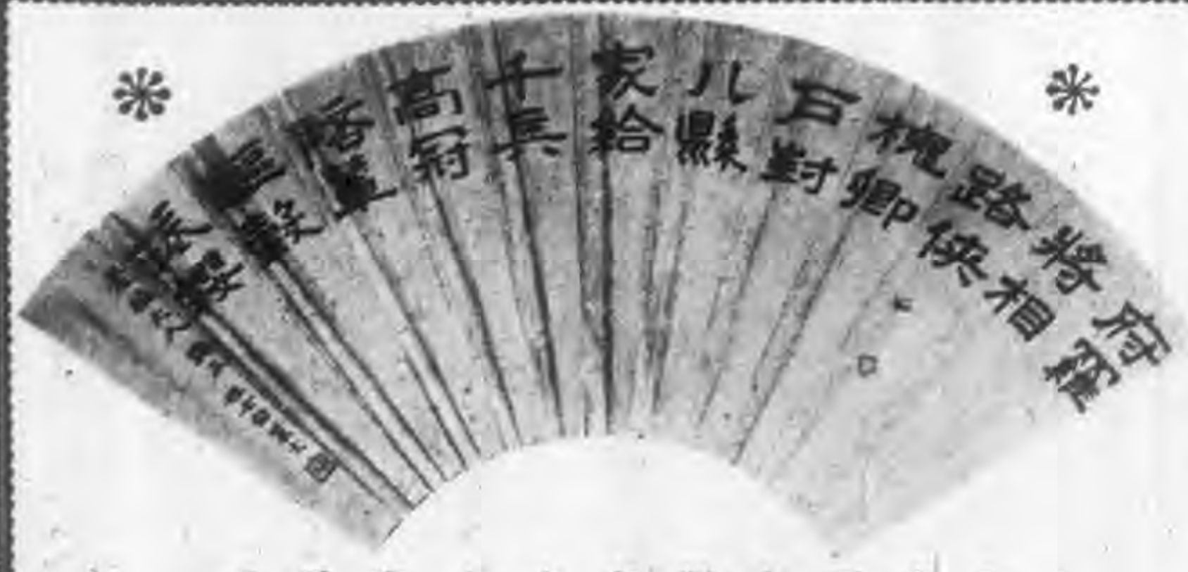
◁扇書十女文麗白票名▷

了唱外高亢之仰，若非天生鐵喉，丹田真音，焉能歌之也！故其之曲家，葉懷庭李笠翁諸氏，均甚誣之。嘗聞吳中崑班名旦，有為芝香者，演此劇時，以曾經名家之指點，獨破例笛色用小工調。其時班中人，均竊議焉。張生一臨鏡序一曲，歌畢下場，紅娘為二人，依次而上。及崔張二人拜畢，便同下場，始由紅娘為名觀的第三者之演述，歌二十一二紅曲，將崔張二人性的行為，曲曲傳出。至此支歌畢，崔張二人，始復上場。崑曲此種排場，風流蘊藉，含羞不盡，自是無上妙諦！若使二人必在外場表演之，