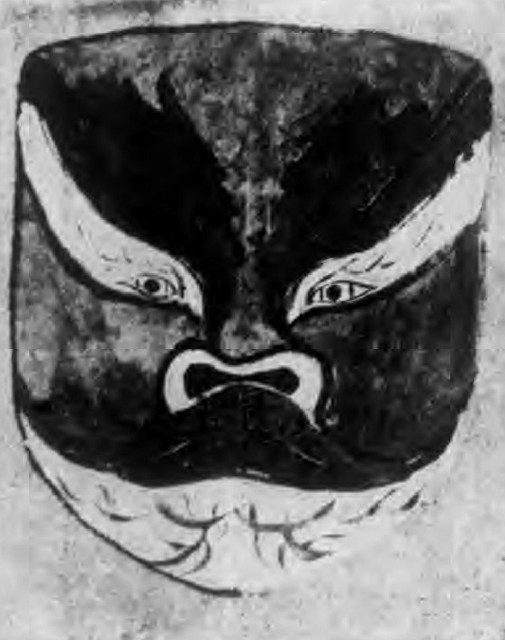
金咬程 ◁五之譜臉代明藏所軒玉綴▷

此種伴作，幸近年來，皆已革之也。二十一二紅曲，純為紅娘一人獨唱，中無片刻閒暑，至於飲場，可能且身段異常繁重，誠為式歌式舞之曲。如二個半推半就，隨做斜軟推，繼微做緊抱式。柳腰擺一句，則雙手插於腰間，手丹花含苞欲放式。二露胸丹開一句，右手持帕，由上落於面部，二次咬定羅衫耐句，即口咬汗巾，身做微蹲式，早眼部上，時若人，不勝其情。至看月上粉牆來一句，須領現出一種驚慌與嫉妬之情態。紅娘臨下場打時，向鴛鴦一指，紅娘見之，當急驚憤恨與嫉妬之情態。紅娘臨下場打時，