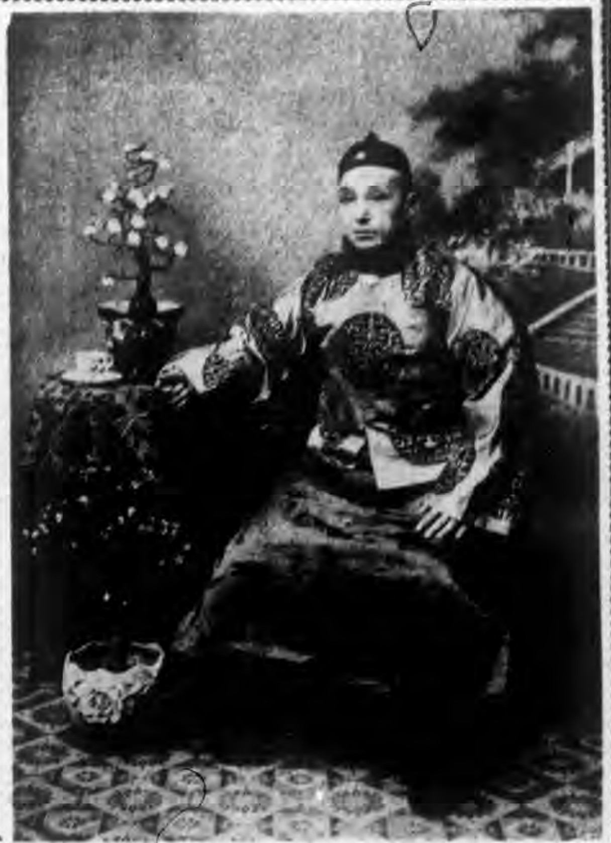
◁照遺君林洪張生武名▷

△電話 康長室三二七五三 辦事室二一八六五 宮北 分庫總局二二七六 分會二局二〇〇五 北平 分庫東局二八〇七 分會東局四〇七五