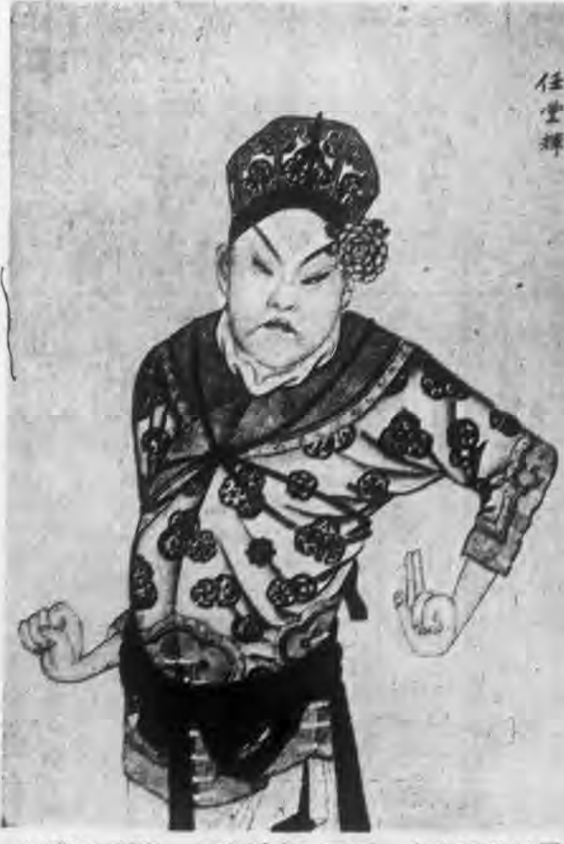
◁(藏軒玉綴)一輝堂任之口又三一六之譜像扮署平昇▷