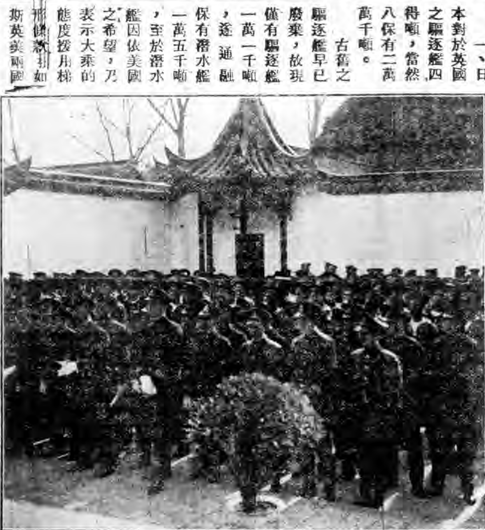
影攝兵士各之禮典祝慶年六十二加參

戰門艦「喬治五世」及「威爾斯親王」二艘之建造費超過一百萬鎊，該報謂其建造費之巨，實因該艦需要設備充份防空高射砲，該報復謂此世界最大戰門艦，不久或將有姊妹艦二艘之建造。 倫敦三強海約英法即將批准