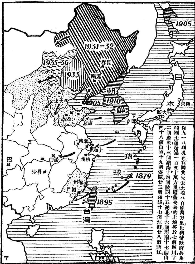
圖 地 難 國