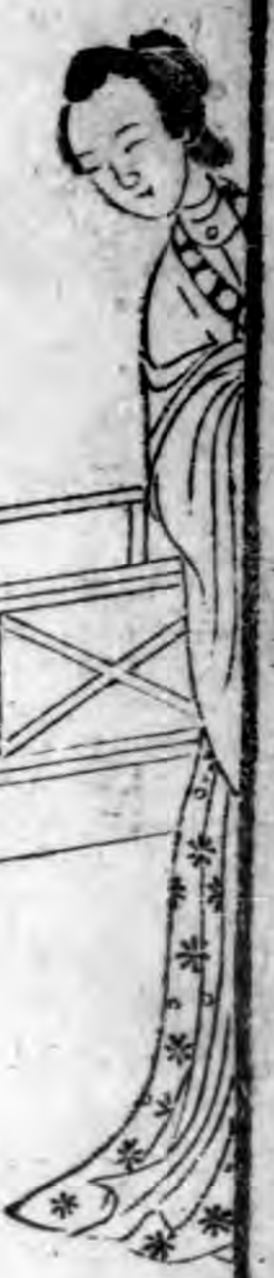
甄月娥春風慶朔堂