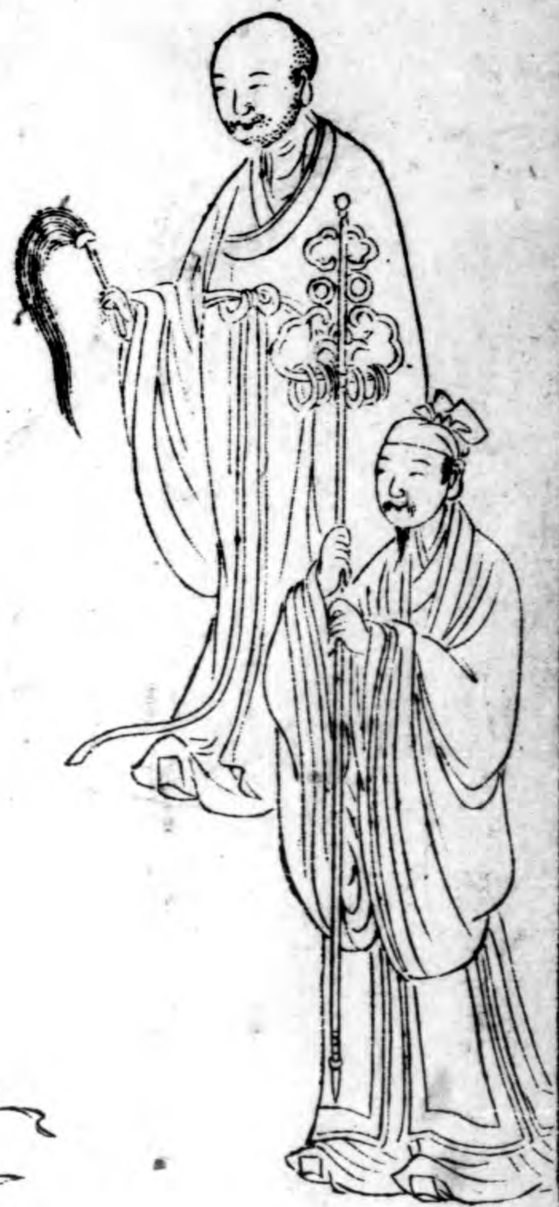
惠禪師三度 小桃紅