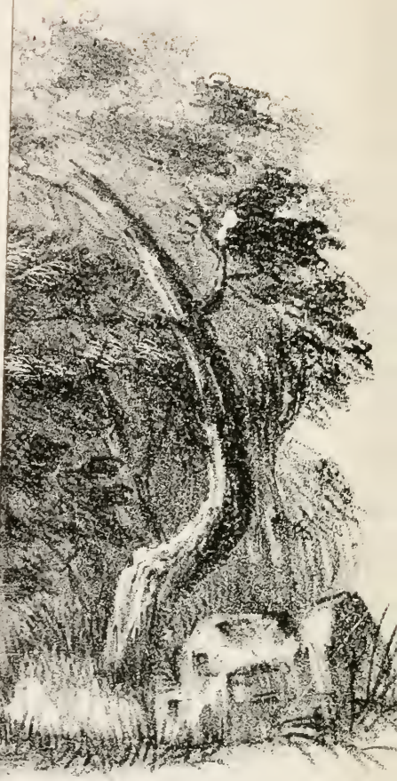
unus bipedum Tertium