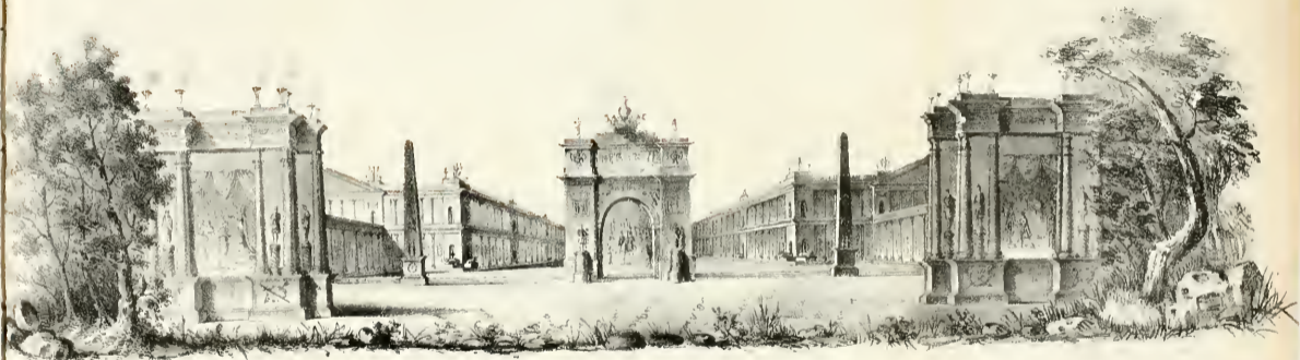
Prospetto della Mercanzia ... 136