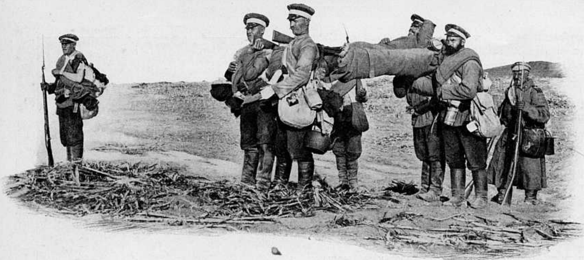
ПЕРЕНОСКА РАНЕНОГО ТОВАРИЩА ПОСЛѢ БОЯ. по фот. в. булла, съ театра войны.

ніе Куроки и Кавамуры войсками 1-й армии, на линии Хамалинского хребта, тянущагося по правому берегу р. Хунхе, наши армии двигались на Телинъ по четыремъ путямъ: — отъ Инпаня (въ 15 в. восточнѣе Фушуна), отъ Фушуна и Фулина — первая армія; по Мандаринской дорогѣ и ближайшимъ проселочнымъ къ ней — войска 2-й и 3-й арміи. Наибольшія трудности и опасности представились 25-го февраля. Съ 11 ч. утра противникъ въ продолженіи всего дня обстрѣливалъ съ боковъ, съ запада и съ востока, пути отступленія нашихъ войскъ. Отряды японцевъ, прорвавшіе нашъ центръ у д. Киузанъ, вышли отсюда въ