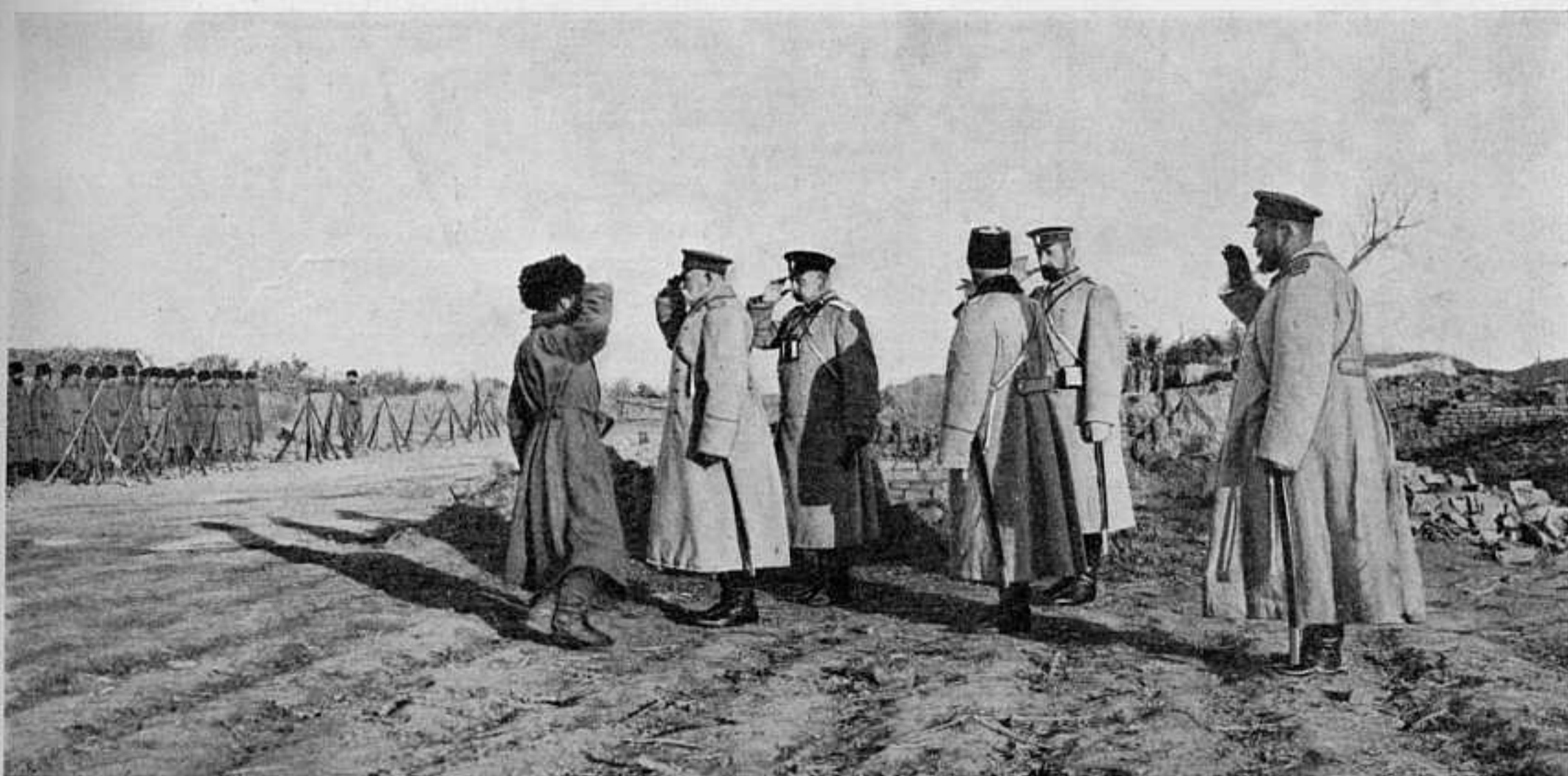
ПРІЕМЪ РАПОРТА ГЕНЕРАЛОМЪ ЛИНЕВИЧЕМЪ. СЪ ТЕАТРА ВОЙНЫ.

Отражая удары японскихъ обходныхъ колоннъ со стороны Синьминтина — у Императорскихъ могилъ и у ст. Усытхай (въ 5 в. западнѣе ж. дор.) войсками 2-й нашей арміи, и сдерживая съ востока наступле-