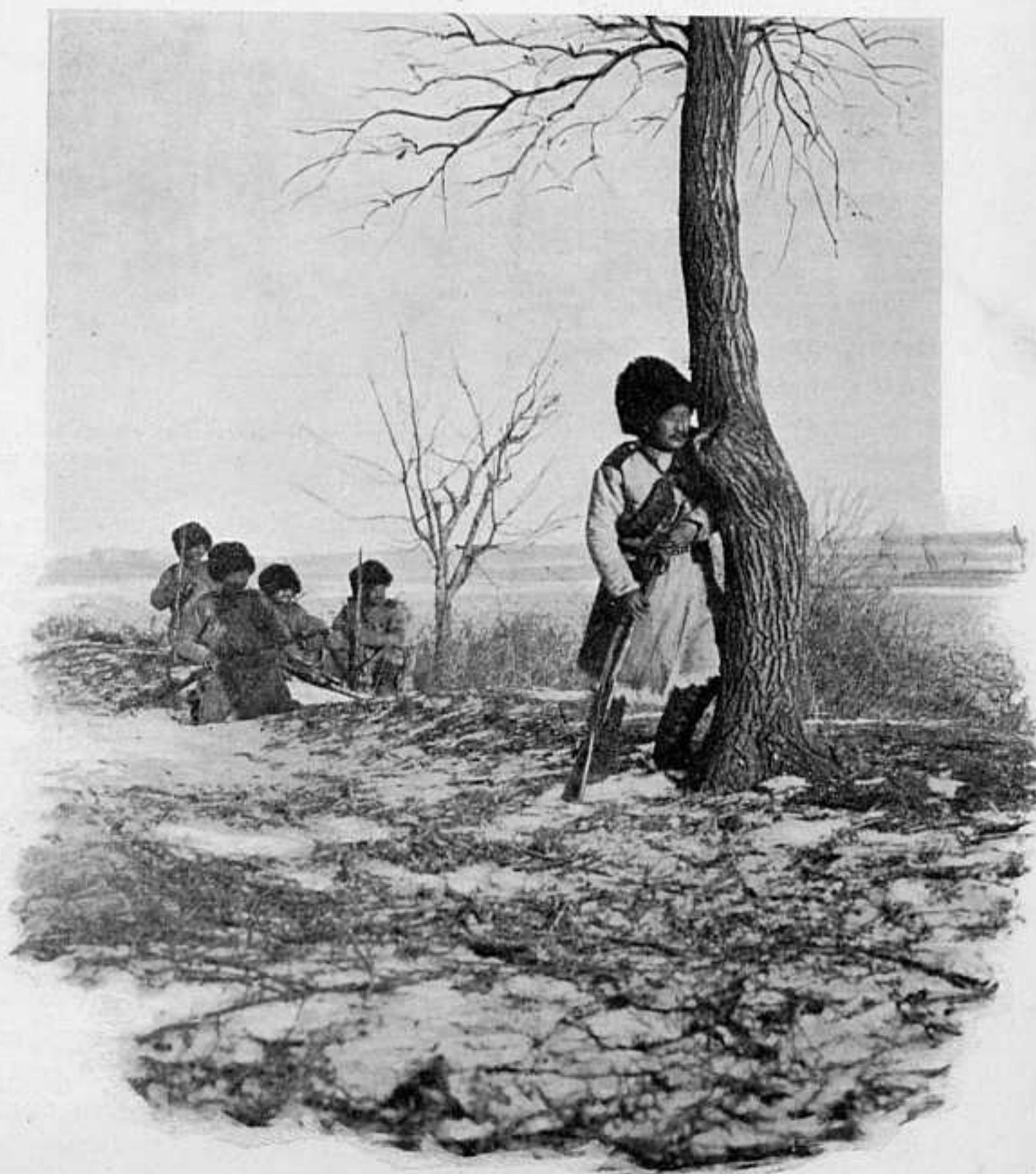
КАЗАЧИИ ПОСТЪ. съ театра войны.