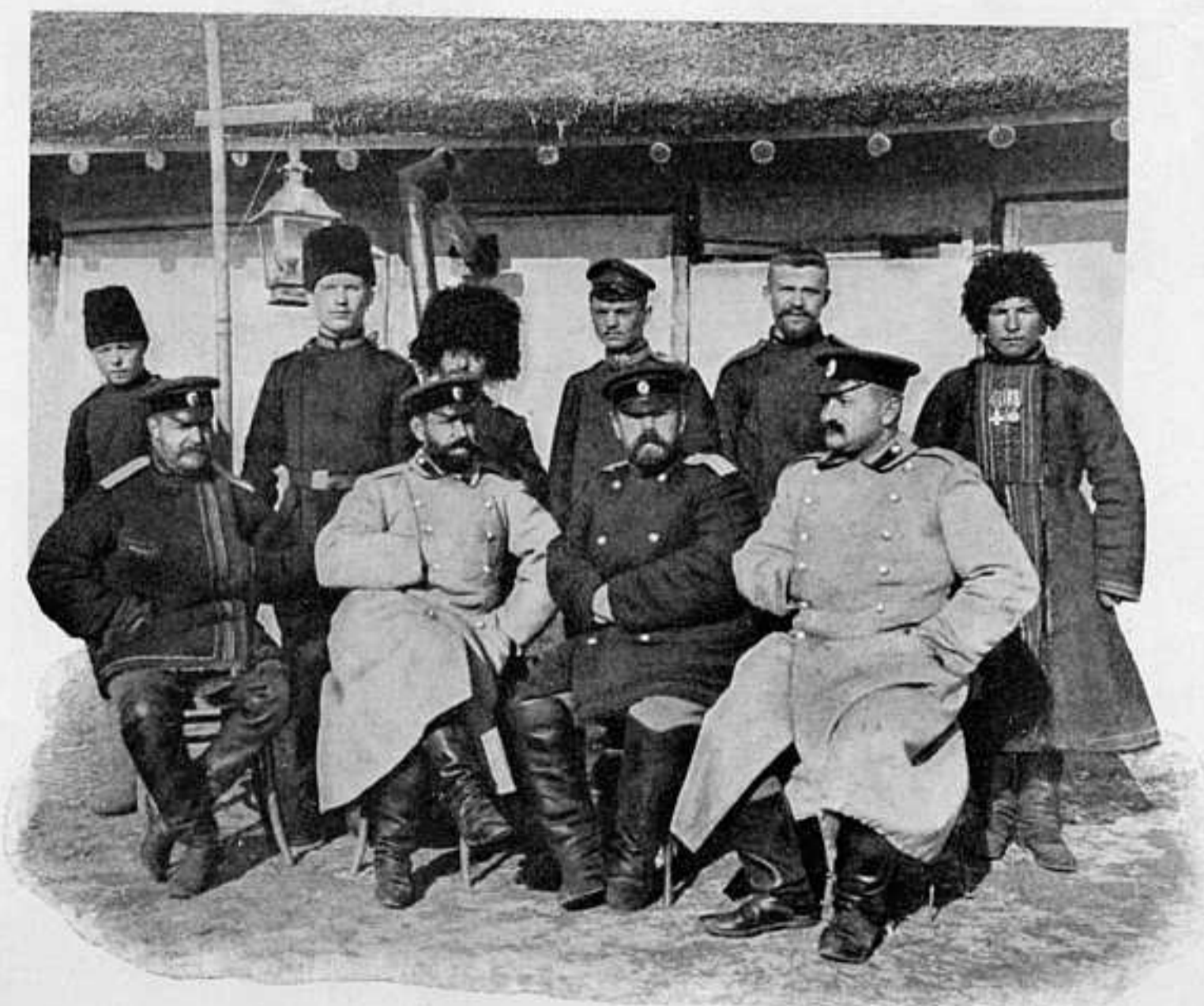
ЧИНЫ ОПЕРАЦ. И РАЗВѢДЫВАТ. ОТДѢЛЕНІЙ ШТАБА ГЛАВНОКОМАНДУЮЩАГО.

Телеграфъ передалъ намъ пока лишь отдѣльные эпизоды ея, лишь кровавые штрихи доблести и му-