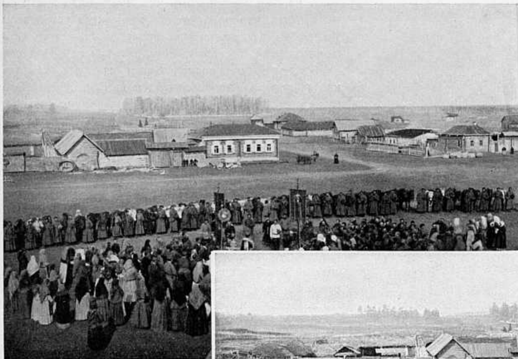
КАЗАКИ СТ. ДОЛГОДЕРЕВЕНСКОЙ, ОРЕНЬ. КАЗ. ВОЙСКА ПЕРЕДЪ ОТПРАВКОЙ НА Д. ВОСТ. МОЛЕБЕНЬ.