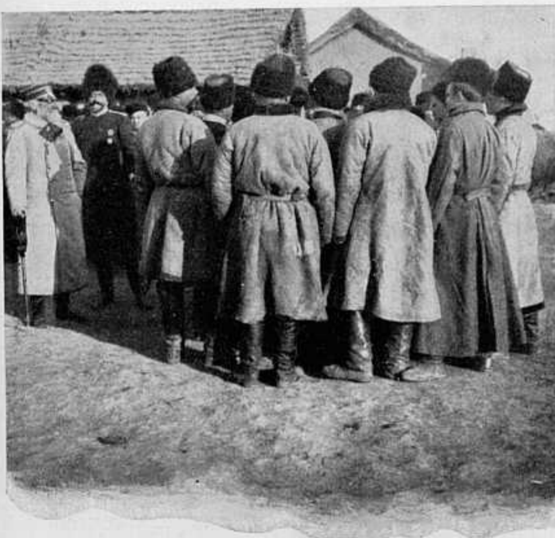
ГЕНЕРАЛЪ-АДЪЮТ. МЕЙЕНДОРФЪ СРЕДИ СВОИХЪ СОЛДАТЪ.

Назначенный Высочайшимъ приказомъ 3 марта главнокомандующимъ всѣми сухопутными и морскими вооруженными силами, дѣйствующими противъ Японіи, генераль-отъ-инфантеріи Николай Петровичъ Линевиць принадлежитъ къ числу выдающихся боевыхъ генераловъ. Ему въ настоящее время 67 лѣтъ. Свое боевое крещеніе онъ получилъ на Кавказѣ, въ эпоху войнъ съ горцами, гдѣ въ 1859 г. за особое отличіе былъ произведенъ въ подпоручики и уже въ слѣдующемъ году за дальнѣйшія боевыя отличія получилъ чинъ поручика; за рядъ подвиговъ въ этой же войнѣ онъ