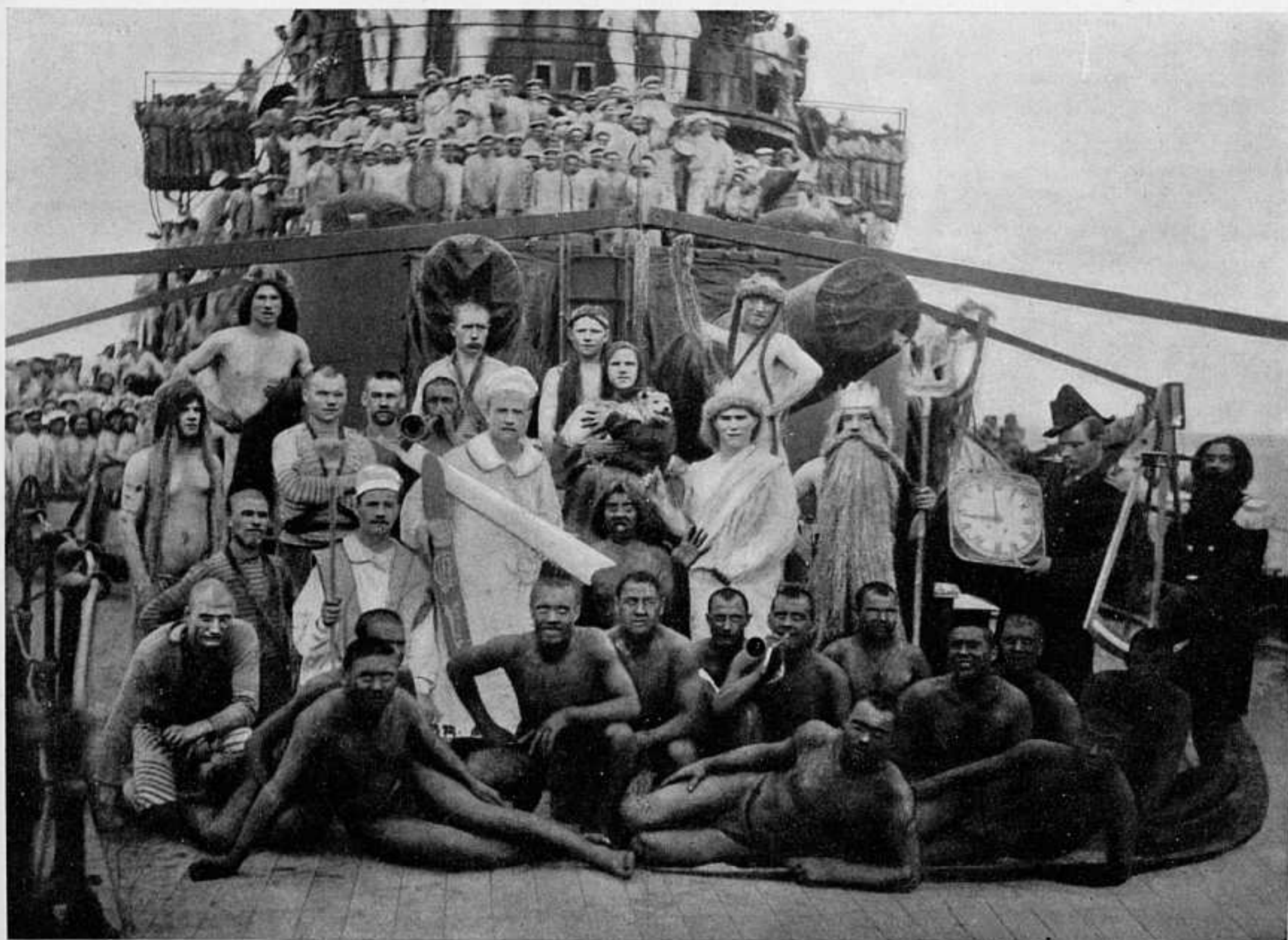
2-я ТИХООКЕАНСКАЯ ЭСКАДРА. ПРАЗДНОВАНИЕ ПЕРЕХОДА ЧЕРЕЗЪ ЭКВАТОРЪ.

(СМ. СТАТЬЮ «ИЗЪ ПИСЕМЪ ОФИЦЕРА СЪ БРОНЕНОСЦА «КНЯЗЬ СУВОРОВЪ» КЪ МАТЕРИ»—«ЛѢТОПИСЬ», № 46, СТР. 884).