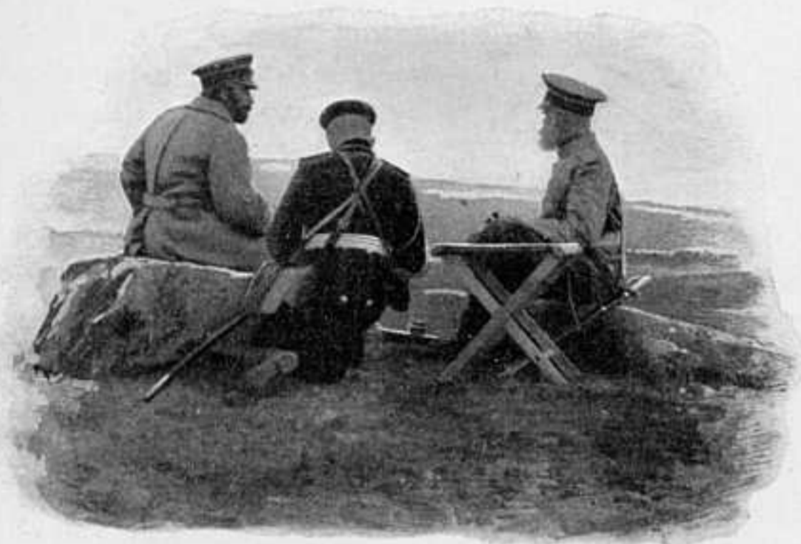
ГЕНЕРАЛЬ-АДЪЮТАНТЪ КУРОПАТКИНЪ И БАРОНЪ МЕЙЕНДОРФЪ НАБЛЮДАЮТЪ ЗА БОЕМЪ.

жества нашихъ славныхъ войскъ, — войскъ, у которыхъ даже неудача, даже «пораженіе» не могутъ отнять этого эпитета.