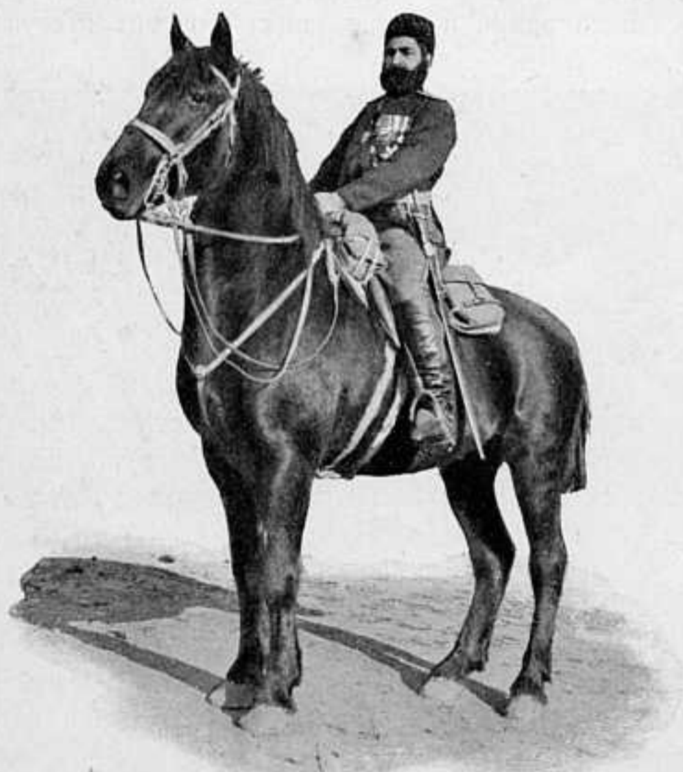
МАХМУДЪ-МИРЗА-ГААДЖАРЪ, принцъ персидскій. принимаетъ участіе во второй кампани: въ турецкой 1876 года и нынѣшней.

Арьергардъ 2-й арміи, подъ начальствомъ ген. Гершельмана, до 7 ч. утра 26-го февр. оставался у ст. Усытхай, прикрывая отступленіе 3-й арміи, находившейся въ наиболѣе трудныхъ условіяхъ. Не смотря на значительный промежутокъ времени, отдѣляющій насъ отъ событій у Мукдена, еще нѣтъ никакихъ положительныхъ данныхъ судить о подробностяхъ нашего отступленія и о нашихъ потеряхъ, понесенныхъ при этомъ. Можно лишь констатировать, что самый отходъ къ Телину, и сосредоточеніе здѣсь нашихъ главныхъ силъ продолжалось въ теченіе 26, 27 и 28 февраля; къ этому послѣднему времени порядокъ въ обозахъ былъ уже возстановленъ и наши войска были готовы вновь дать отпоръ врагу. По официальнымъ донесеніямъ число нашихъ раненыхъ въ Мукденскихъ бояхъ достигаетъ до 50 т., такимъ образомъ общія потери можно считать до 75 т., т. е. значительно меньше, чѣмъ предполагалось сначала и