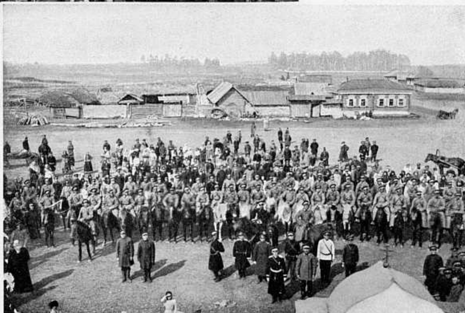
КАЗАКИ СТ. ДОЛГОДЕРЕВЕНСКОЙ, ПЕРЕДЪ ОТПРАВКОЙ НА ДАЛЬНІЙ ВОСТОКЪ. послѣ напутственнаго молебна.

— «Безусловно вѣрно, сообщаетъ тотъ же г. Ольгинскій (№ 10.386), что въ самомъ Мукденѣ и его провинціи находятся японскіе агенты, прекрасно осведомленные обо всемъ происходящемъ, иначе была бы невозможна та быстрота, съ которой японцы имѣютъ всѣ свѣдѣнія о русской арміи...» И какъ яркій примѣръ, онъ приводитъ, что «въ подобранныхъ нами у