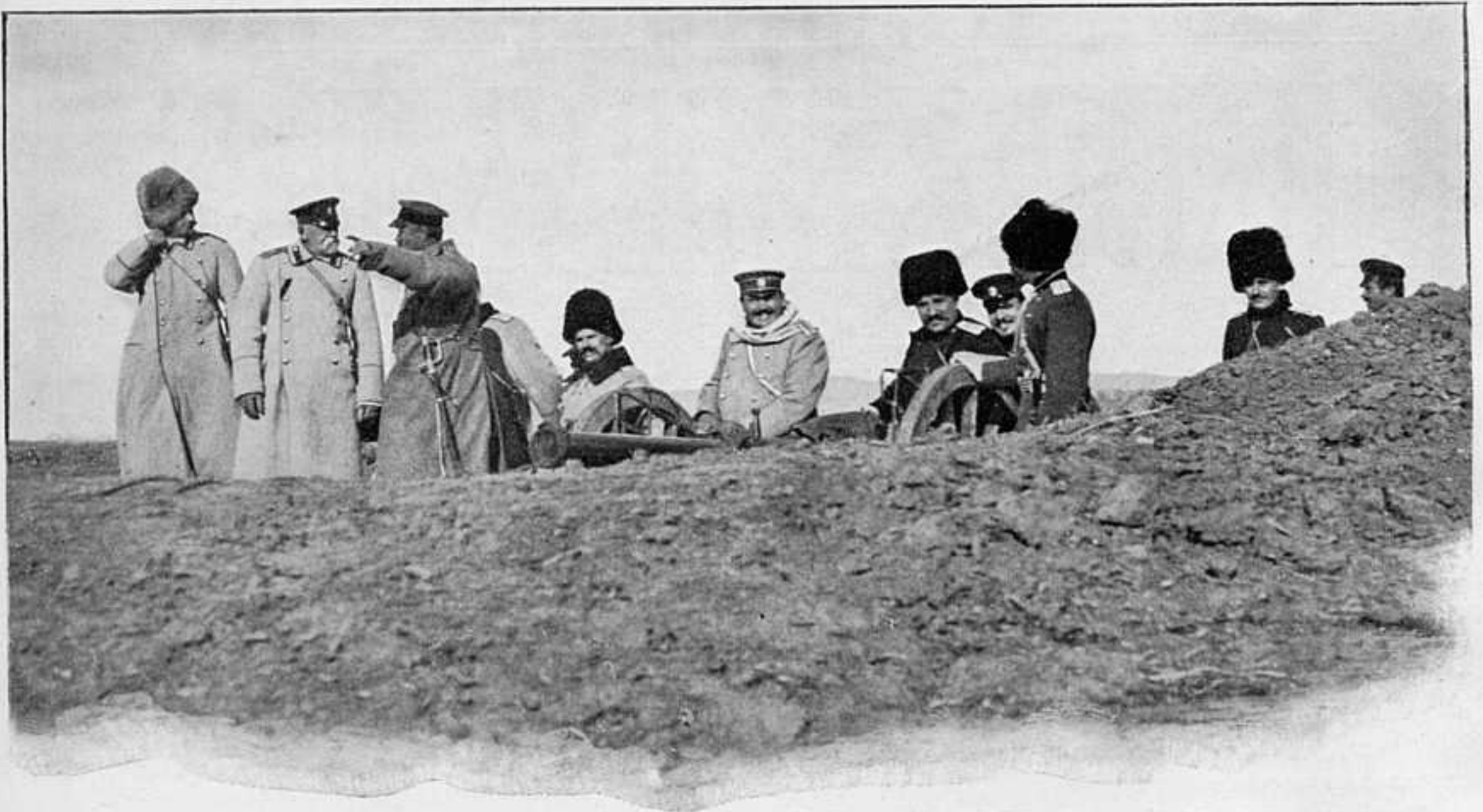
ОСМОТРЪ ПОЗИЦІЙ ГЕНЕРАЛОМЪ ЛИНЕВИЧЕМЪ. съ ТЕАТРА ВОЙНЫ.

Въ Кореѣ вводится японская денежная система. Два внѣшнихъ займа, заключенныхъ въ Берлинѣ и Лондонѣ, и одинъ внутренній въ Токио — при содѣйствіи «иностранныхъ» капиталистовъ — обильно пополняютъ истощенную казну правительства Микадо. Вмѣстѣ съ тѣмъ все смѣлѣе и настойчивѣе развивается японская пропаганда въ Китаѣ. Войска поднебесной им-