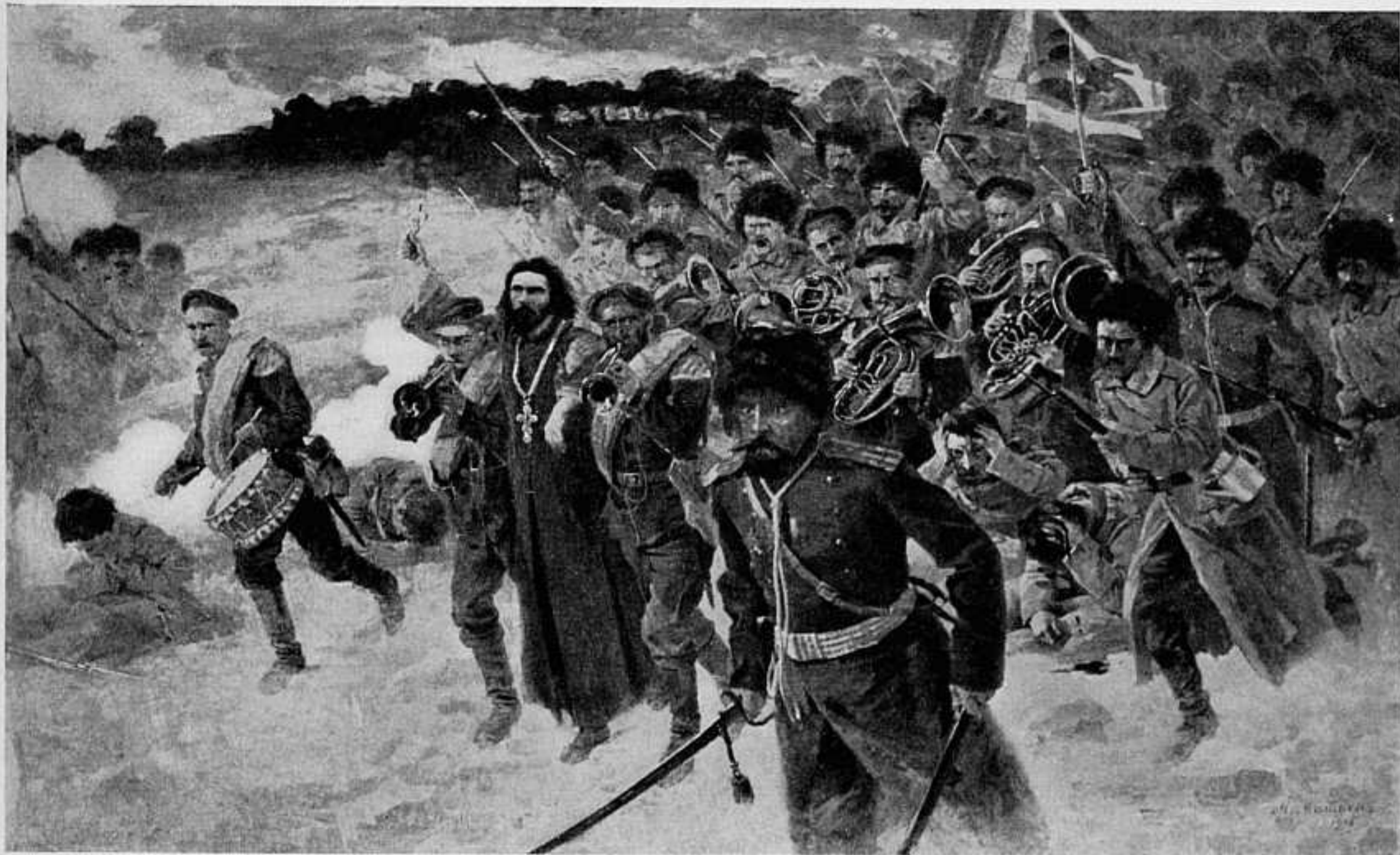
«АТАКА ПОДЪ ТЮРЕНЧЕНОМЪ 18 АПРѢЛЯ». КАРТ. ХУД. М. Л. МАЙМОНА. ВЫСТАВКА СПБ. ОБЩЕСТВА ХУДОЖНИКОВЪ.