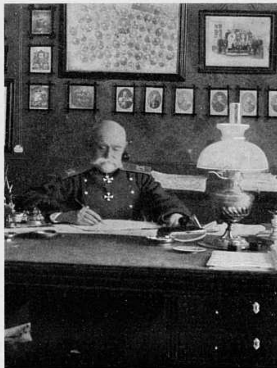
ГЕНЕРАЛЪ ЛИНЕВИЦЪ ВЪ СВОЕМЪ РАБОЧЕМЪ КАБИНЕТѢ ВЪ ХАРБИНѢ.

Прорывъ нашей оборонительной линіи на Хунхе между Мукденомъ и Фушунемъ и возможность захвата нашего главнаго пути отступленія отъ Мукдена на сѣверъ, вынудили ген.-ад. Куропаткина, къ вечеру