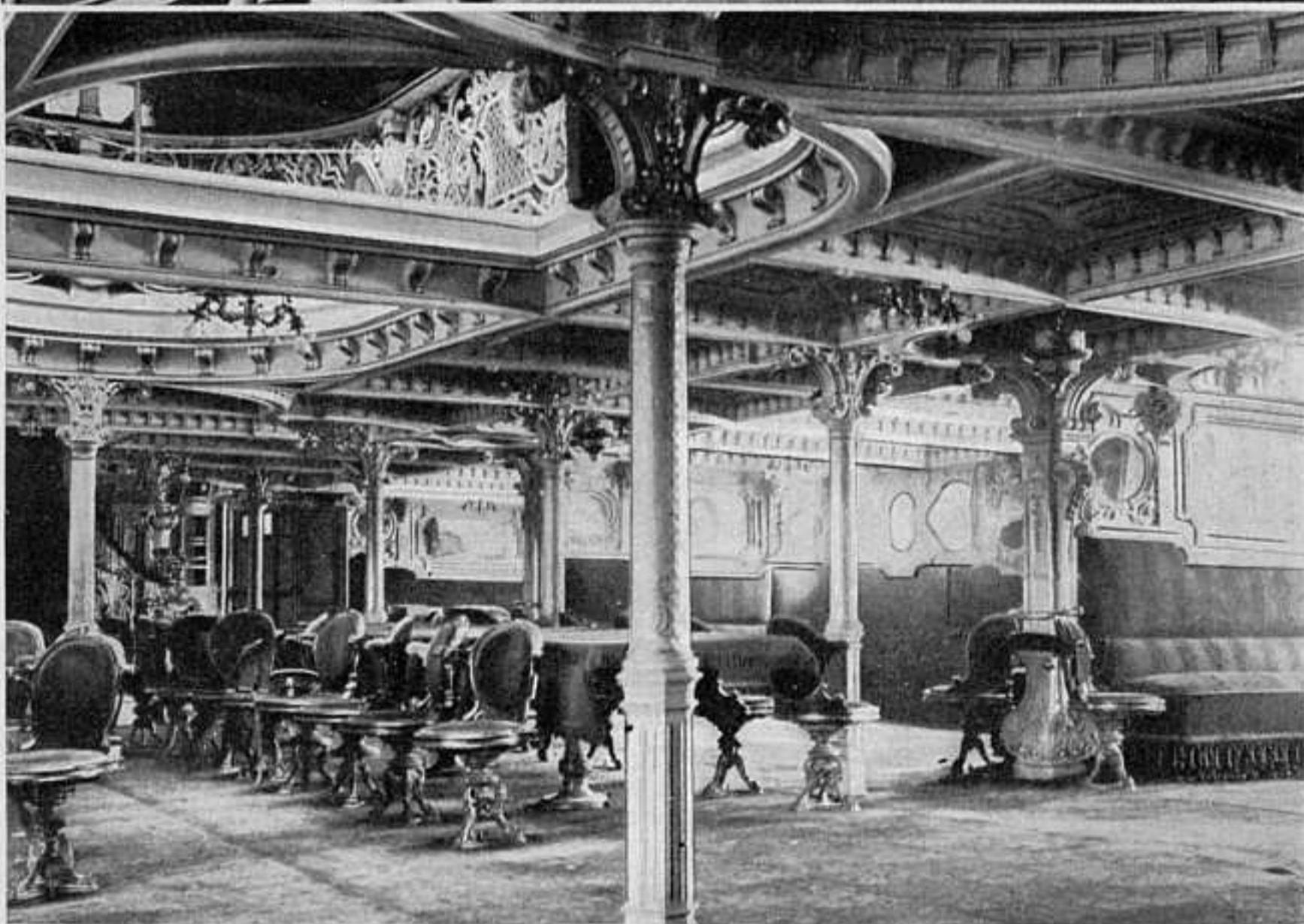
ВЕРХНЯЯ ПАЛУБА ВСПОМОГАТ. КРЕЙСЕРА 2-Й ТИХООКЕАН. ЭСКАДРЫ.