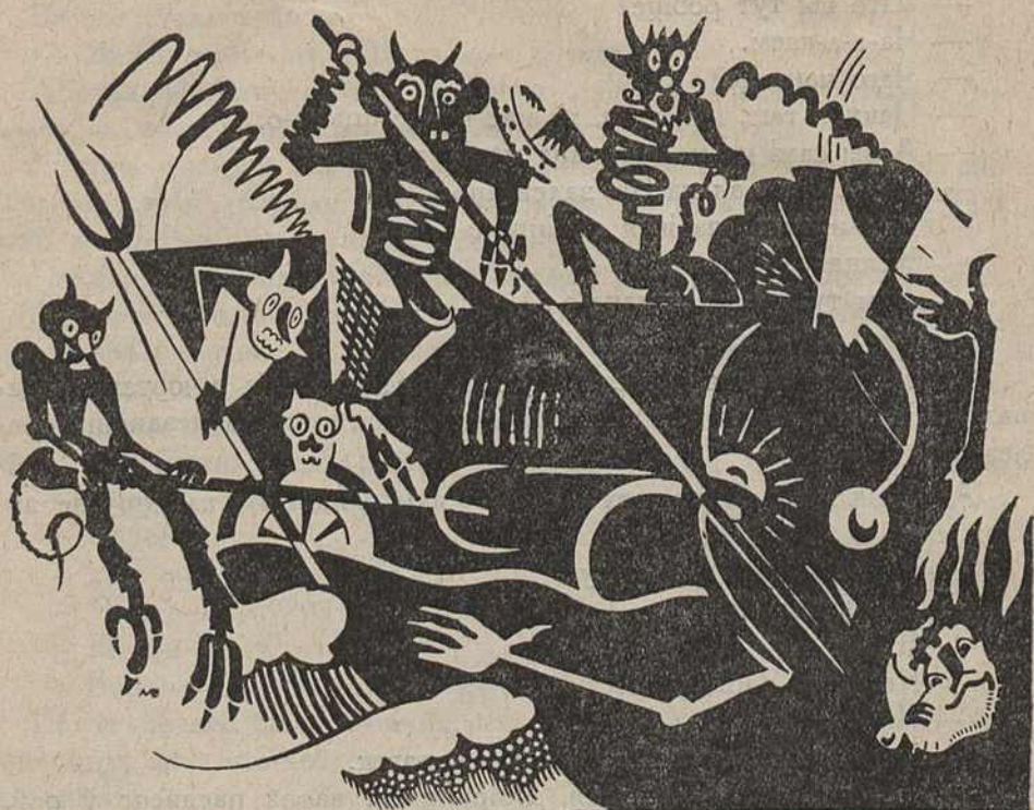
Цягнік з грукатам падляцеў да станцыі.

— А хто яго ведае? У кожным разе тут лепш, чымся на зямлі. Прынамсі, адпачыць можна. А ў рай хай сабе паны ідуць,—куды нам совацца за імі?—махнуў рукою селянін і пашоў далей.