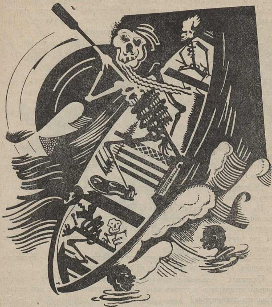
Харон перацягнуў такі іх вяслом па галаву.

— Ур-р-а-а!—зараўлі абодва.—Хай жывуць непераможныя піонэры! Цяпер мы задамо такога перцу, што ўсім чарцям мласна будзе!