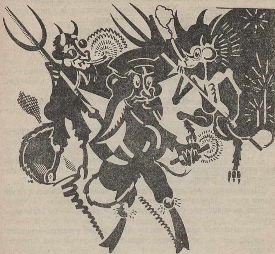
На пляцформе хадзіў начальнік станцыі.