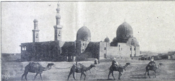
ပြုစုရေးရာ ၂၄ ကို ဘီစီ ၂၅၀ နှစ်

ပြုစုရေးရာ ၂၄ ကို ဘီစီ ၂၅၀ နှစ် ဘာသာရေး ပြုစုရေးရာ ဖြစ်ကြောင်း ဖော်ပြပါသည်။