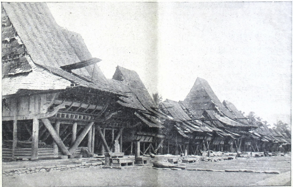
ပြည်ထောင်စု နေ့စဉ် အကျဉ်းချုပ် အကျဉ်းချုပ် အကျဉ်းချုပ်