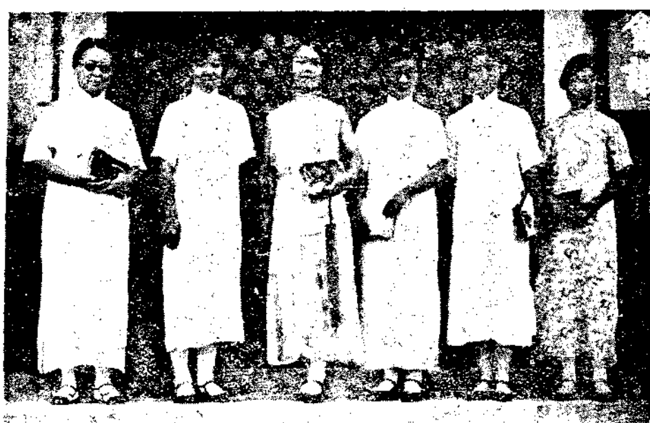
全國體育會議全體女會員

案，據多數意見，認為津貼獎勵，不屬行政經費問題，而與考成則略有關係；議決：轉交考成及其他組審查。