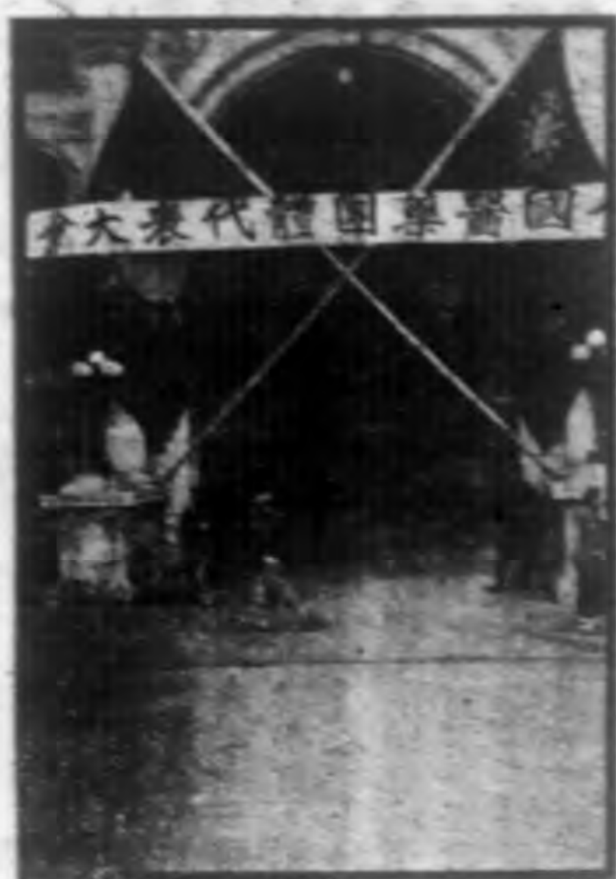
◁日七十月三年八十國民▷

語。「中醫中藥。關係國人生命。一日不可缺少。西醫界不應利用政治勢力。希圖廢止遺毒。藉以推銷西藥」。一請國人注意清滅中醫之背反」。一擁護今日舉行之全國醫藥團體代表大會」。一罷工半日。表示我們的力量。是否有影響於民衆」。等標語。情形甚爲緊張。至午時藥店始行照常營業。而全市中醫二千餘人。則同時開始休業半日。秩序頗爲整齊。