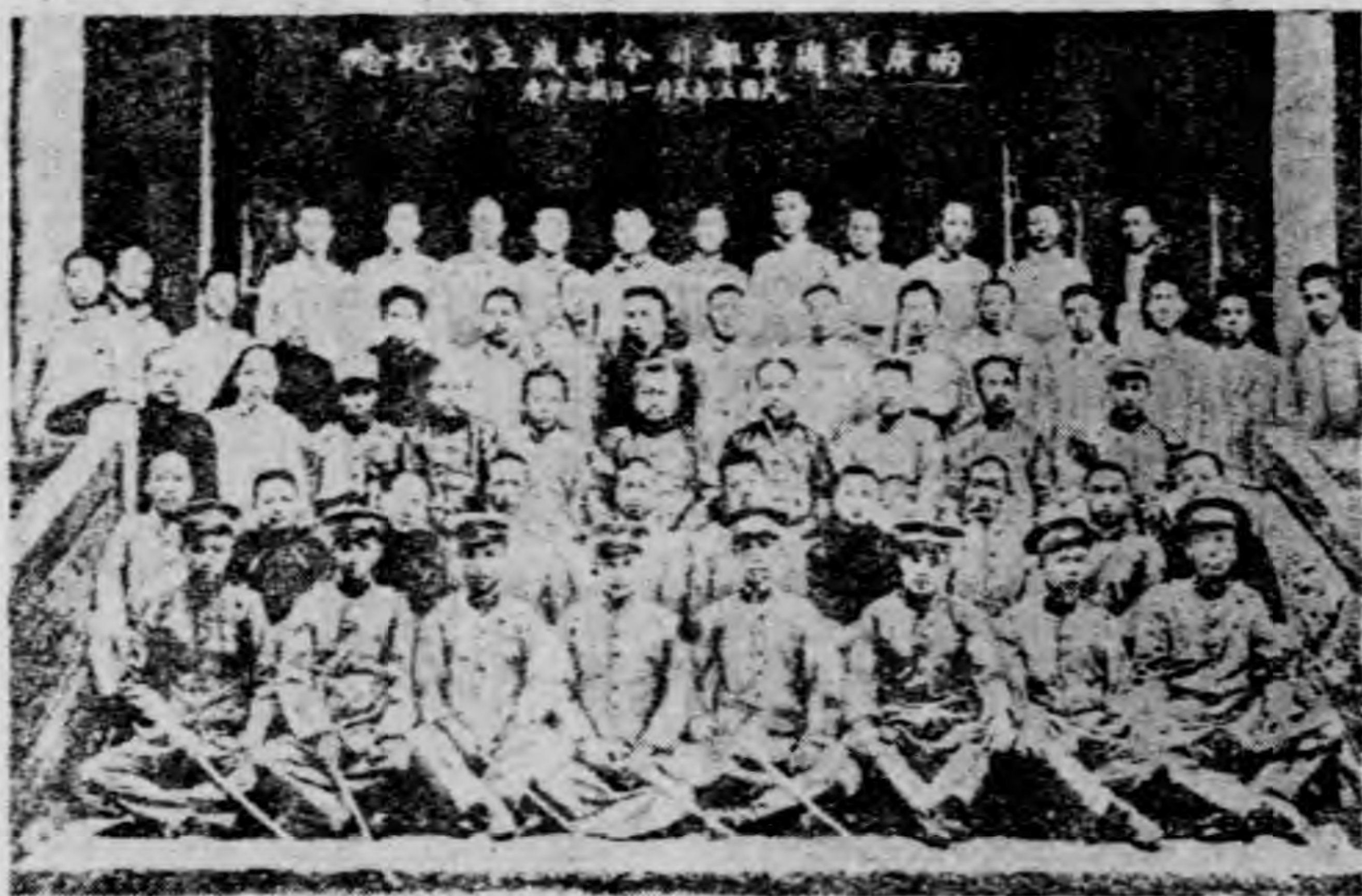
圖四 兩廣護國軍都司令部成立攝影

年的時候，日本向中國提出了這樣無理的要求，就等於要將中國完全吞併下去的一樣。可是當時正在做皇帝夢的袁世凱，竟答應接受這亡國的二十一條了，凡是個稍具愛國心的人，沒有不憤慨的。袁氏得到日本的援助以後，便積極地進行他做皇帝的好夢，革命黨同志至此忍無可忍，便決計重興討袁之師。英士先生在日本和各同志計劃結果，以西南部分袁氏的兵勢較弱，在西