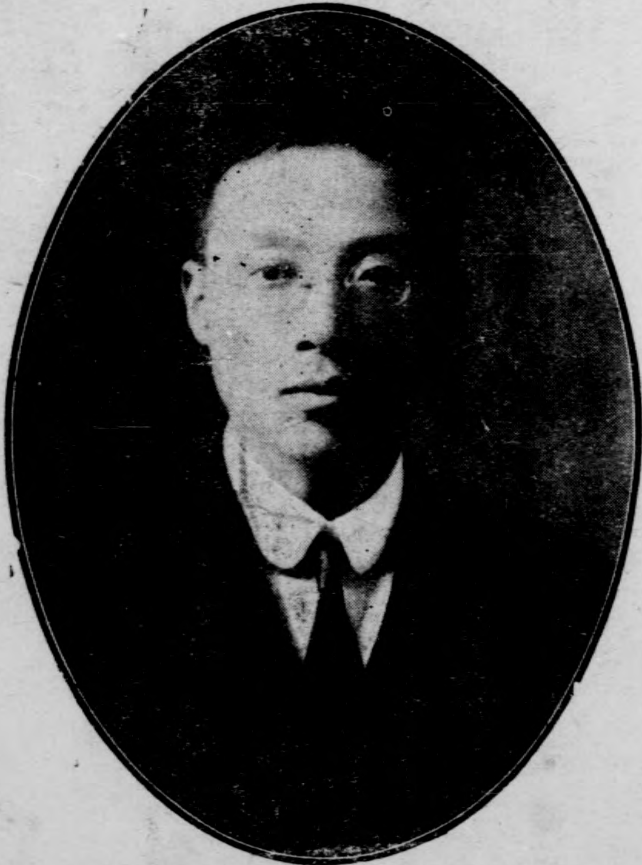
陳 英 士 像