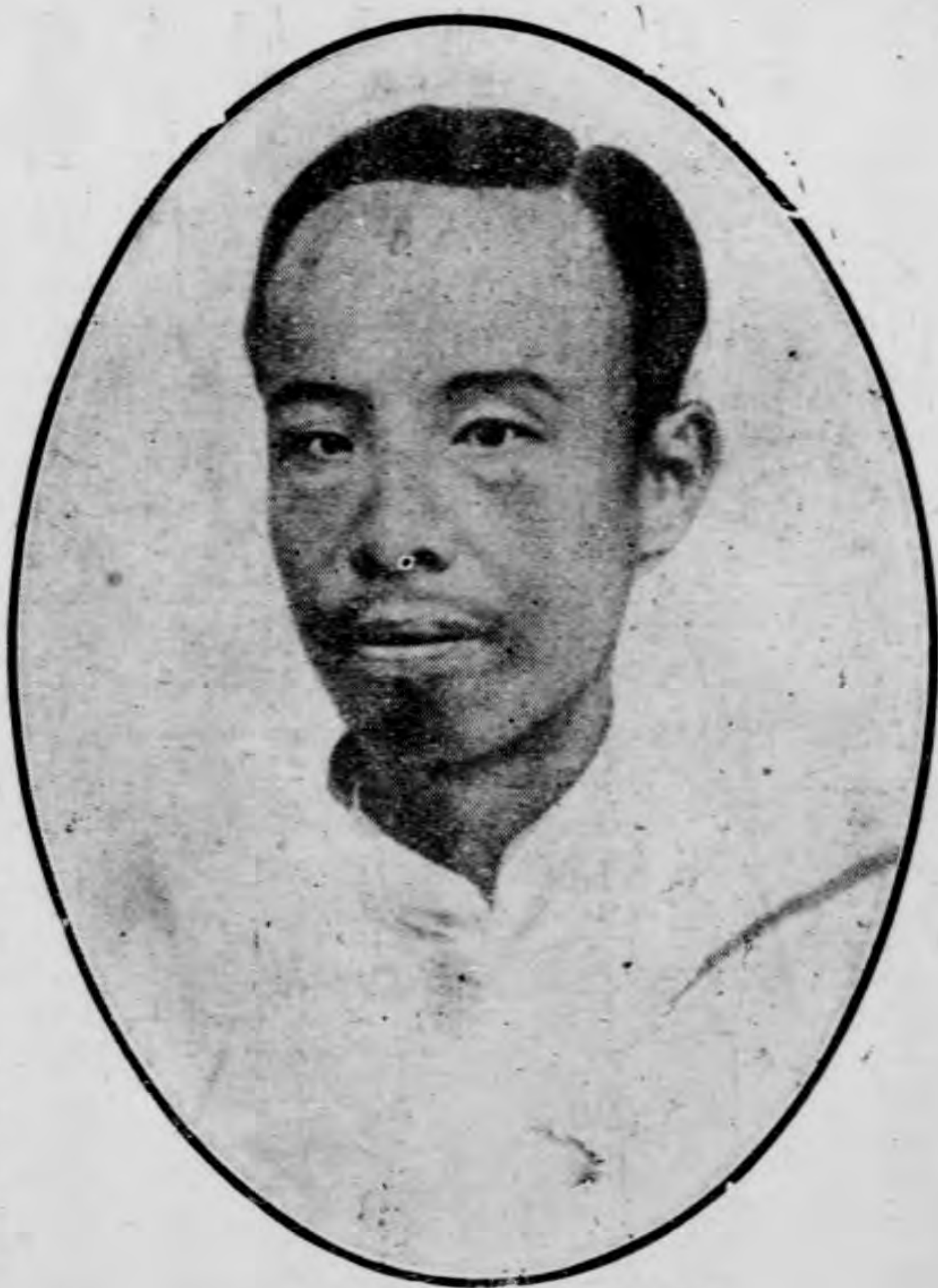
圖 二 徐 錫 麟 像