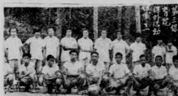
↓隊球的勝百戰百(一)