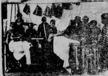
↑館萬手雙聖神工勞(四)