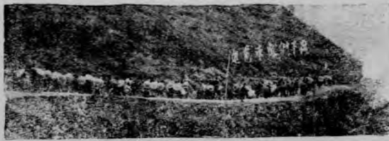
↑ 隊前進之像一般 (五)