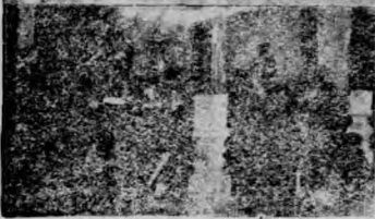
(四)學習與勞動打頭←片↑