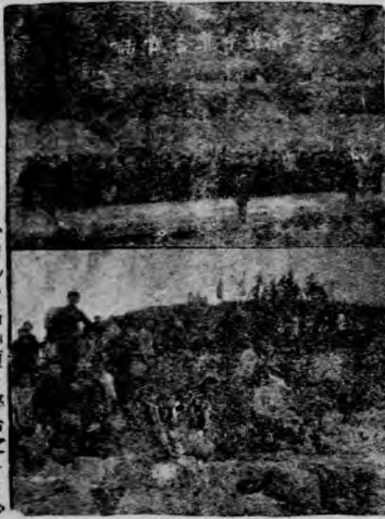
(四) 岩石山頂上集合之一角