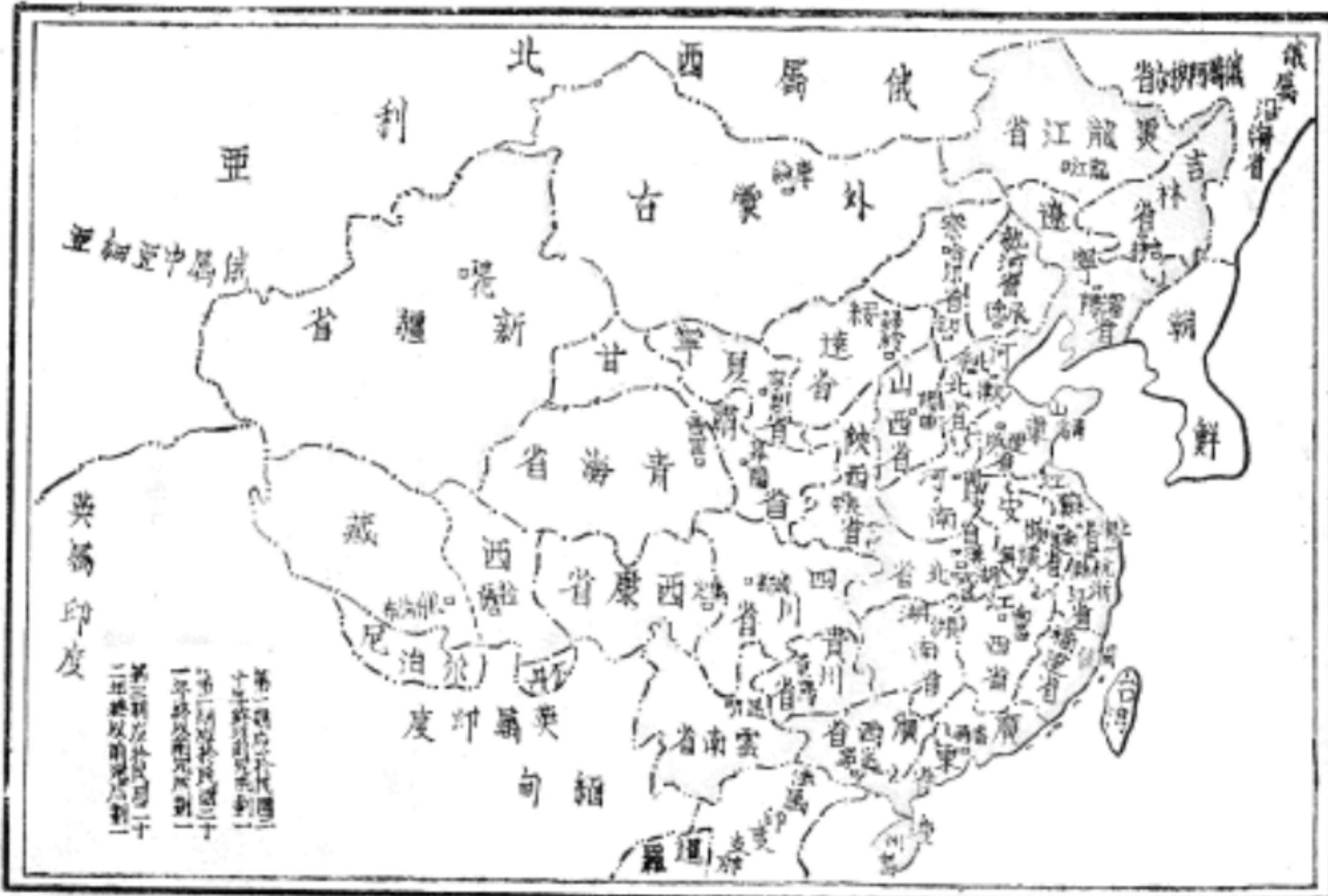
全國度量衡劃一程序圖