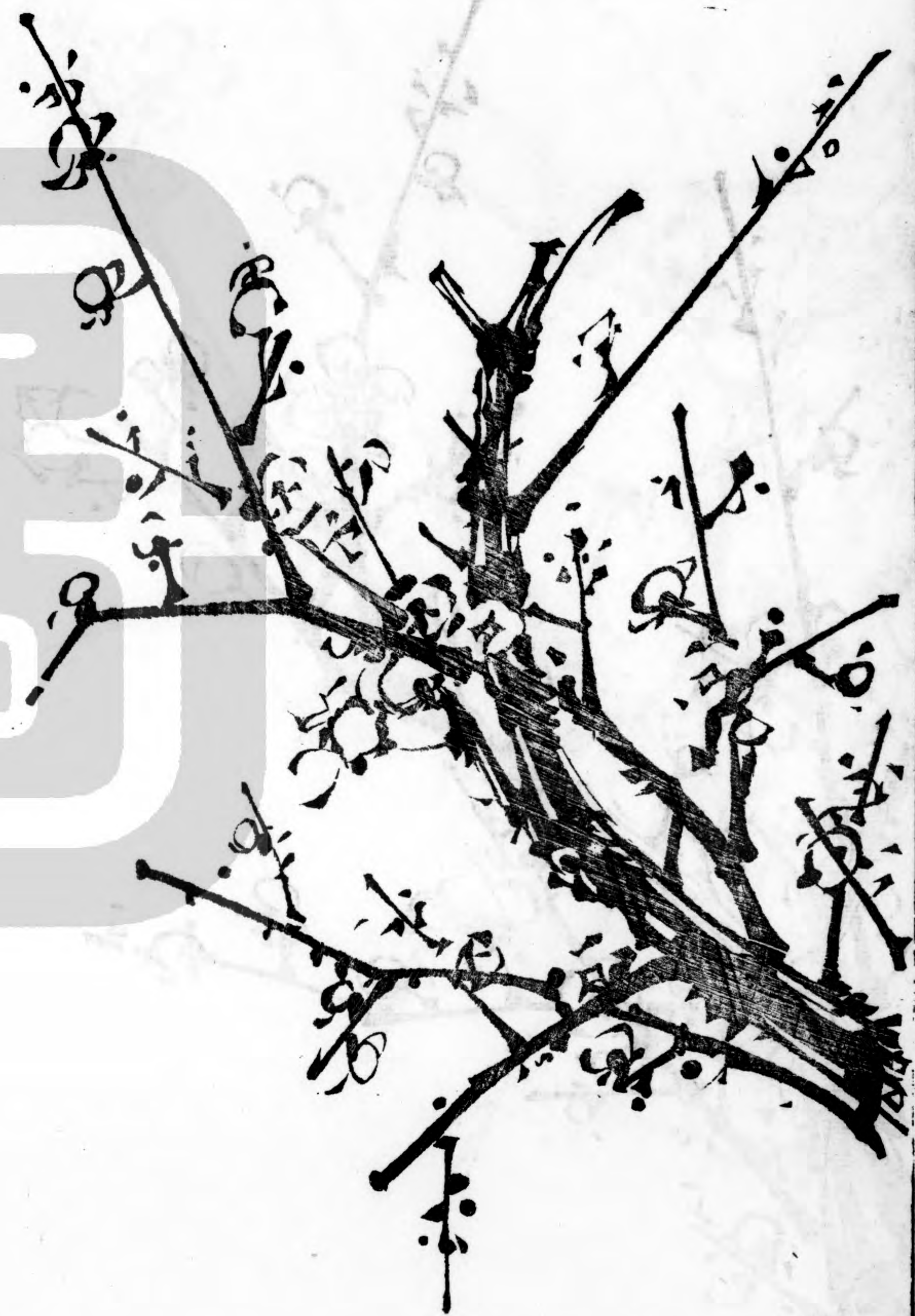
珠胎乍裂 斗柄初升