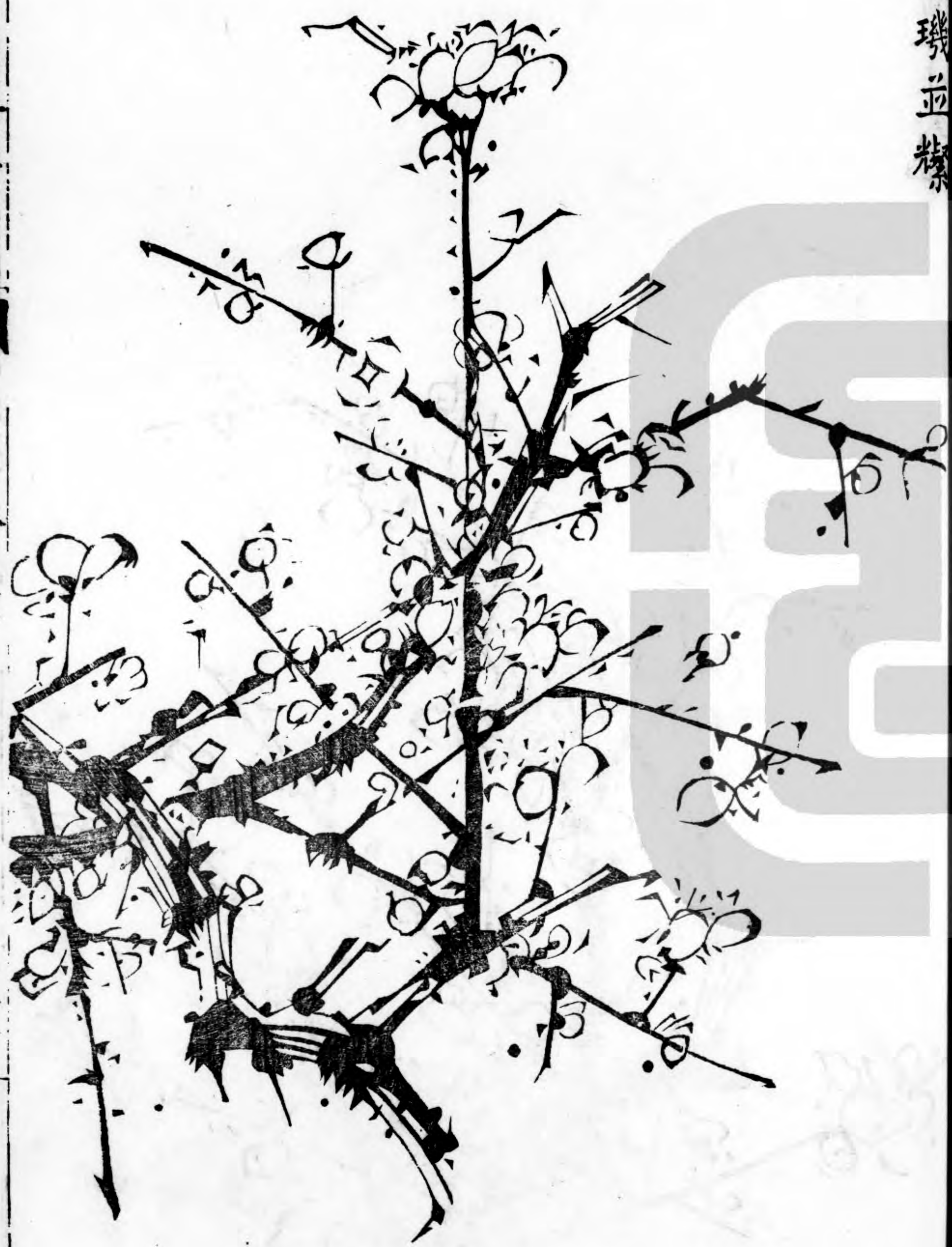
雲月交輝 珠璣並耀