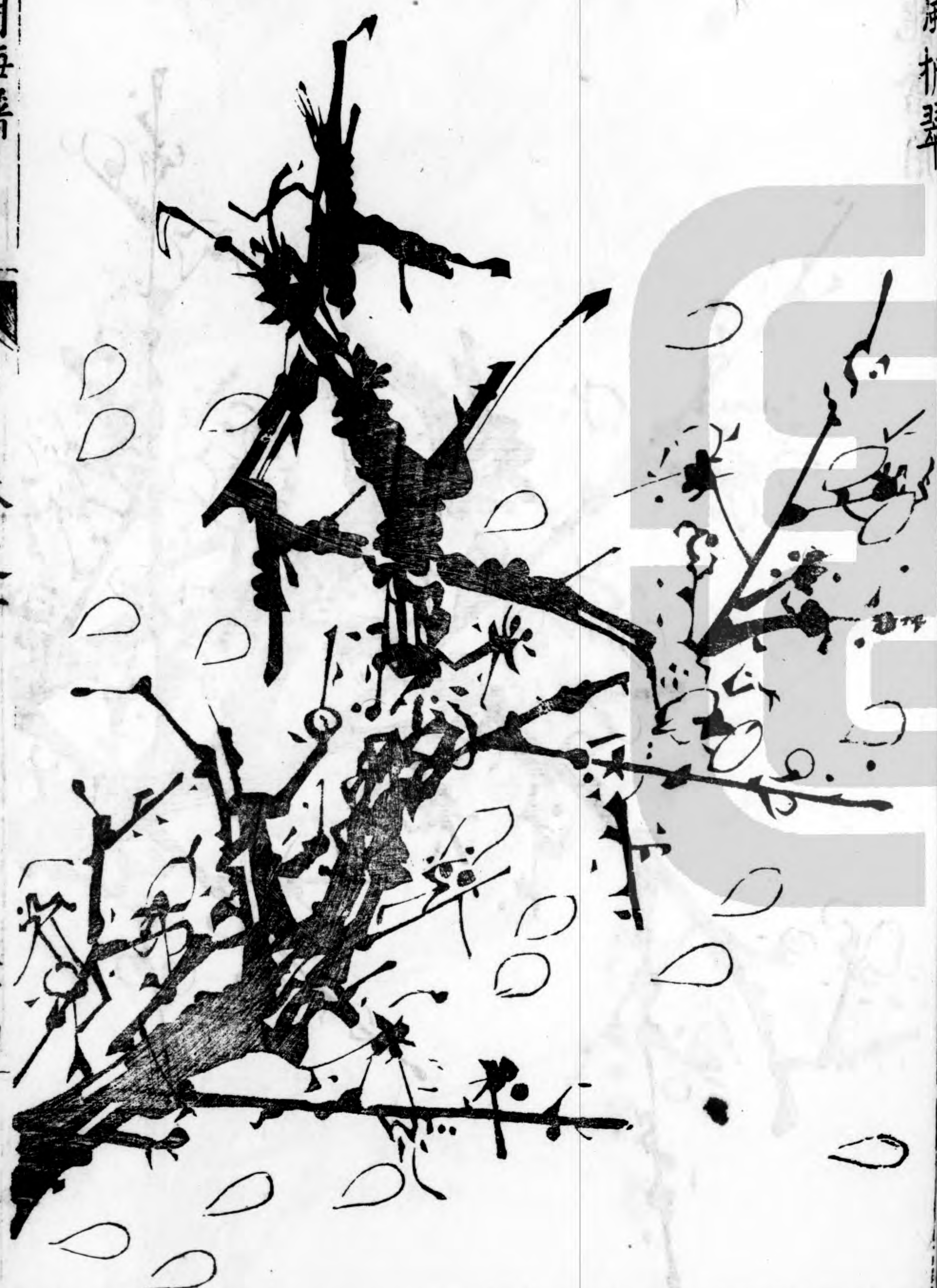
深谷回春 狂風折翠