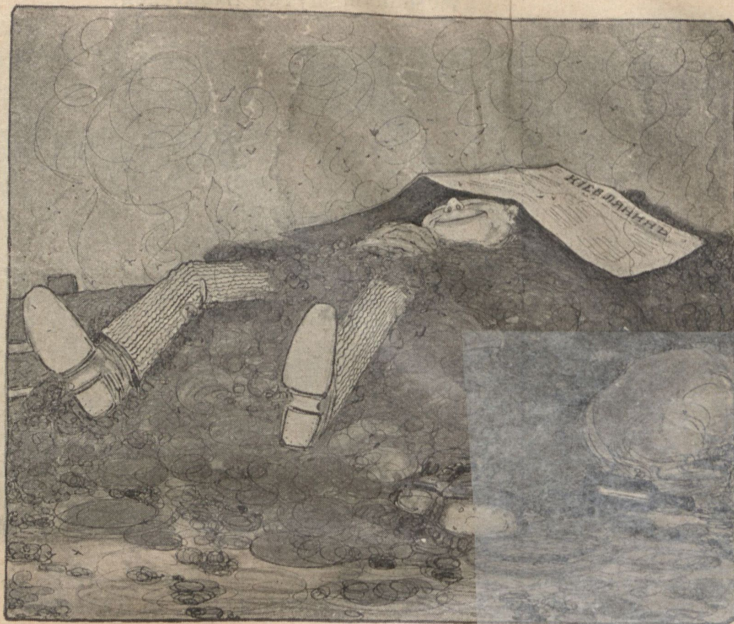
Иллюстрація къ иллюстраціи. „Ради Бога не трогайте нашего родного, самобытного навоза“.

— О, дорогие поселяне! То, что я узнал, переполняет мое сердце радостью и тихим восторгомъ. Провижу я в будущемъ поднятіе нашего благосостоянія, утучненіе полей, изобиліе плодовъ, расцвѣтъ грамотности и подъемъ великой, любимой нами, матушки—Россіи... О, какая пріятная вѣсть принесена намъ! О, какое прекрасное событие обѣщаетъ намъ свѣтлое будущее... О! Знаете ли вы, что Гучковъ избранъ предсѣдателемъ Думы?!! („Сатирик.“)