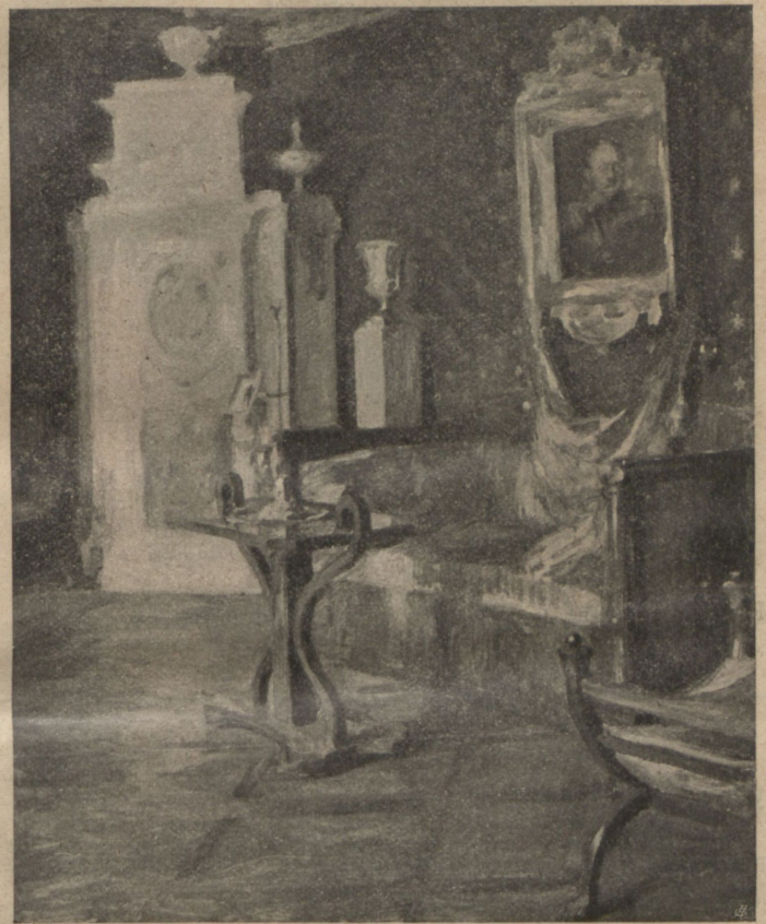
Комната Александра I.