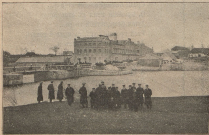
Феодоровскій фарфоровый заводъ въ с. Токаревкѣ, Волынск. губ., который осматривали экскурсанты.