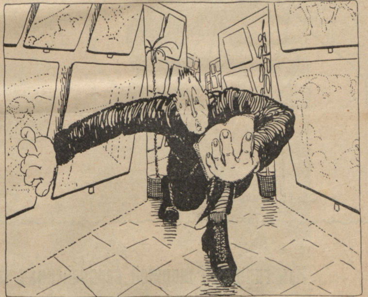
1540-й Борисовъ-Мусатовъ... 2333-й Рерихъ.