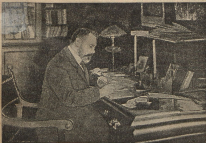
Предсѣдатель Г. Думы А. И. Гучковъ въ своемъ рабочемъ кабинетѣ.