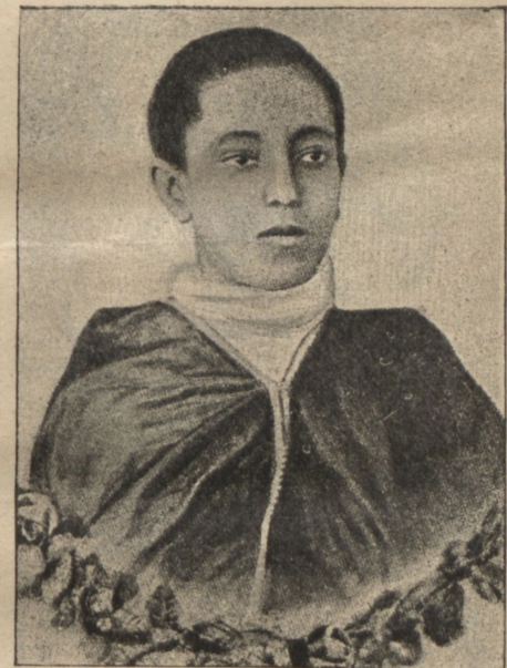
Лиджъ-Яссу, наслѣдникъ негуса Абиссиніи.