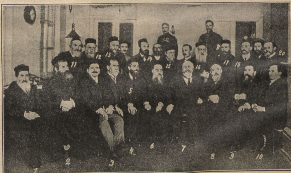
Группа участниковъ съѣзда.