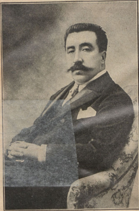
Камилль Шевильяръ. (Къ предстоящему симфоническ. концерту).