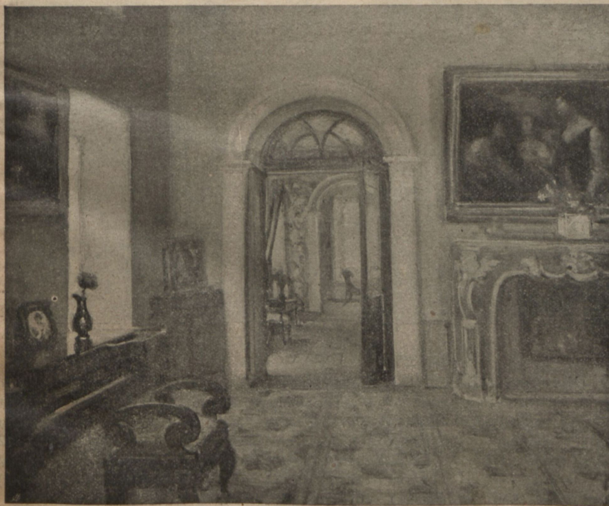
Комната кн. Шаховской.