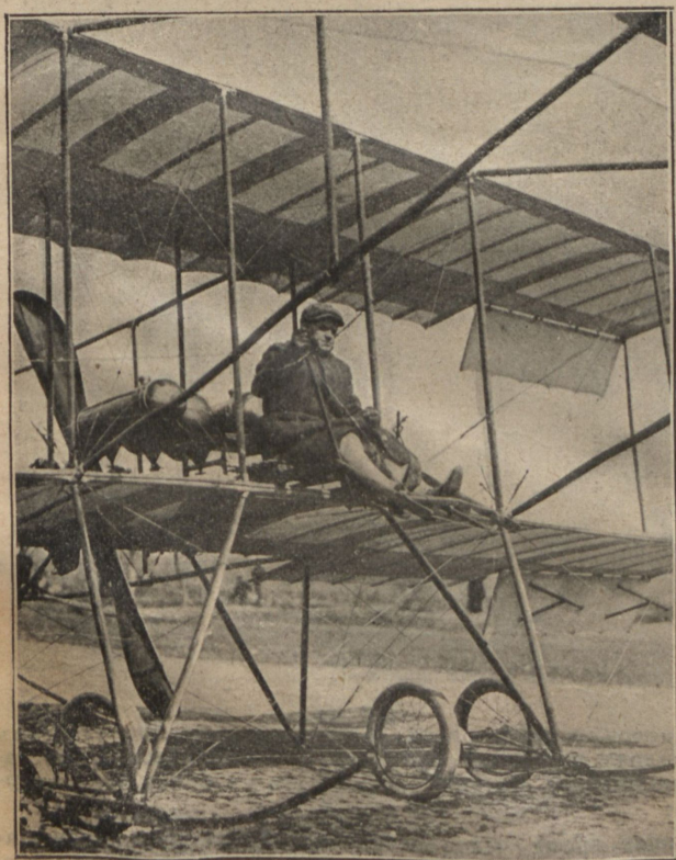
С. Н. Уточкинъ. Новый русскій авіаторъ, совершившій рядъ удачныхъ полетовъ.