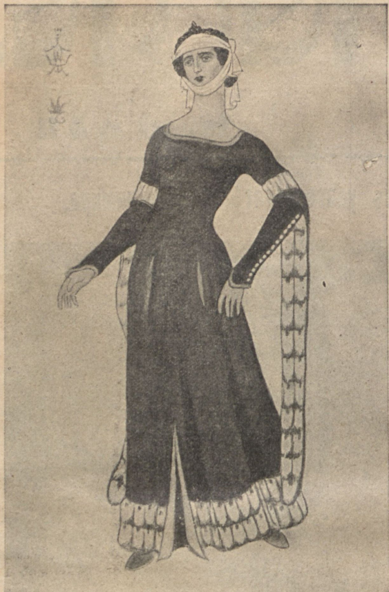
М. Добужинскій. Эскизъ костюма Франчески.