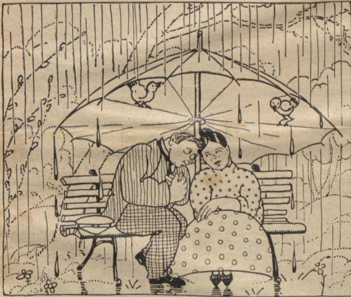
Весна въ Кіевѣ.