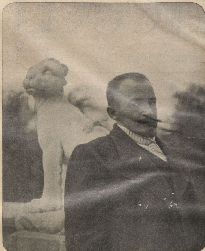
В. Э. Борисовъ-Мусатовъ. (Къ выставкѣ его картинъ въ Кіевѣ).

Другихъ очей печаль, съ слезинкою дрожащей, Готовою упасть съ опущенныхъ рѣсницъ... И сердце въ тотъ-же мигъ сжимается невольно, И рвется къ ней, родной, тоскуя и любя,— И весь я съ ней одной,—и такъ мнѣ больно, больно,— И думая о ней,—я не хочу тебя!..