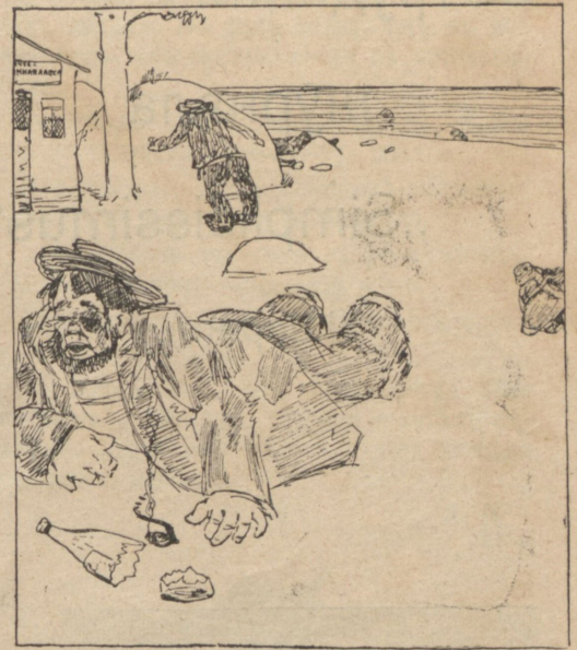
Кромѣ превосходной культуры, чего „недостаётъ“ Финляндіи. („Крив. Зерк.“).