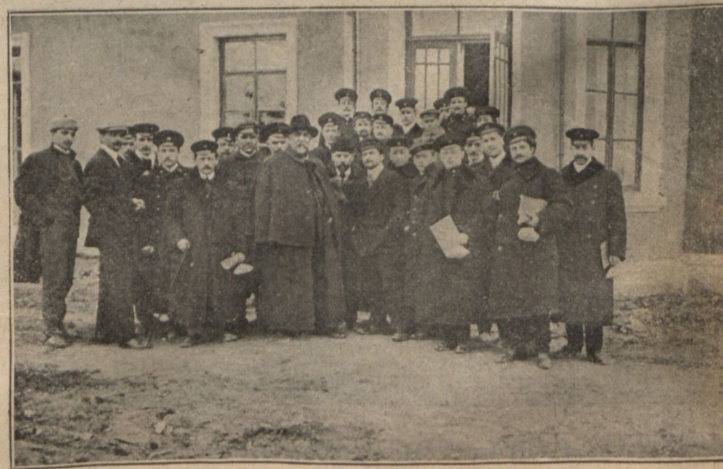
Группа экскурсантовъ съ владѣльцемъ завода, передъ отъѣздомъ.