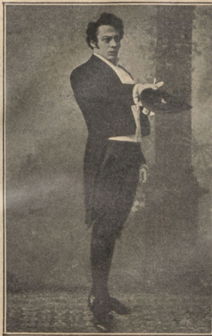
П. В. Самойловъ въ роли Чацкаго.