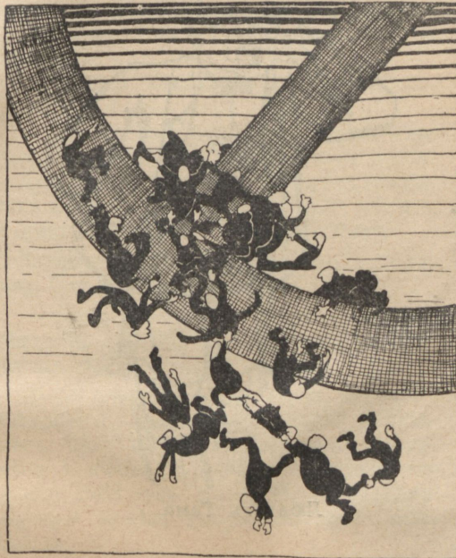
Нѣтъ, господа, не повернуть вамъ назадъ колеса исторіи!