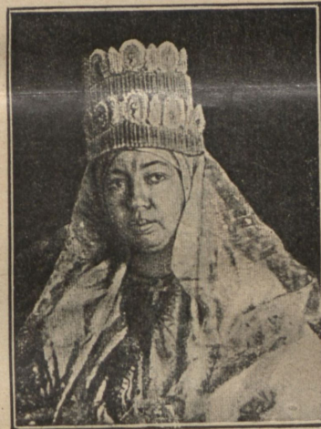
Абиссинская императрица Тайту, супруга императора Менелика.