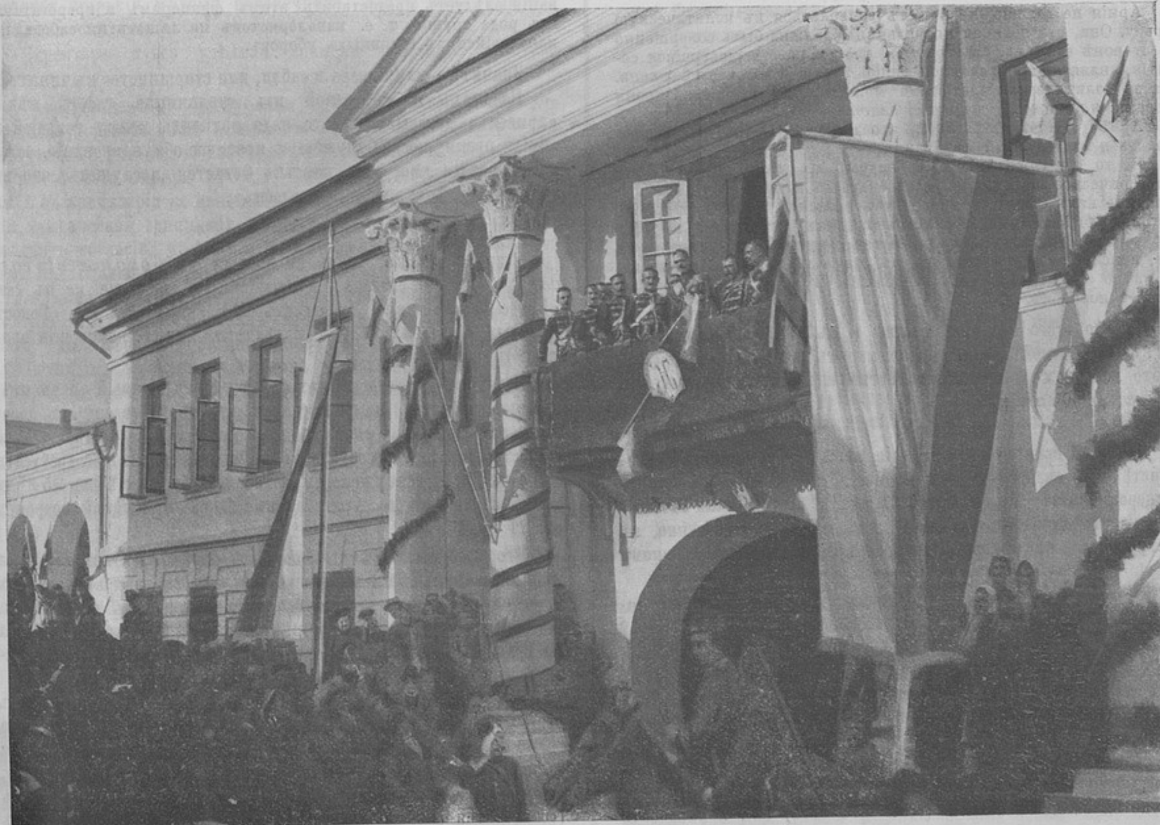
На балконѣ офицерскаго собранія. (Къ кор. «Елецъ».)

Мнѣ, неспециалисту, сдается, что при условіи преобразования академіи въ специальный военно-медицинскій институтъ сюда слѣдуетъ направлять на годъ—на два лицъ, успѣшно окончившихъ курсъ одного изъ медицинскихъ факультетовъ. Дабы гарантировать достаточное количество состава, военному вѣдомству придется учредить какъ при академіи, такъ и при университе-