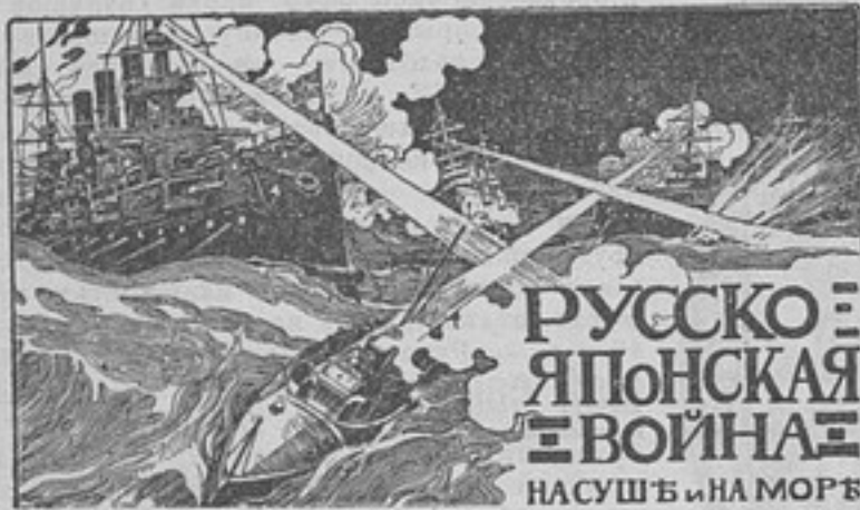
РУССКО-ЯПОНСКАЯ ВОЙНА НАСУШЬ И НА МОРѢ

При участіи художниковъ баталлистовъ: И. А. Владимірова, В. В. Игнаціуса († командиръ броненосца «Князь Суворовъ»), Н. Н. Каразина, Н. И. Кравченко, И. И. Крылова, А. Г. Орлова, Н. С. Самокиша, А. П. Сафонова, В. А. Табурина, О. Шарлеманя и др.