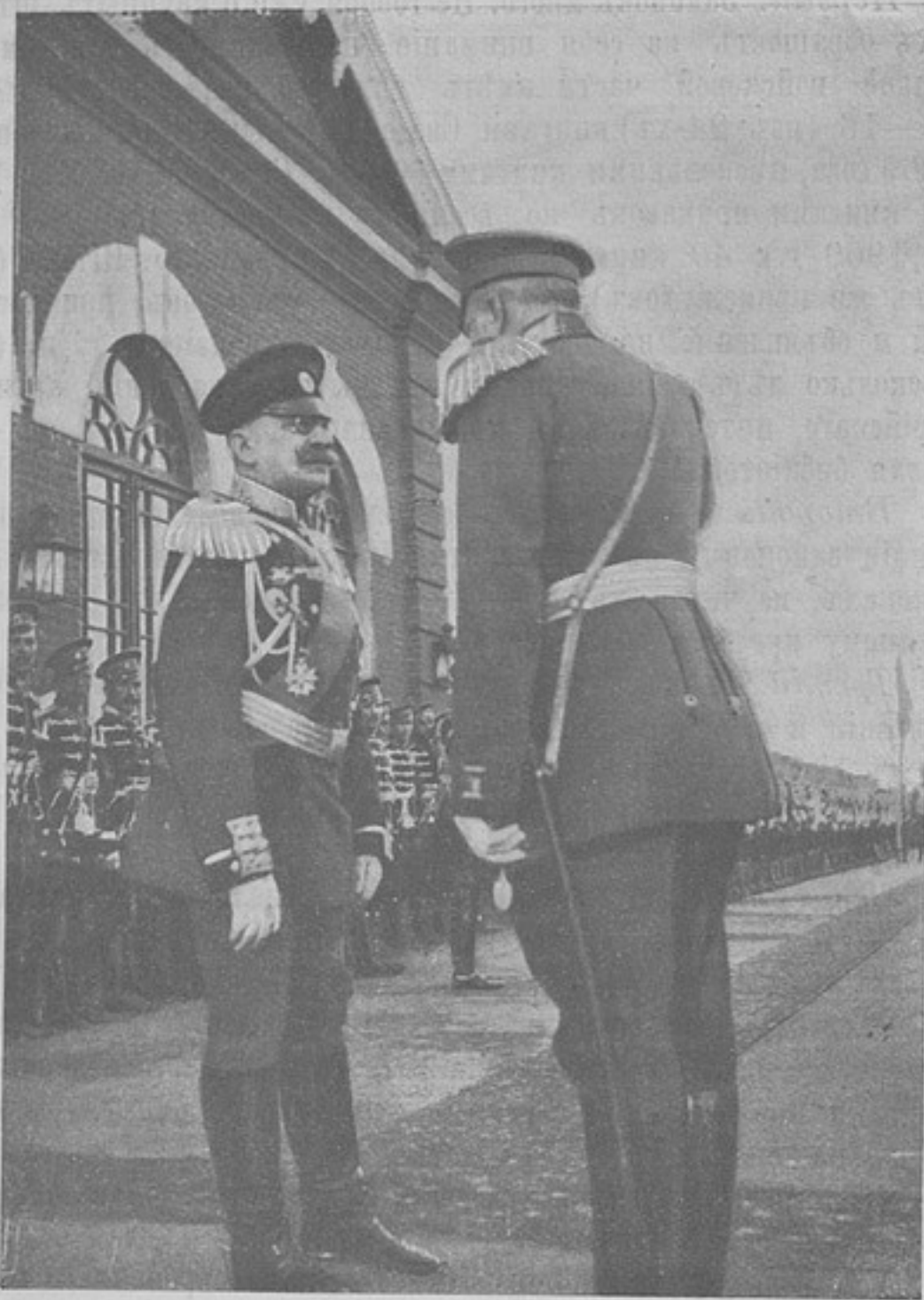
Командующій войск. Москов. воен. округа, ген.-отъ-кавал. Плева. (Къ кор. «Елецъ»).

ни приказъ, то къ нему многотомныя разъясненія, измѣненія, дополненія и, что хуже всего, толкованія , въ дебряхъ которыхъ подчасъ случается заблудиться и самимъ толкователямъ.