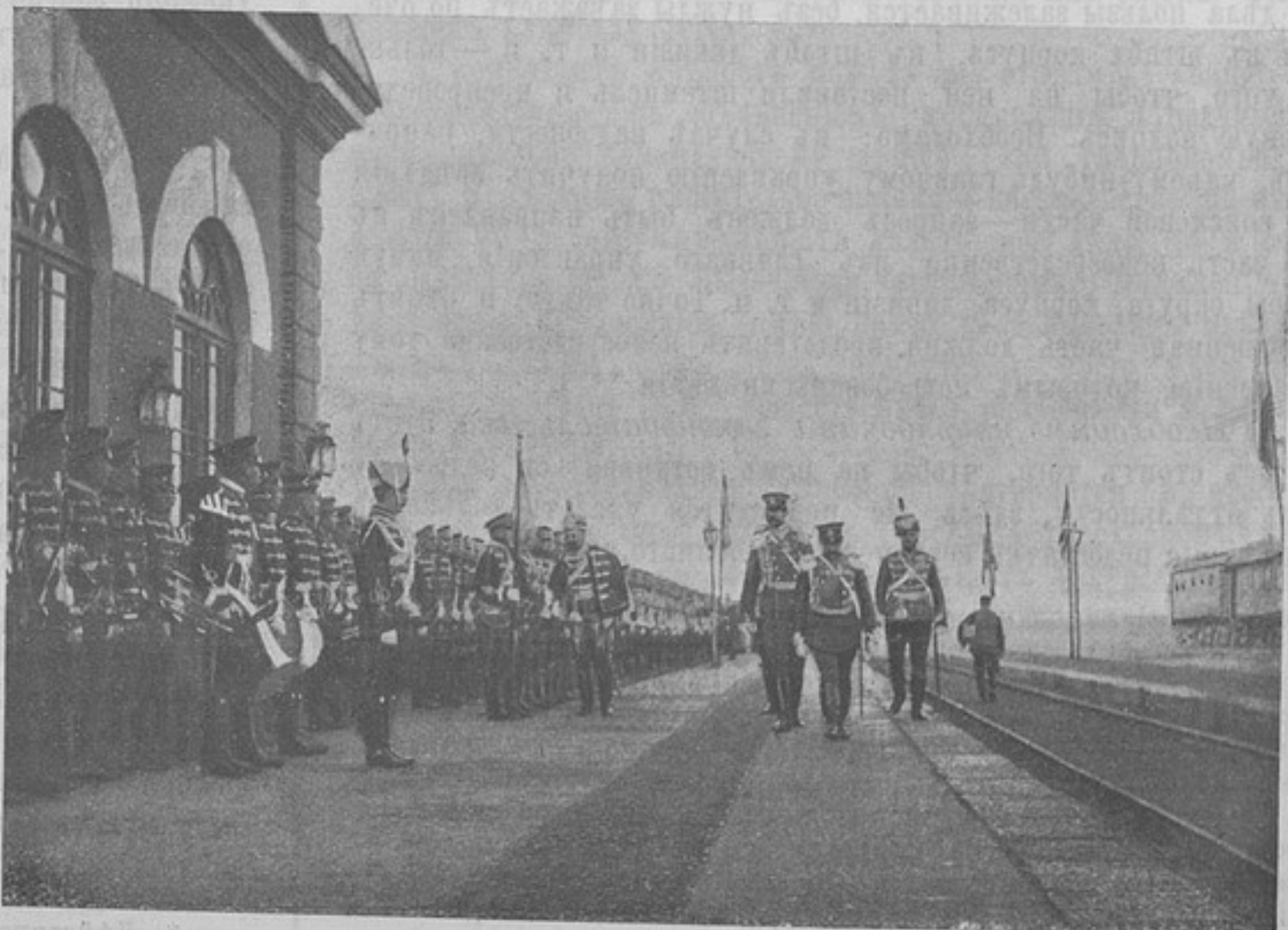
Командующій войсками Москов. воен. округа ген.-отъ кавалер. Плева обходитъ почетный караулъ. (Къ кор. «Елецъ»).