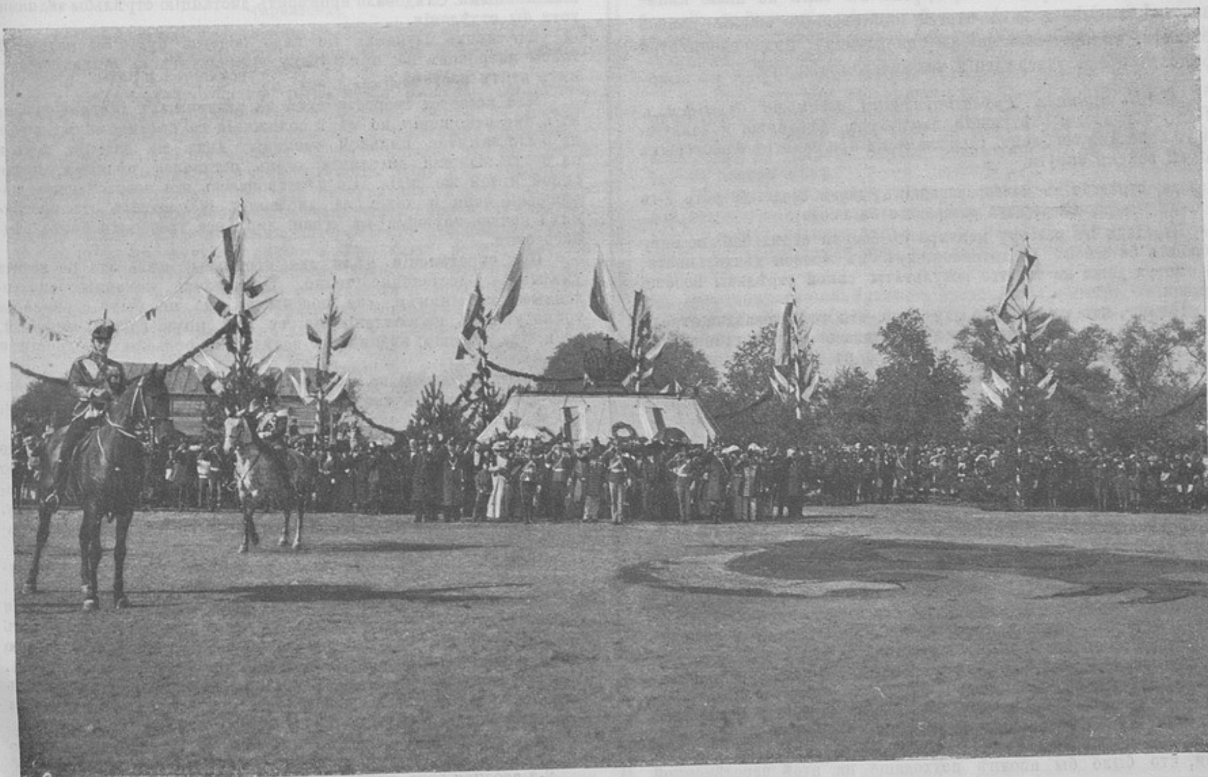
Передъ церемоніальнымъ маршемъ. (Къ кор. «Елецъ»).

Согласно приказа войскамъ Кавказскаго военнаго округа 6 октября с. г. за № 264, нижеслѣдующія мѣстности при- числены къ среднему поясу: Карсская область, Ставропольская