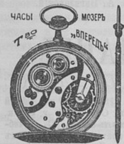
часы МОЗЕРЪ Т. 20 «ВЪПЕРЕДЪ» цѣпочка съ брелкомъ «компасъ». Просимъ обратить вниманіе на надписи «Мозеръ» и остерегаться поддѣлокъ. (319) 8-6

Мозеръ—крупнѣйшій фабрикантъ часовъ, пользующійся всемірной извѣстностью. Мозеръ не выпускаетъ изъ своей фабрики не точно вывѣренныхъ часовъ, надписи Мозеръ служатъ лучшей гарантіей ихъ качества, прочности и вѣрности. Часы Мозеръ черной ворон. стали мужскіе открытые очень плоскіе (приблиз. въ сер. рубль) съ фаян. позол. или серебр. циферблатомъ, заводъ безъ ключа, ремонтуръ на 10 камняхъ, фасонъ новомодный, явщный (цѣна только на время понижена) вмѣсто 10 р. только 3 р. 15 к., 2 шт. 6 р., такіе же часы плоскіе «Мозеръ», закрытые 4 р. 15 к., 2 шт. 8 р. Выпишите и всегда будете намъ благодарны, каждые часы снабжены ручат. на 6 лѣтъ, перес. до 4 шт. 40 к. (въ Сибирь 75 к.) Выс. съ налож. плат. и безъ зад. Адр.: Т-во «Впередъ» Варшава, Панская 39 отд. 41. БЕЗПЛАТНО прилаг. изданіи новомодн.