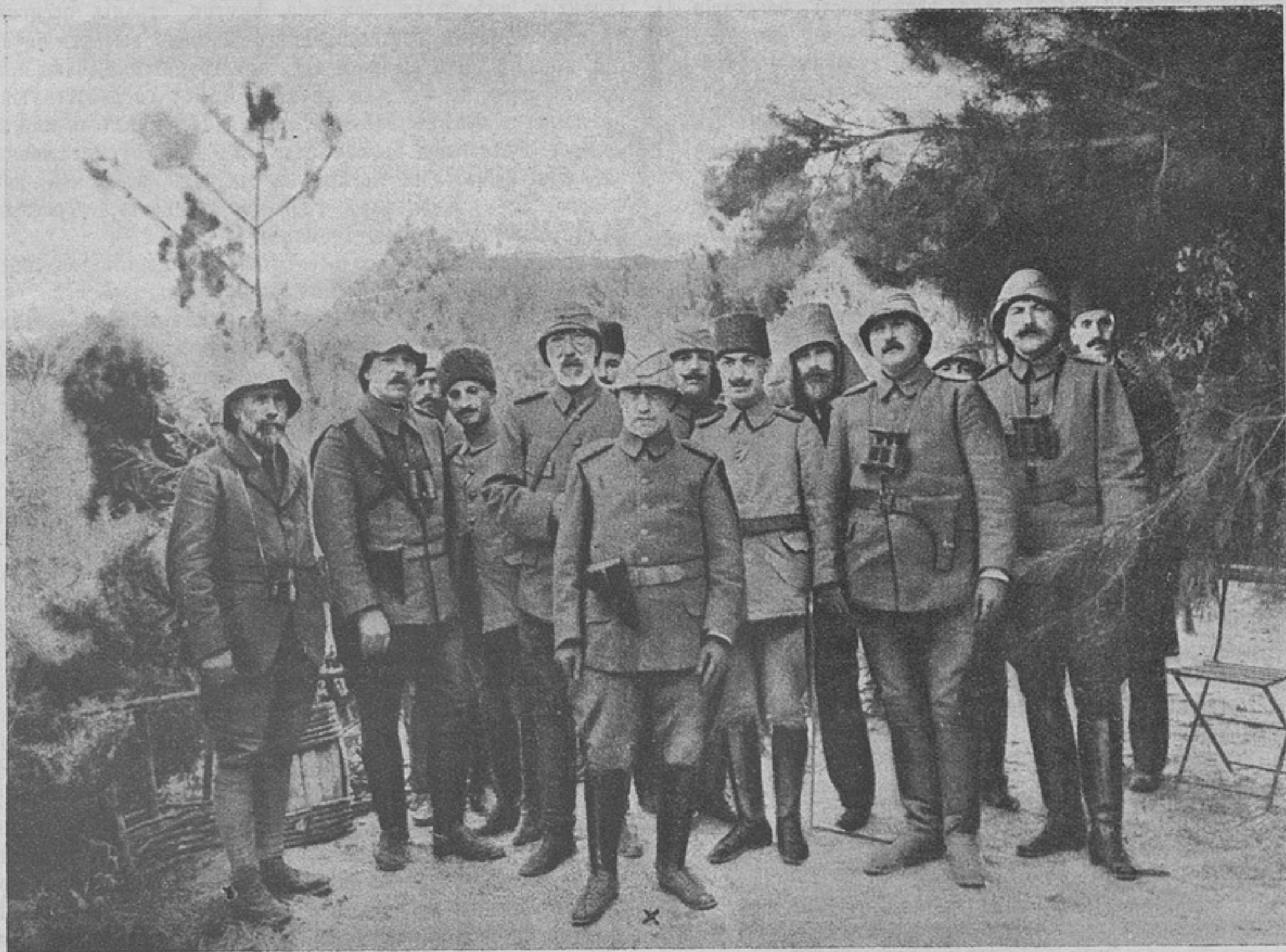
Турецкій наслѣдникъ со своимъ штабомъ въ Галиполи. („Weltspiegel“.)

товъ. Всѣ эти лишеныя, само собою разумѣется, не преминуть дать себя почувствовать въ будущемъ. Заставить, въ буквальномъ смыслѣ слова, голодать огромную страну — задача не выполнимая; единственно чего можно будетъ добиться, это стѣсненія ея экономической жизни. Но и такого рода результатъ является въ достаточной мѣрѣ полезнымъ, такъ какъ несомнѣнно оказываетъ вліяніе на нравственное состояніе противника.