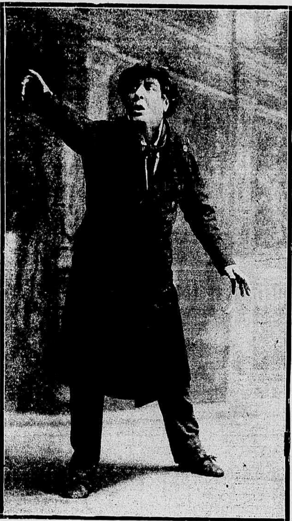
O ACTOR HUGUENET NA PEÇA "SIRE", DE HENRY LAVEDAN

Huguenet estreará no Municipal na segunda quinzena de junho