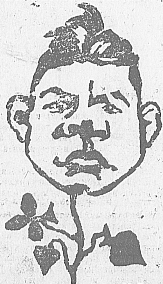
Рисунок на динолуме худ. Н. Дризе