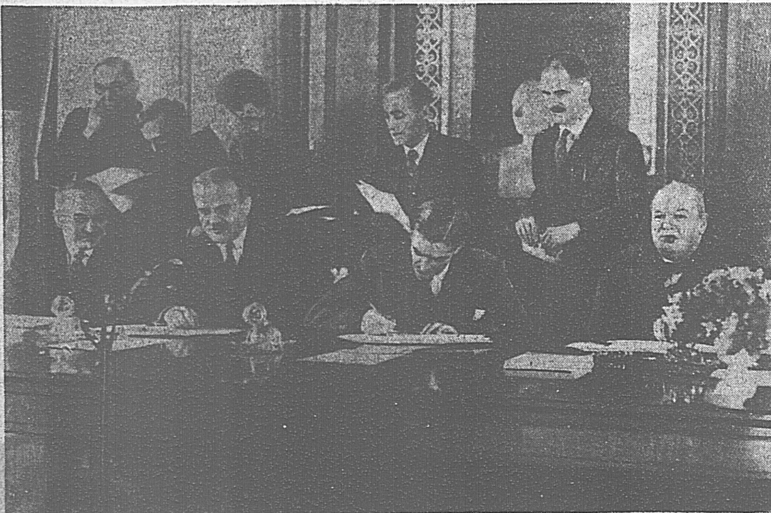
К подписанию Союзного договора между СССР и Великобританией. На снимке: сидят (справа налево): Премьер-Министр Великобритании У. Черчилль, министр иностранных дел А. Иден, Народный Комиссар Иностранных Дел В. М. Молотов, посол СССР в Великобритании И. М. Майский.

Перед возвращением на родину позволяю выразить Вам, Господи Государственный Секретарь, свою искреннюю благодарность за Ваше личное участие в переговорах, имевших место в Вашингтоне, и Вашу помощь, оказанную мне в выполнении моей миссии. Прошу принять мои наилучшие пожелания успехов в Вашей плодотворной деятельности на пользу нашего общего дела. В. МОЛОТОВ.