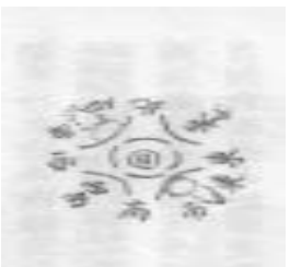
此係下午三時之象也左右圓光外又發出兩道芒角直射半天其餘灣環色如虹

日止太陽連生背弓雙單各珥初八日忽有三個太陽其本日居中兩旁日光微小因天霧濛濛光均不顯隱約中皆有圓形周圍灣環向內向外分八方自辰刻起至未刻沒其形如左