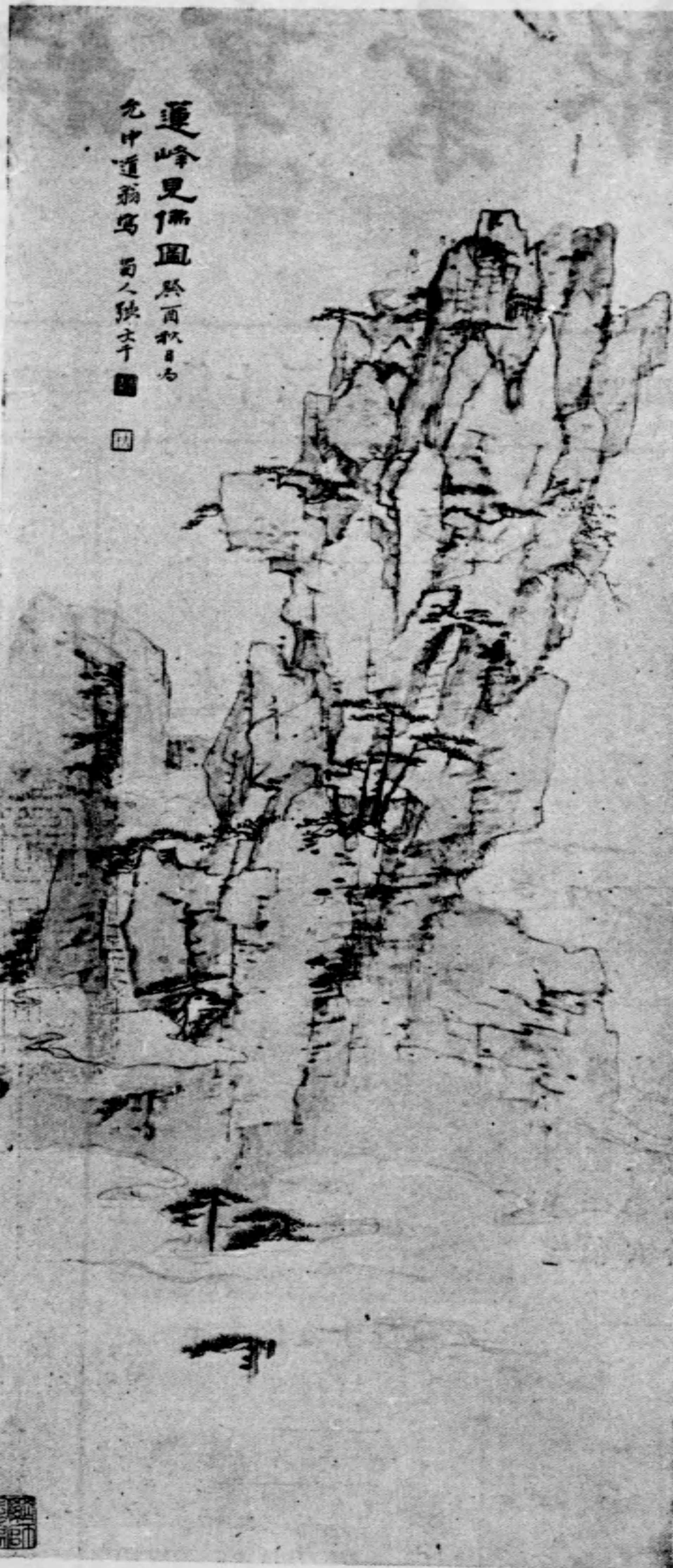
蓮峯見佛圖 張大千畫 允中道翁寫 蜀人張大千