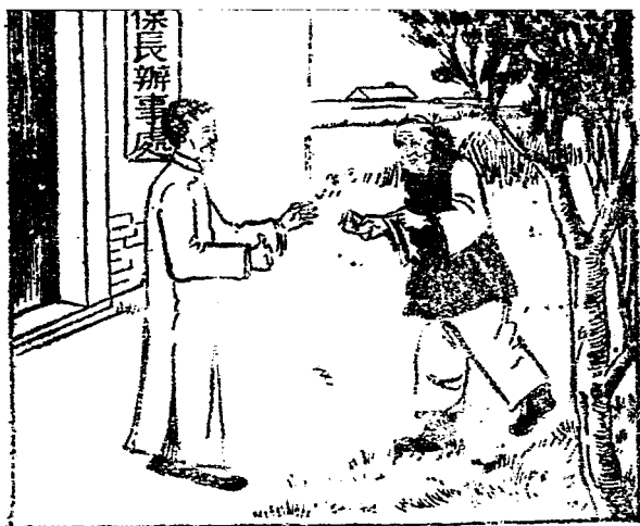
種菜老太婆捨得把棺材本捐出來救國

事，時局的治亂，好像和她無關。可是今年日本來侵略我們了，她聽人說起，心中異常憤激。她想了幾天，覺得自己老了，不能替國家出力，就把她蓄積了四十多年的棺材本一註一，一共二十元現大洋，從她床頭的大小各瓦罐中，東一壩西一塊的拿出來，親自送到保長處，要保長轉送給縣長，收