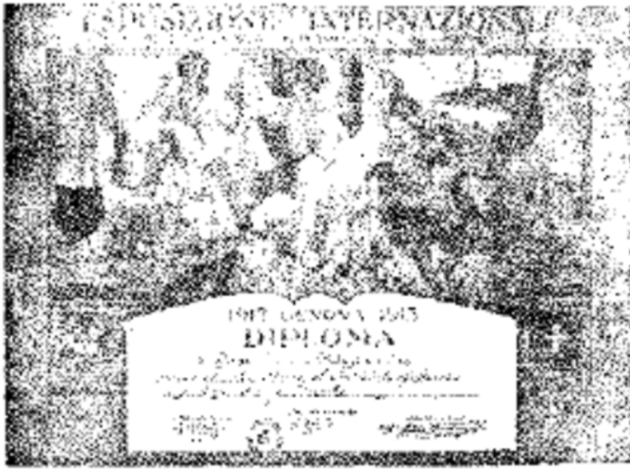
意大利奇那俄萬國博覽會對於 本書之原著所獎之金牌與獎憑