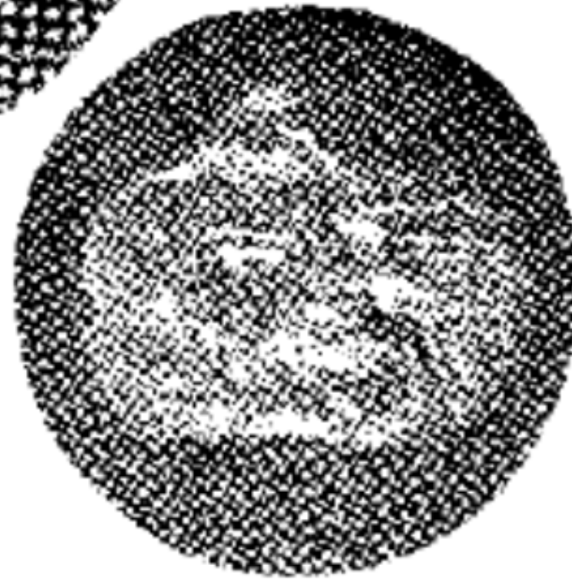
意京羅馬萬國博 覽會對於本書之 原著所獎之金牌