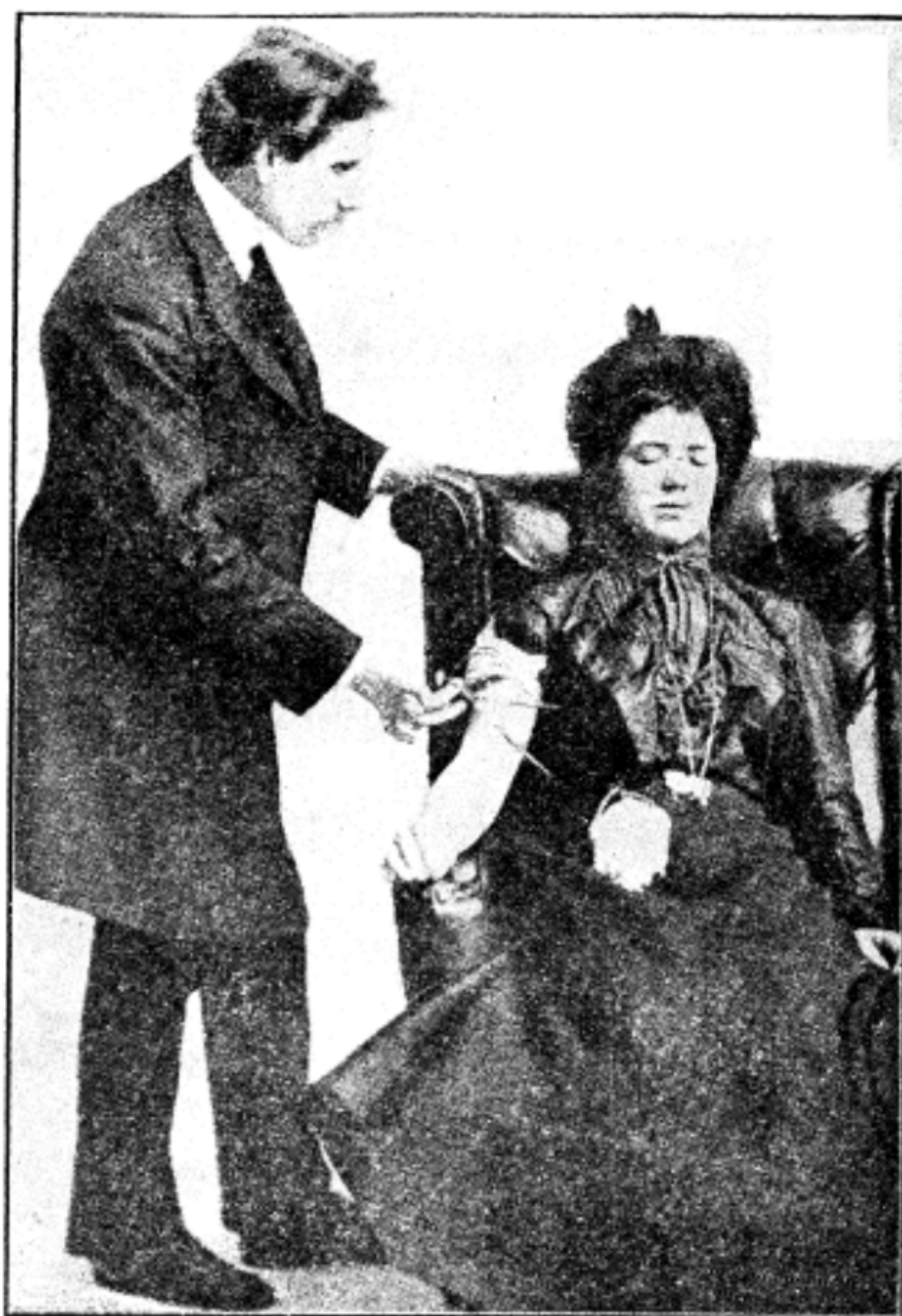
亞馬路伊那士路氏催眠術之時神采