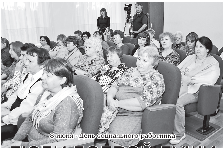
8 июня - День социального работника