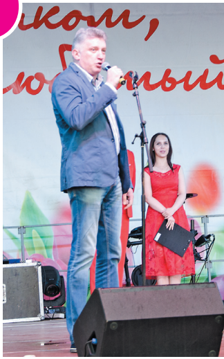
В ходе торжественной части праздника переславцев поздравил депутат областной думы Александр Кучменко