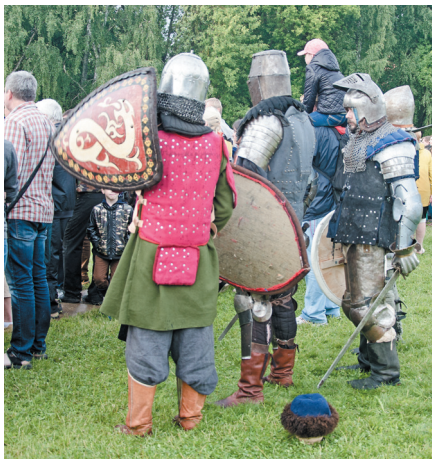
Реконструкторы в исторических костюмах эпохи Александра Невского