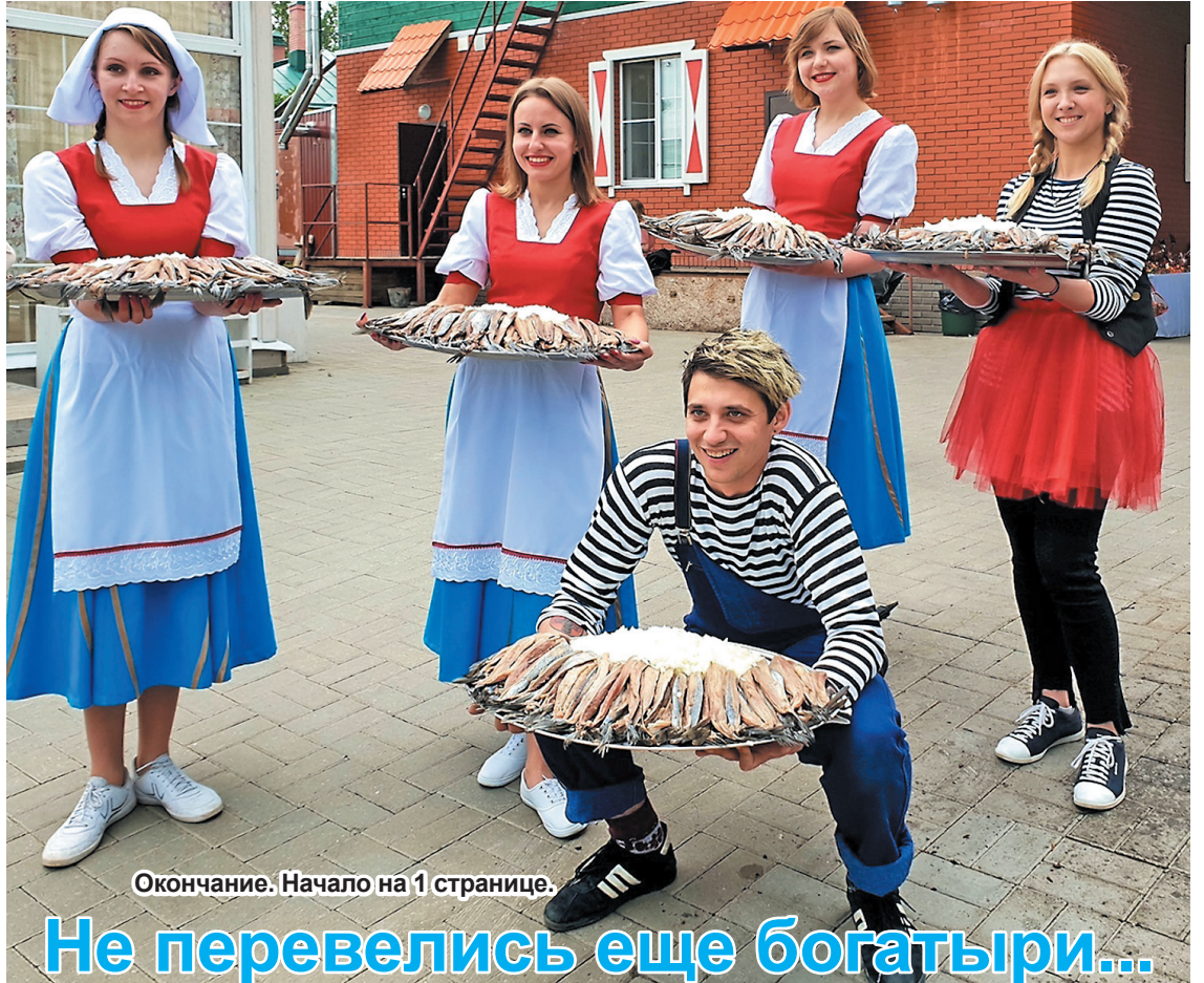
Окончание. Начало на 1 странице.