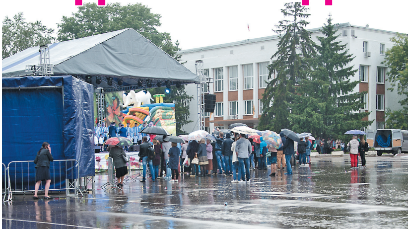
Понедельник, 11 июня, 18.00. Неожиданно налетевший в самый разгар праздника дождь испортил настроение - Народная площадь вмиг опустела