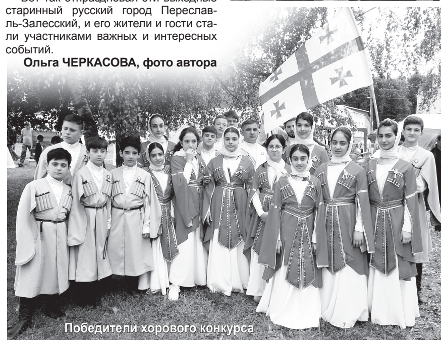
Победители хорового конкурса