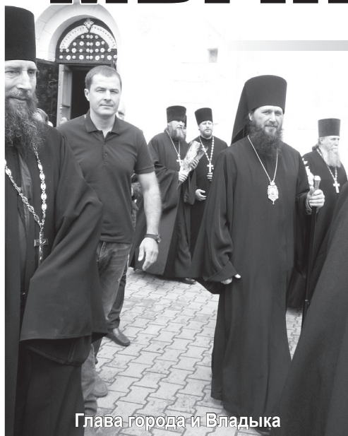
Глава города и Владыка

В дни, когда мы отдыхали, было столько праздников. Одиннадцатого июня, в день памяти святителя Луки, православные христиане в Свято-Никольском монастыре с особым чувством подходили к иконе святителя, чтобы приложиться к частичке его мощей. В этот же день возле центральной районной больницы был освящен памятник архиепископу Симферопольскому и Крымскому, восстановленный после надругательства вандалами. А в Годено, на подворье Никольского женского монастыря, к Животворящему Кресту прибывали с раннего утра паломники. В празднование 595-летия со дня явления Святыни в Годеново был освящен памятник царственным страстотерпцам - царю Николаю Второму с августейшим семейством. На освящении присутствовала великая княгиня Ольга Николаевна Куликовская-Романова.