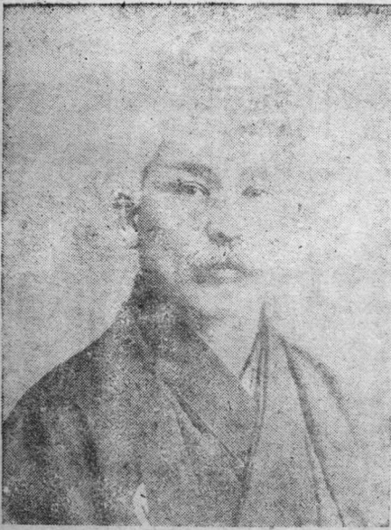
內 田 良 平

李容九之矢志亡國，不惜與全韓國人及日本之穩健派搏鬪。宋秉峻奔走於馬關東城之間，以往返策動其詭謀，卒爲日本造成時勢，使寺內正毅一舉手而亡韓國。就日本方面言，一進會之功誠大矣。宣布合併之翌日（八月三十一日），日皇勅使稻葉抵京城，直入統監邸，對寺內傳優渥之勅語。翌日（九月一日）至昌德宮仁政殿冊封李王，授爵功臣。宋秉峻授子爵，李容九賜金十萬圓。九月十二日下令解散一進會，賜解散費十五萬圓。一進會之會員，號稱百萬，以此計之，每人僅得一角五分錢，而貽賣國賊之萬世罵名，可謂廉價矣！