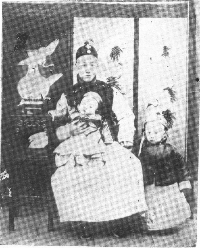
清宣統帝溥儀及攝政王載灃