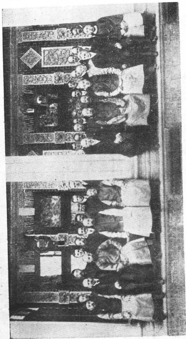
四國銀團代表與中國官員合影