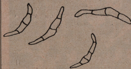
Konidies (semoj) de fungo kaŭzanta ebrigajn ecojn de la lin-oleo.

Komparativa detala ellernado de la fungo montris, ke ĝi estas nove trovita organismo.