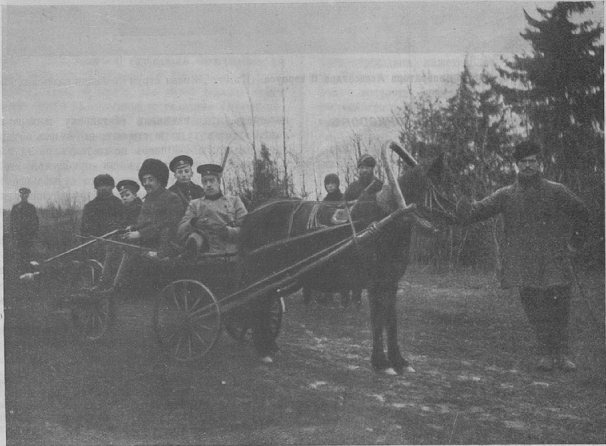
Охота надеть Императора Александра II корпуса „На номера“. (Къ ст. „Живая струя въ жизни кадетскихъ корпусовъ“).

Какъ будто потребность въ прогулкѣ на свѣжемъ воз-