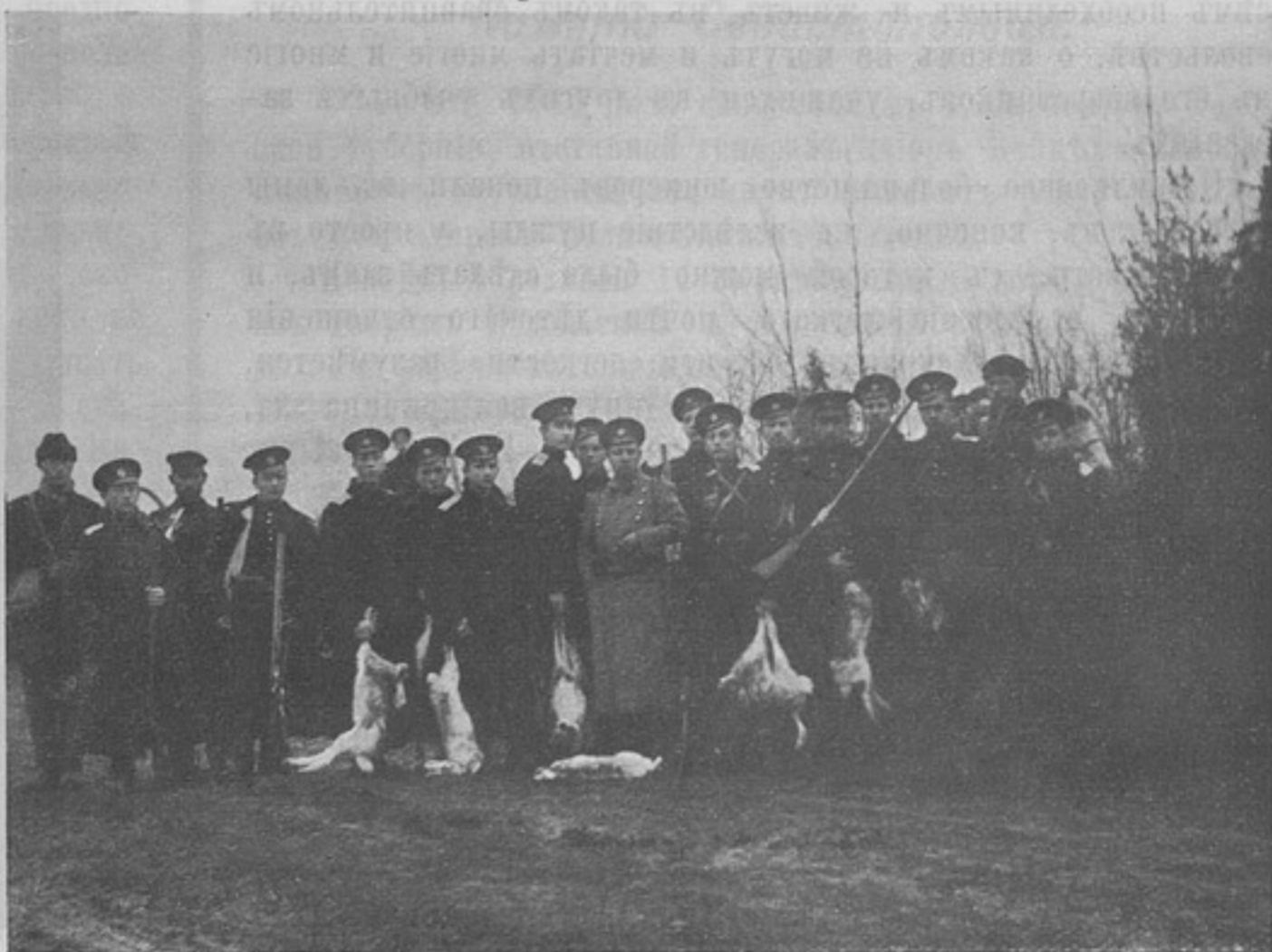
Охота кадетъ Императора Александра II корпуса. Трофеи охоты. (Къ ст. «Живая струя въ жизни кадетскихъ корпусовъ».)

борьбы съ задолженностью юнкеровъ. Если экскурсіи будутъ дѣлаться на собственный счетъ юнкеровъ, то это именно скорѣе можетъ ихъ толкнуть въ петлю ростовщиковъ.