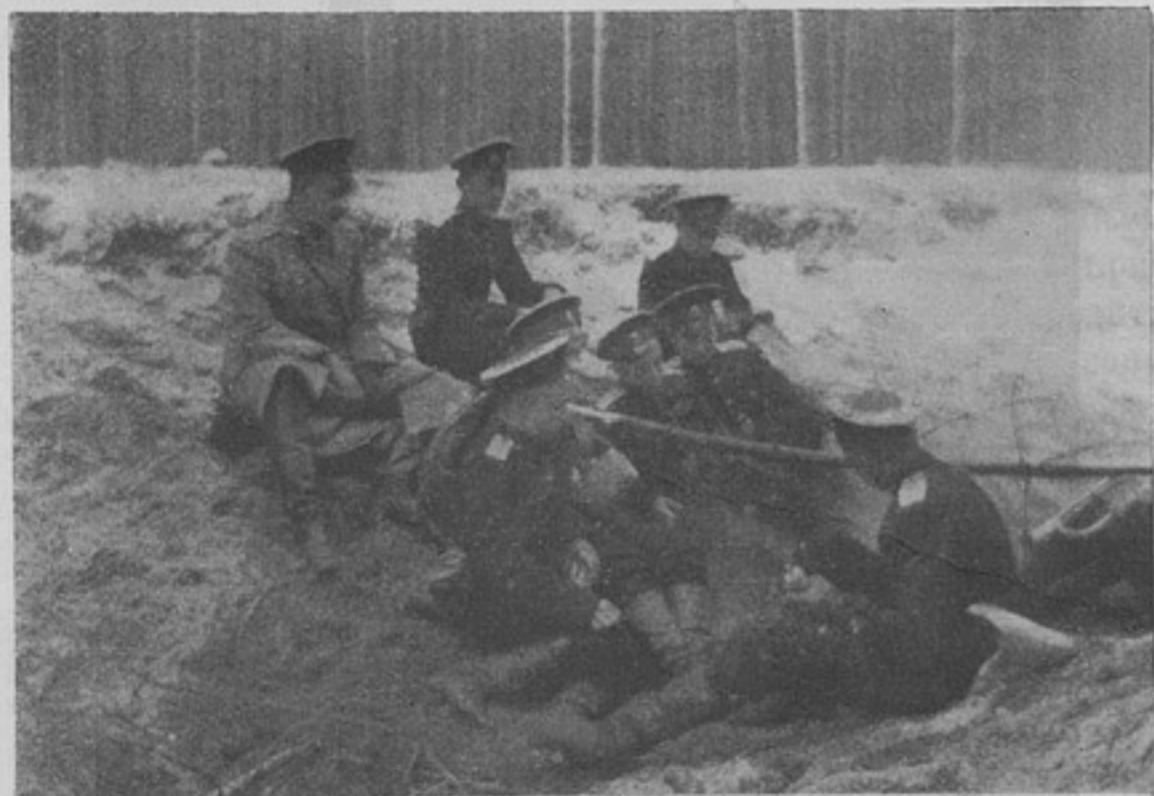
Кадеты Императора Александра II корпуса на полевыхъ занятіяхъ. Варна пищи въ котелкахъ. (Къ ст. «Живая струя въ жизни кадетскихъ корпусовъ».)

Что касается экскурсій юнкеровъ, то, признавая за ними бесспорную пользу, я все-таки склоненъ думать, что это дорогое удовольствіе рѣшительно не годится, какъ мѣра