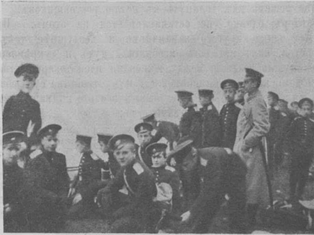
Кадеты Императора Александра II корпуса на полевыхъ занятіяхъ. (Къ ст. „Живая струя въ жизни кадетскихъ корпусовъ“).

Тягостно встрѣчаться съ противникомъ, презирающимъ законы и обычаи войны. Еще Петръ Великій далъ имя «дерзкаго дешперанта» такому врагу, повстрѣчавшись съ полу-дикими тогда племенами Дагестана въ персидскомъ походѣ. Въ полемикѣ такой «дешперантизмъ» выражается въ переименованіи вашихъ словъ, въ безцеремонныхъ заподо-