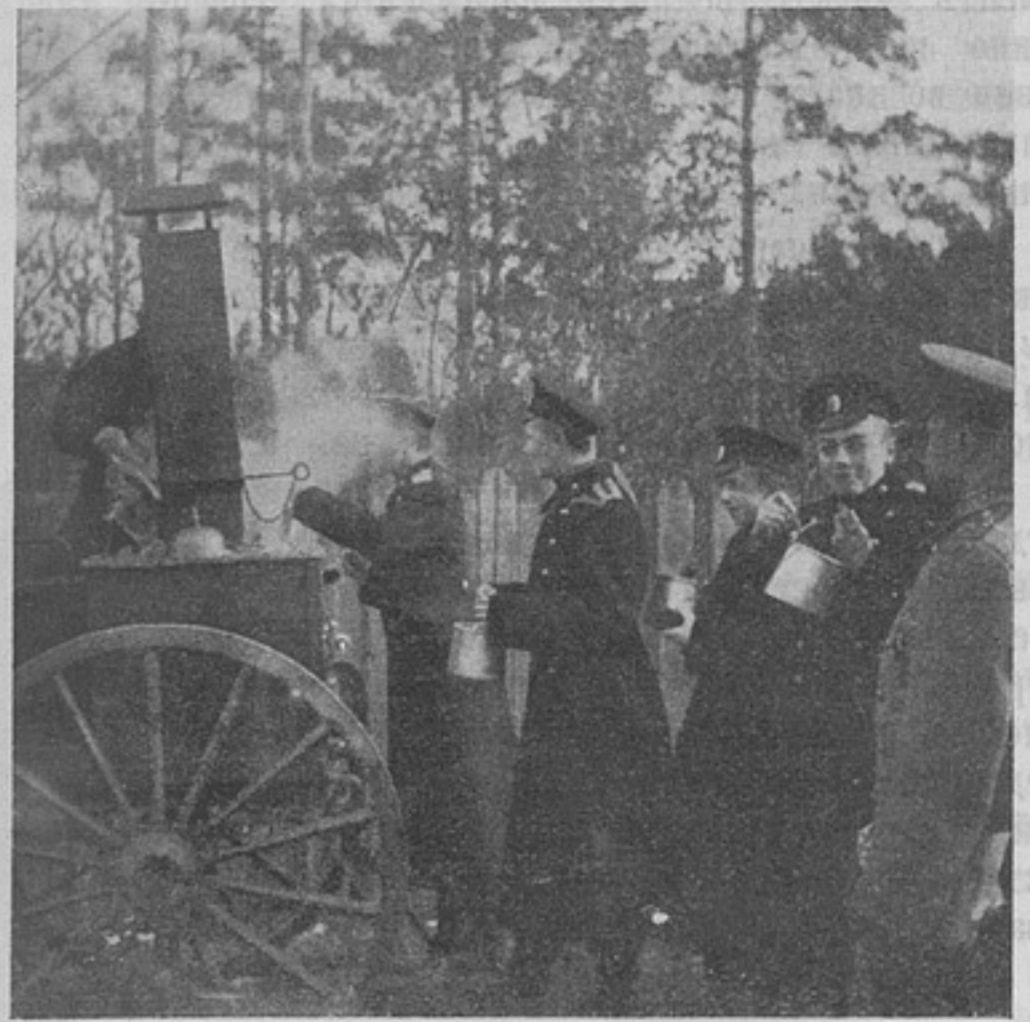
Общіе классы Пажеснаго Его Императорскаго Величества корпуса на полевыхъ занятіяхъ. (Къ ст. „Живая струя въ жизни кадетскихъ корпусовъ“).

Но суть не въ этомъ и не въ мелочныхъ несогласіяхъ въ пониманіи устава, спорить о которыхъ (оставаясь при своемъ пониманіи) здѣсь я не стану. Суть въ вопросѣ, на-