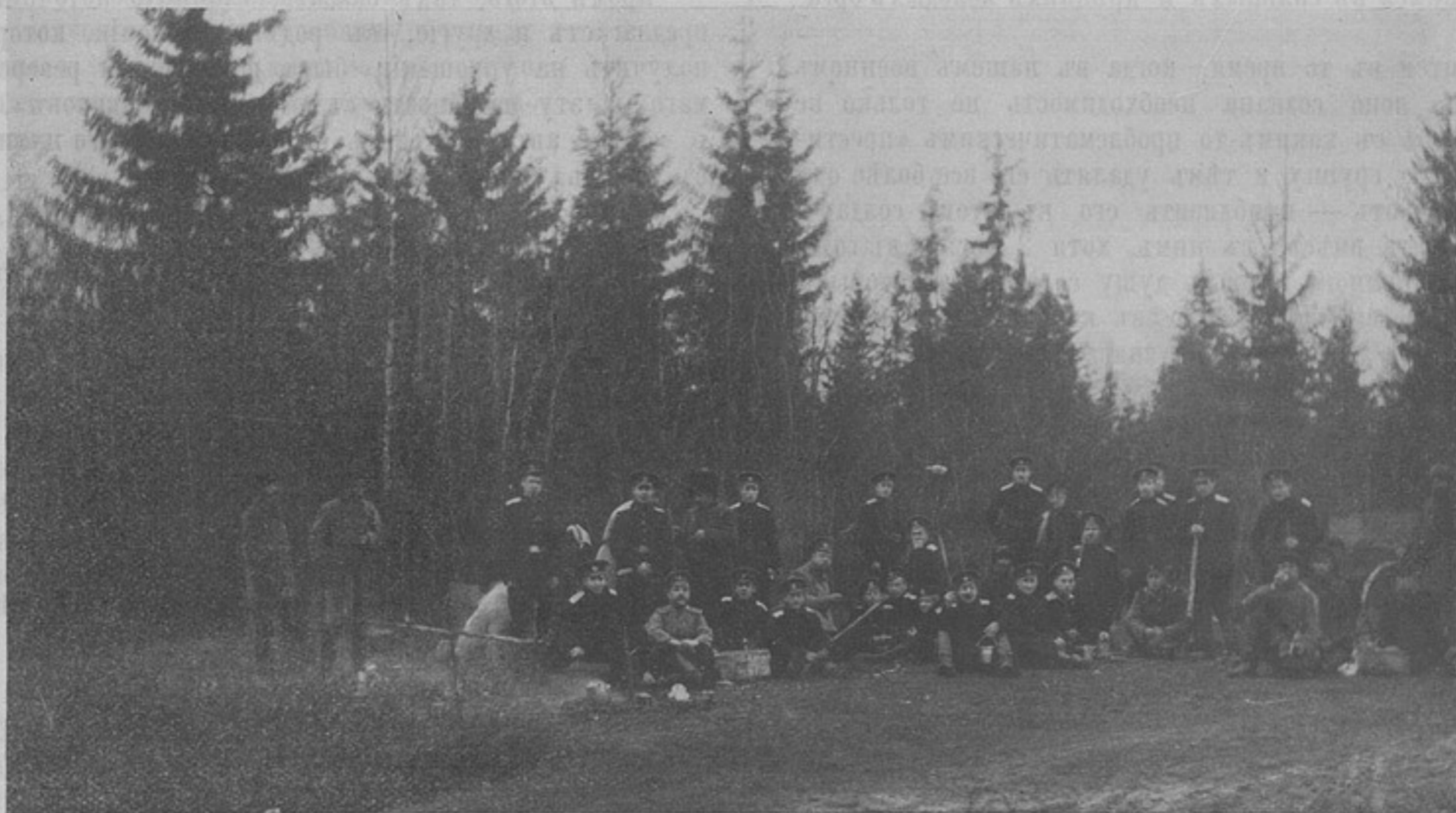
Привалъ и варка пищи на охотѣ надетъ Императора Александра II корпуса. (Къ ст. „Живая струя въ жизни кадетскихъ корпусовъ“).