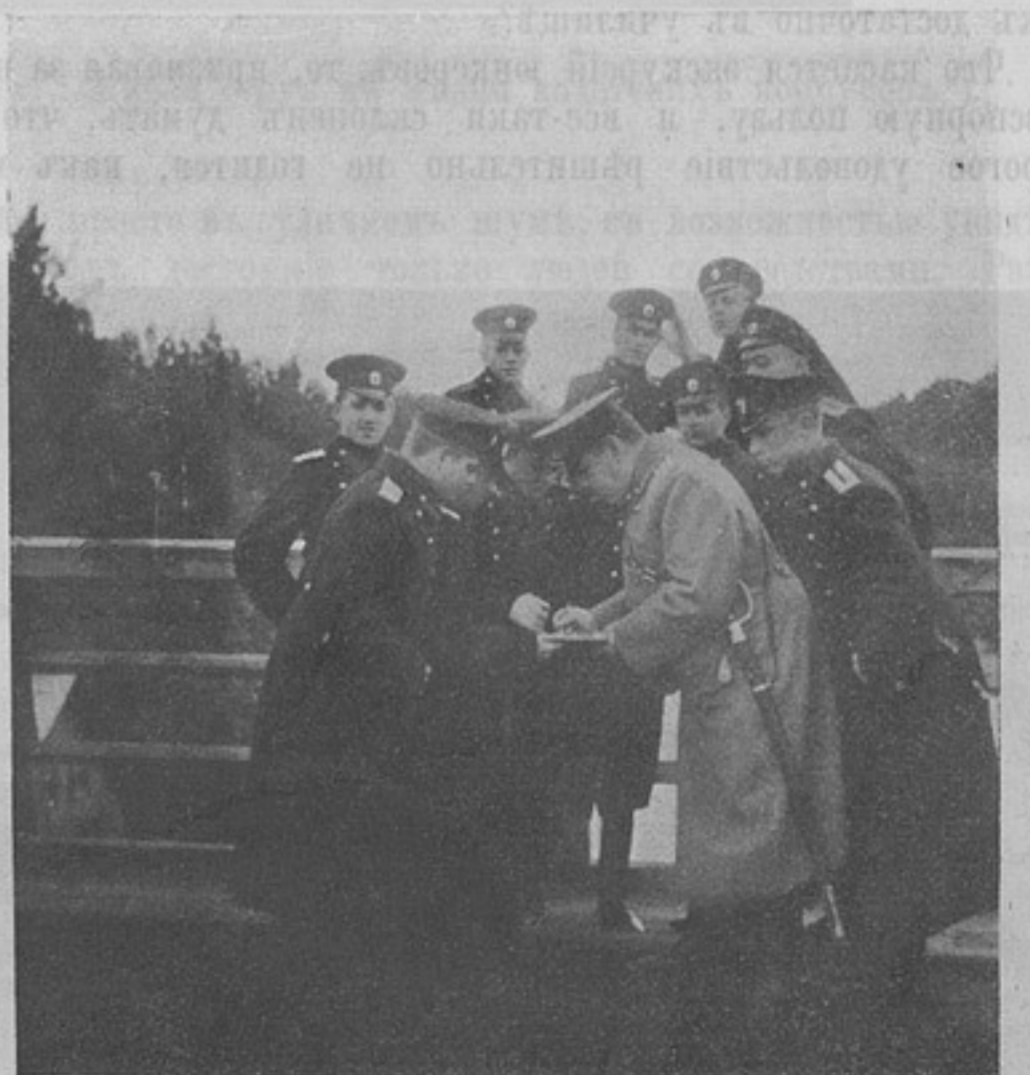
Общіе классы Пажеснаго Его Императорскаго Величества корпуса на сѣмкѣ. (Къ ст. „Живая струя въ жизни кадетскихъ корпусовъ“).

Совѣтую читать не только уставъ, но и комментаріи на