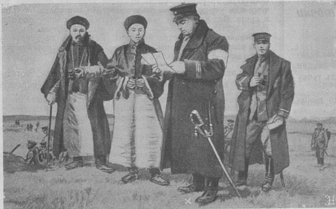
Революція въ Китаѣ. Главнокомандующій революціонными войсками Ли-юань-хенгъ со штабомъ.

языка выражаетъ опредѣленнѣе взаимодѣйствіе лицъ, нежели первое, показывающее дѣйствіе одного, переходящее на другого; но дѣло въ томъ, что ни предписанія, ни отношенія, теперь сношенія, никогда не требовали особаго заголовка вверху своего письменнаго изложенія, обозначающаго названіе бумаги—не было ярлыка. Ярлыкъ этотъ и теперь оставленъ почему-то для рапорта.