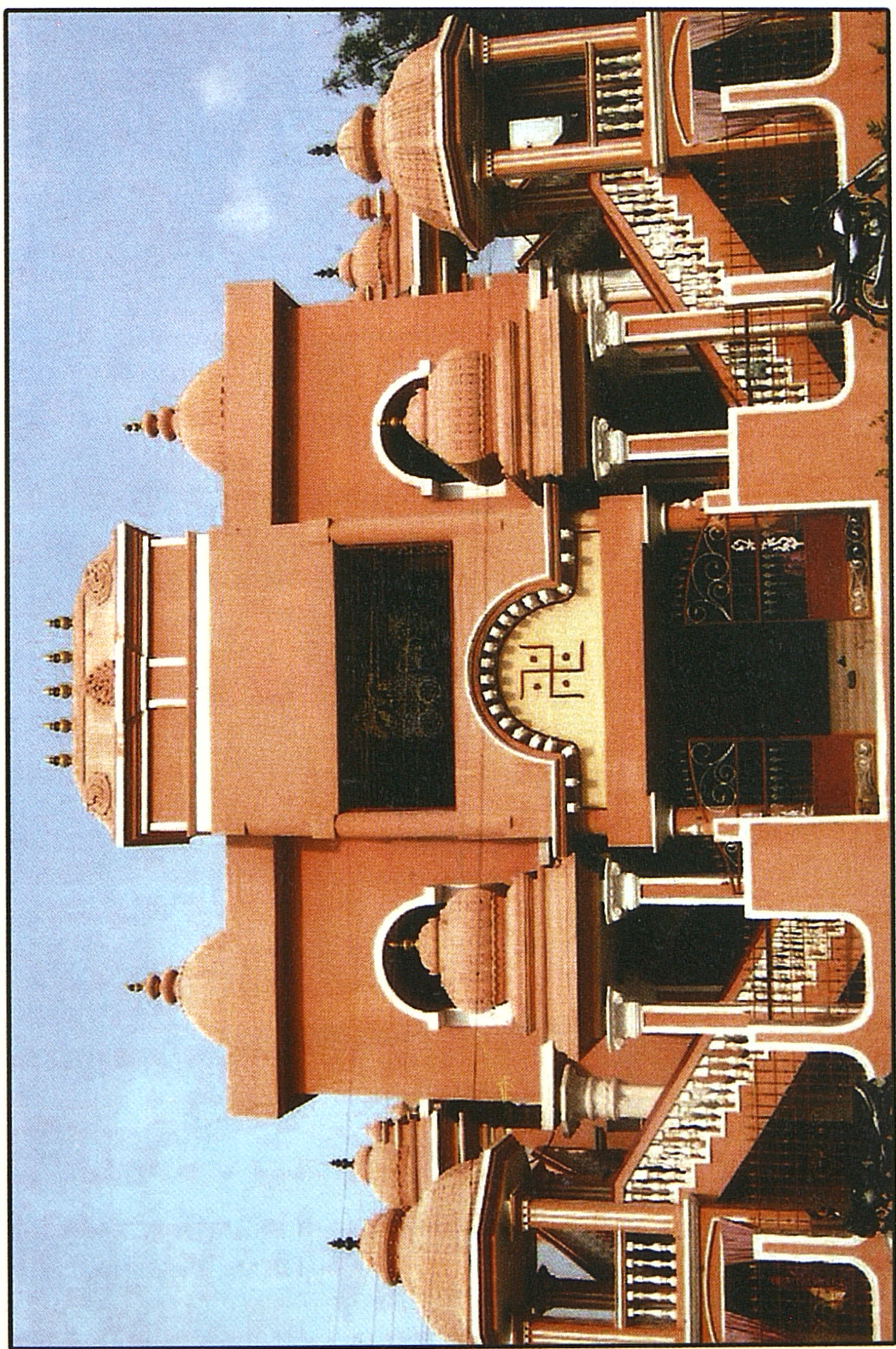
விவேகானந்தர் ஆஸ்ரமம், இராமநாதபுரம்