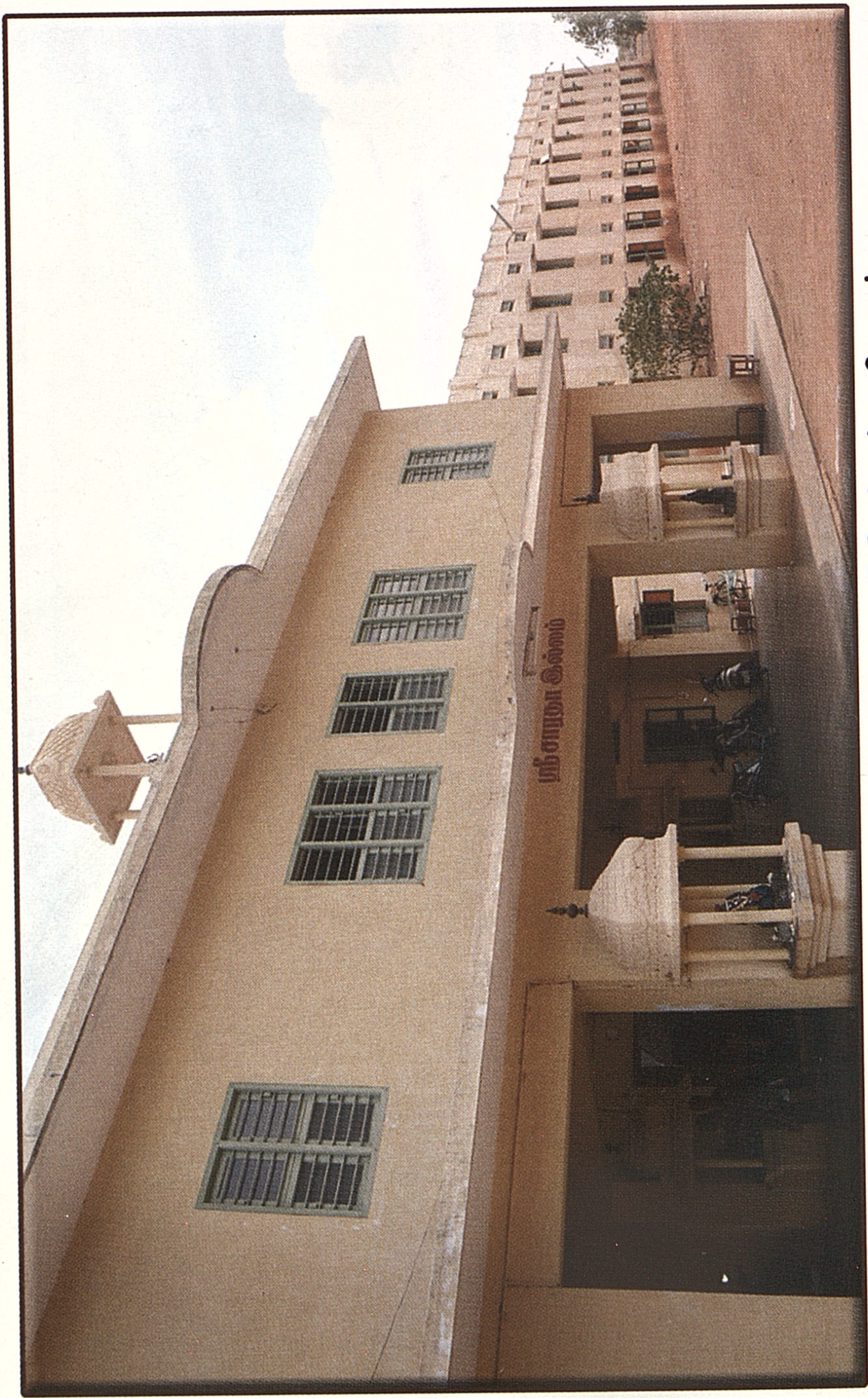
புதி சாரதா நிகேதன் மகளிர் கலை அறிவியல் கல்லூரி, கரூர்.