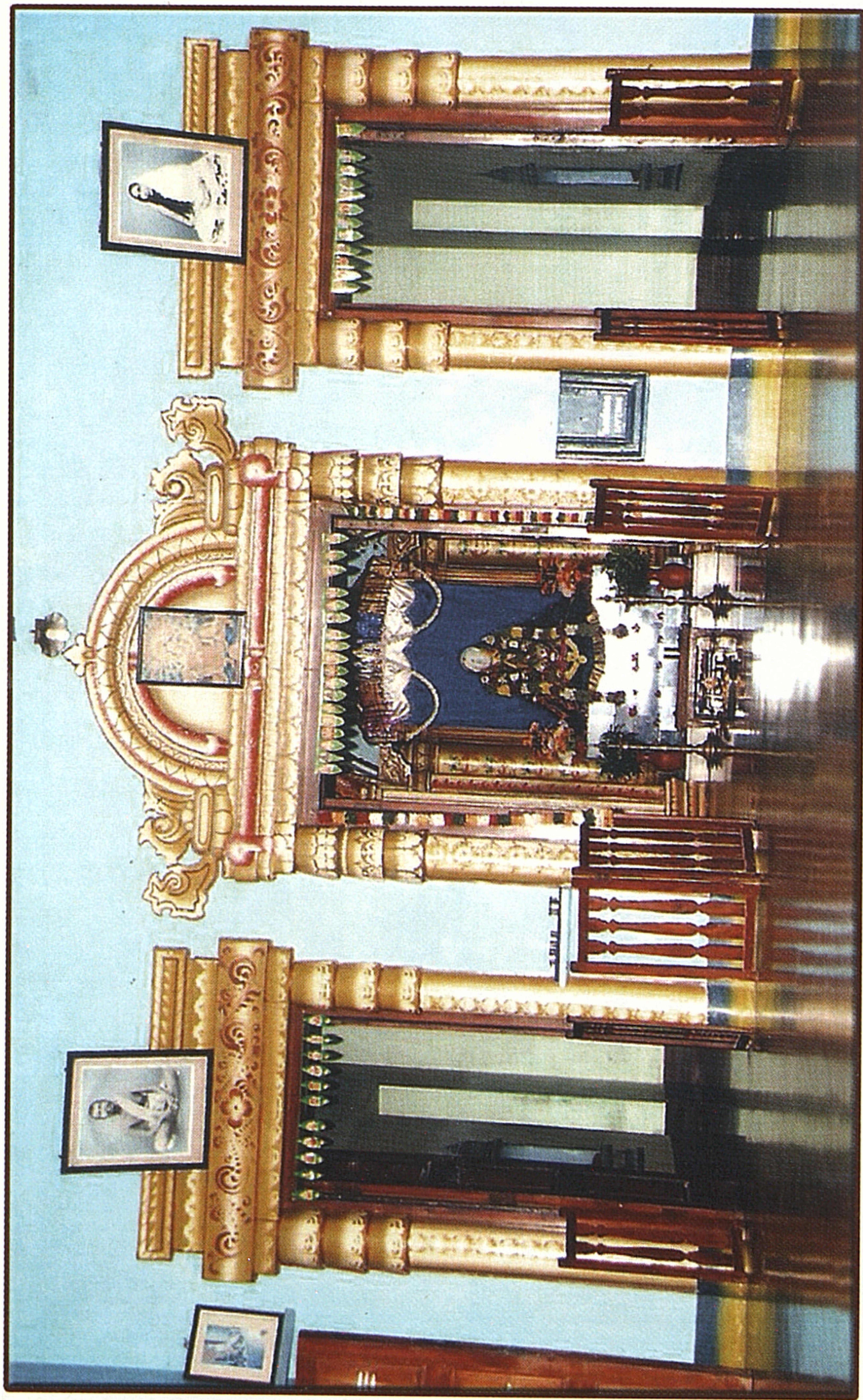
அன்னையார் கோவில் கருவறை, அமராவதி புதூர்