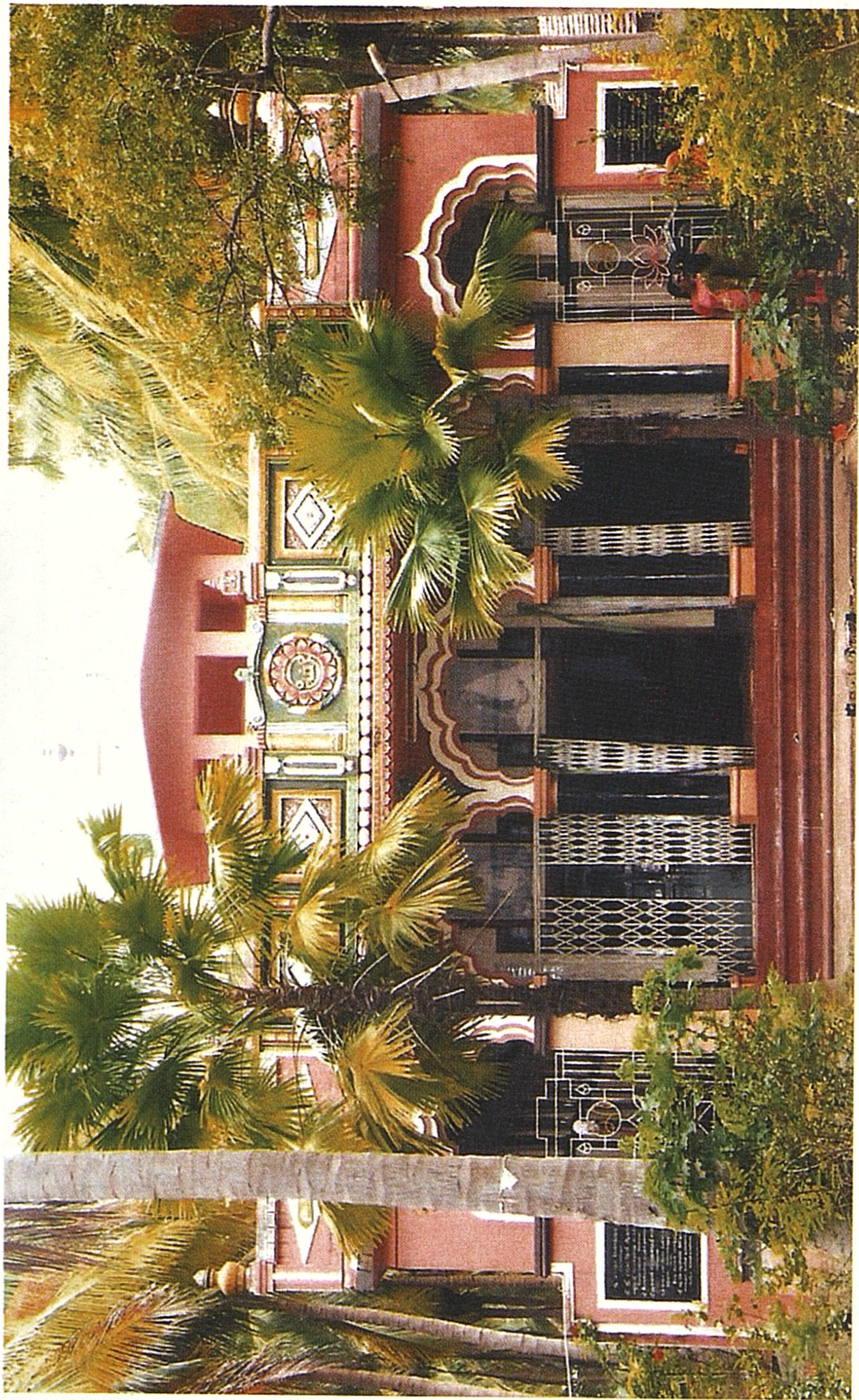
அன்னையார் கோவில் முகப்பு, அமராவதி புதூர்