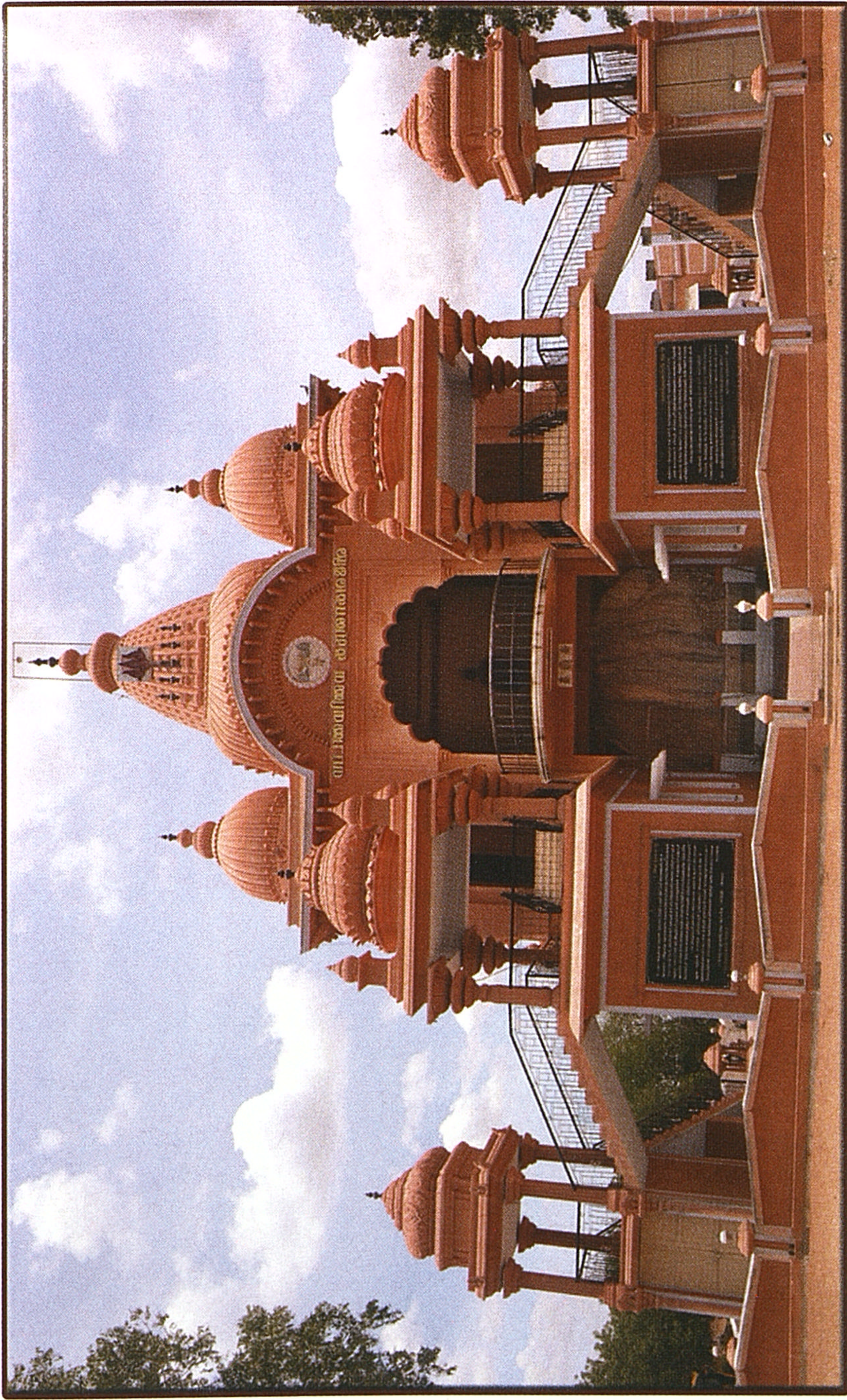
ஸ்ரீ சாரதா நரிகேதன், விவேகானந்தா மணிமண்டபம், கும்பகோணம்.