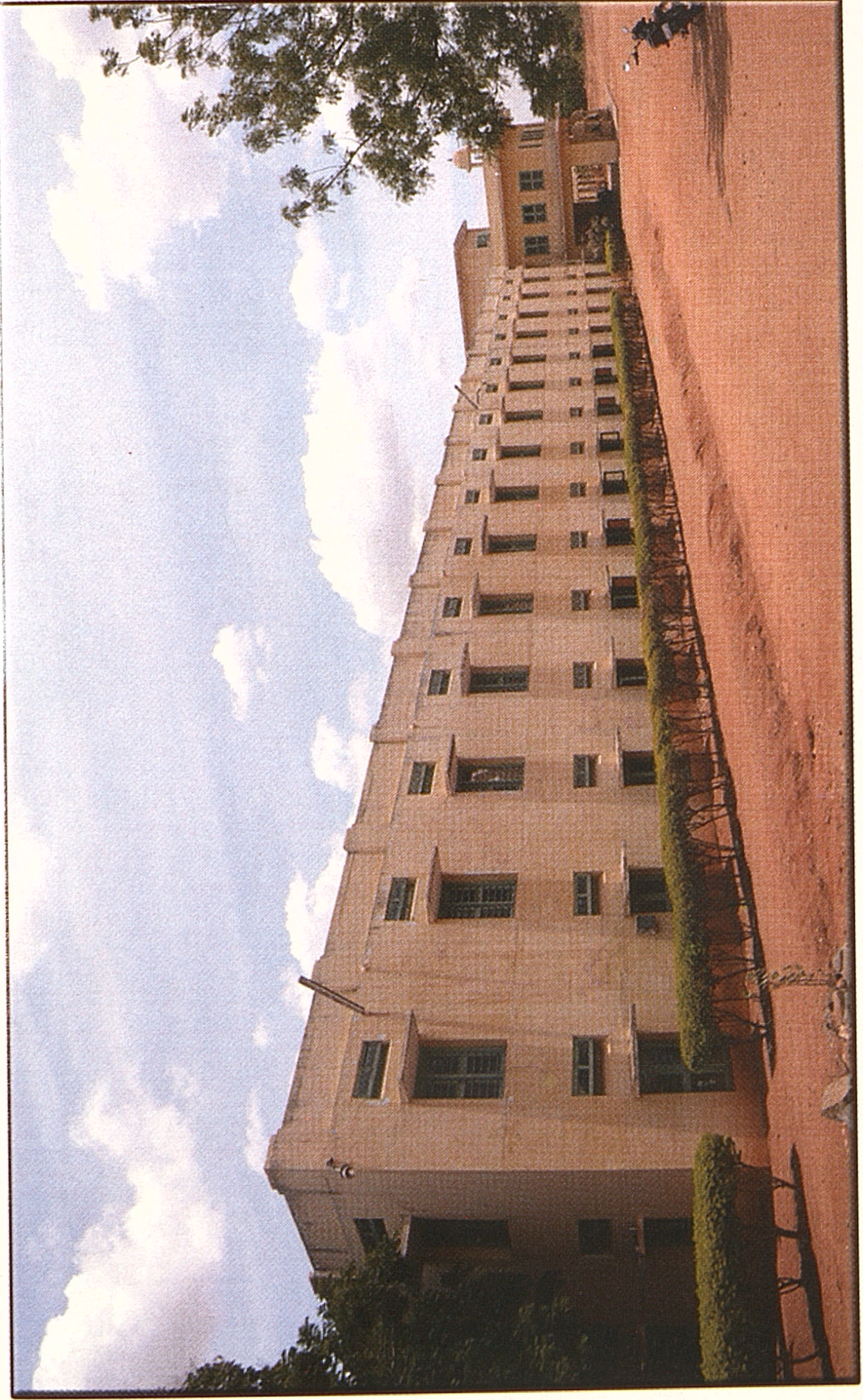
ஸ்ரீ சாரதா நிகேதன் மகளிர் கலை அறிவியல் கல்லூரி, ஸ்ரீ சாரதாபுரி - கரூர்