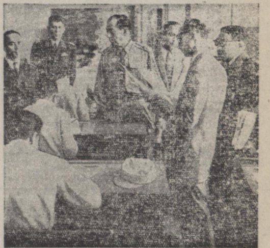
آقای آذروردی وزیر کشور هنگام مطالعه یکی از اوراق امتحانی دانشجویان آقای سرتیپ مدیررئیس شهربانی و سرهنگ خلعت بری رئیس آموزشگاه نیز در این عکس دیده میشوند

امروز بنا به دعوت آقای سرتیپ مدیررئیس شهربانی آقای آذروردی وزیر کشور و وزیر کشور برای بازدید از امتحانات سال اول و دوم آموزشگاه عالی شهربانی بعل آموزشگاه رفت.