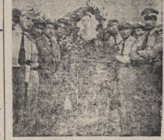
شرح در صحنه هفتم ستون ورزشی مطالعه فرمایید

دعوت پادشاه ایران تهران میرود امروز خبرگزاری عرب از قول روزنامه البصری چاپ قاهره خبری منتشر ساخته بود مبنی بر اینکه: گفته میشود قریباً از کامیل شمون رئیس جمهور لبنان دعوت خواهد شد که بطور رسمی بایران مسافرت کند. این مسافرت بطوری که مقامات مطلع لبنان اظهار میکنند بر حسب دعوت مستقیم امیرحضرت شاهنشاه ایران خواهد بود و عنوان رسمی خواهد داشت. در بیروت احتمال میدهند که این دعوت از طرف شاهنشاه ایران یا پوسیله نمایندگان مخصوص صورت گیرد که بیروت عزیت کنند پس آنکه امیرحضرت پادشاه ایران مستقیماً از رئیس جمهور لبنان برای مسافرت پتهران دعوت بعمل آورد. برای تأیید این خبر امروز با مقامات وزارت دربار تماس گرفته شد. مقامات درباری از خبر مزبور اظهار بی اطلاعی کردند و آنرا تأیید ننمودند.