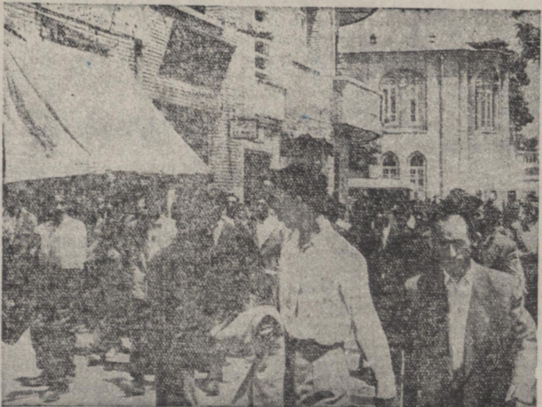
تماشاچیانیکه پس از تشنج جلسه علنی به خارج مجلس آمده بودند در محوطه مقابل مجلس مشغول دادن شمار برله آقای دکتر مصدق و کلای فراکسیون نهضت ملی گردیدند

بموجب همین لایحه اشخاص مزبور برای مدت یکسال از شرکت بدوامتجانا محروم خواهند بود.