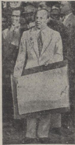
آقای مهندس ارجمند و باریه نقشه ساختمان توضیح میدهد

صحنه - بر حسب دعوتی که از طرف اداره اصل چهارم بعمل آمده بود... در این دبستانها شایسته تدریس است.