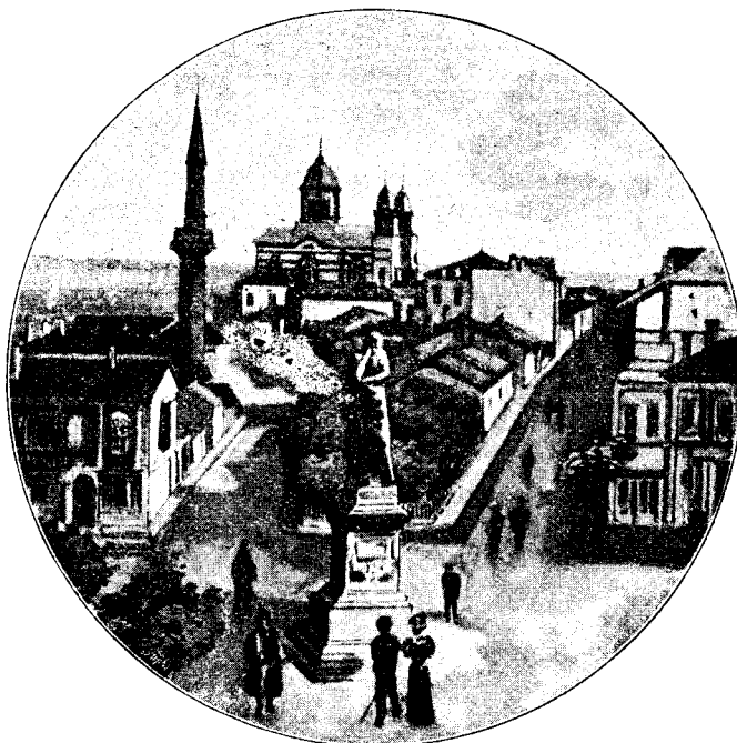
Piață în Constanța.

„Nu, nu mai crez acum că este un Dzeu“, răspuse băiatul cu vocea-i înecată, cu ochii plecați la pământ, și cu fața descompusă.