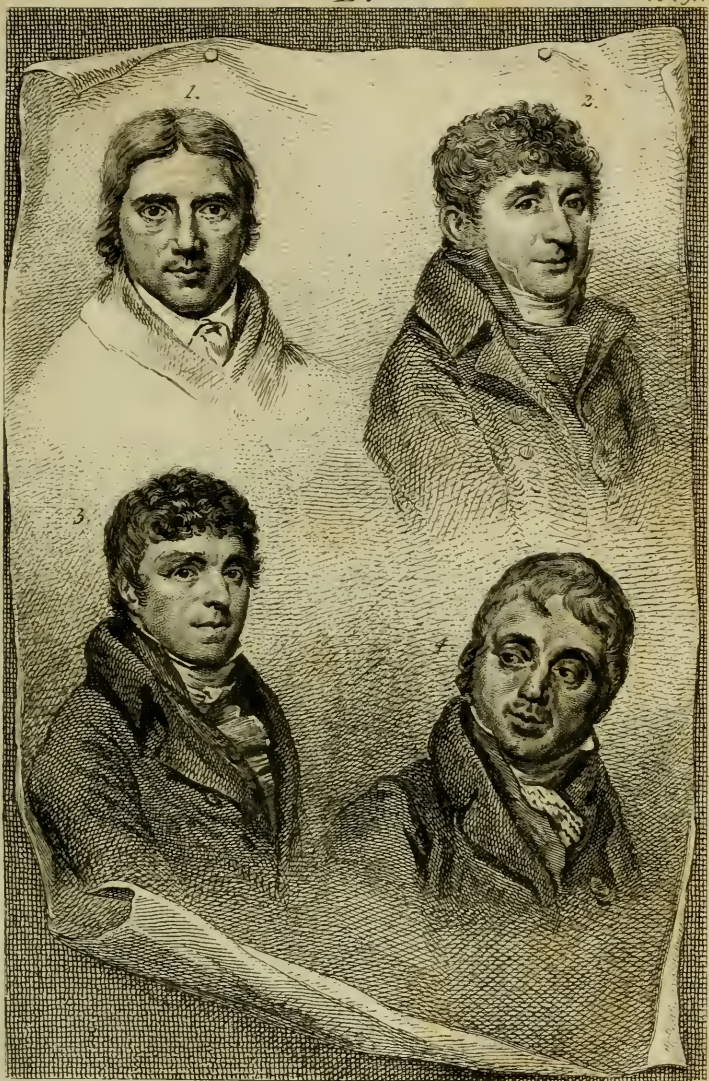
H. van Smeets, Sculp.