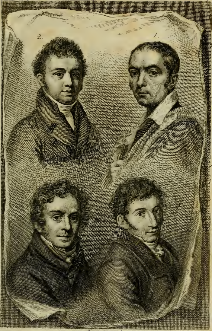
H. van Sins sculp.