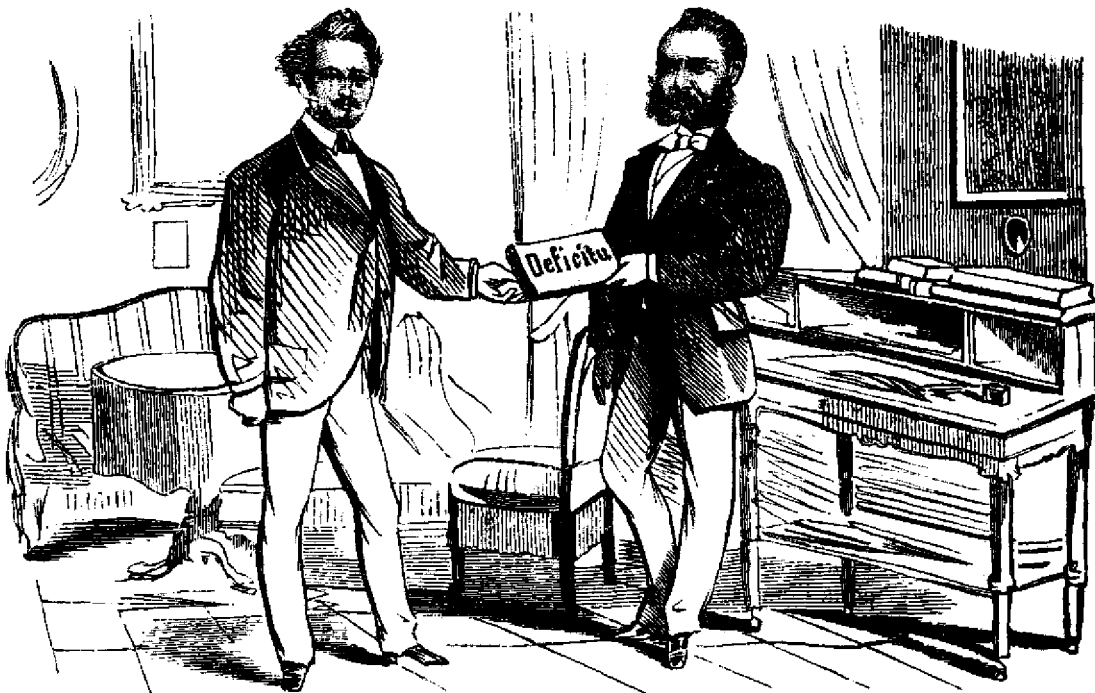
Fostulu ministru-redactoru predă portfoiulu urmatoriului seu, cantandu :

Frundia verde, lemnu uscatu, Facu-mi cruce c'am seapatu !