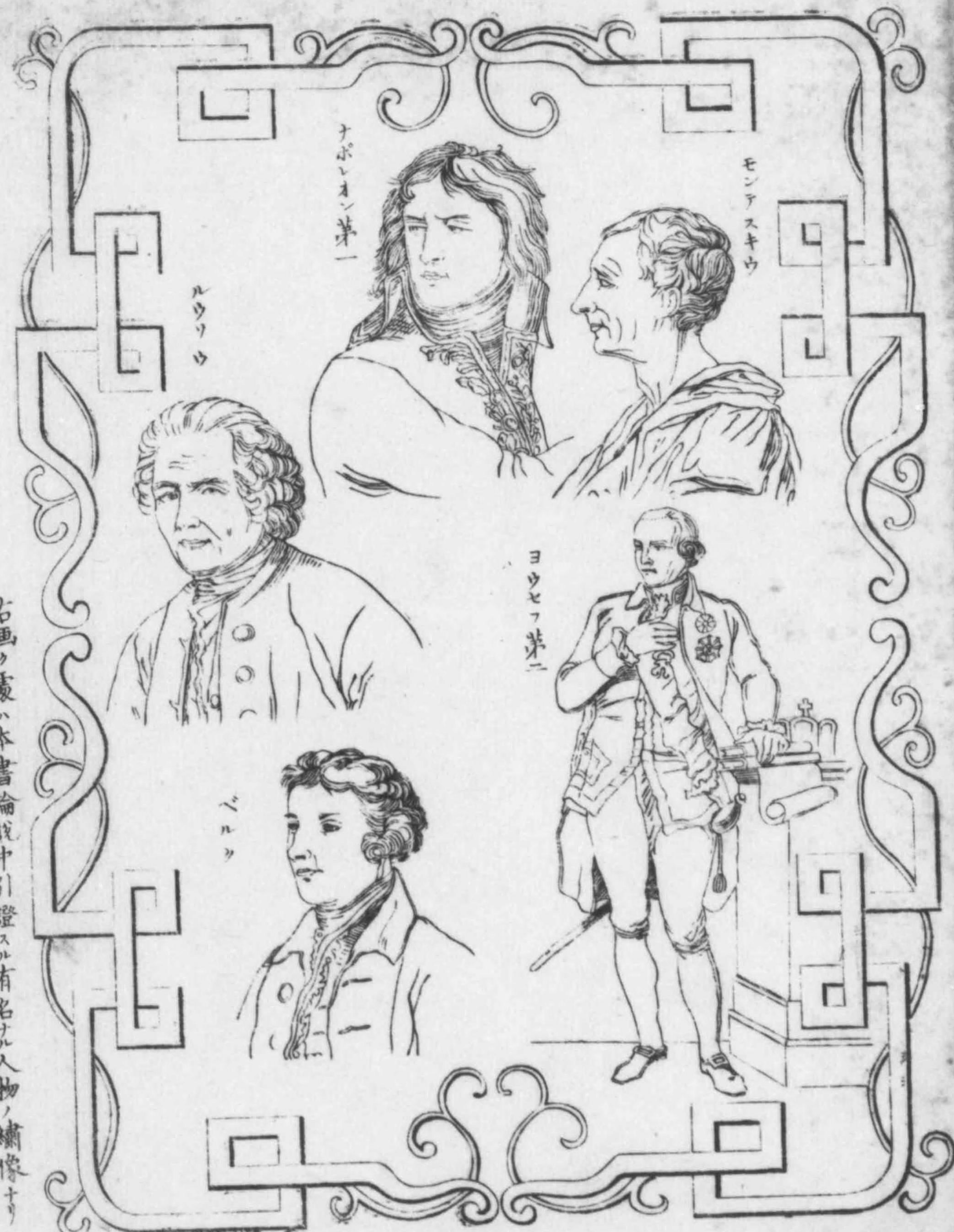
右画々蒙ハ本書論說中引證スル有名ナル人物ノ繙像ナリ

一 維新以來、廟議專ヲ開化ノ進歩ヲ急務ト為シ、制度文物ノ大ヨリ、百工技藝ノ廣ニ至リ、一ニ歐風ニ師倣ス、實ニ盛世ノ洪舉ニノ億兆ノ大幸ナリ、是ニ於テ洋書ノ繙譯梓ニ上ル者、陸續トメ間斷ナク上ハ廟謨ノ萬一ヲ裨補シ、下ハ斯民ノ新化ヲ作振ス、亦盛事ト謂ハサル可シヤ、就中制度律令ノ事ニ係ル者、亦尠カラズ、然ルニ其書タル多クハ唯各國列邦ニ於テ、現ニ遵用スル所ノ制度律令ヲ説ケル者ニシ