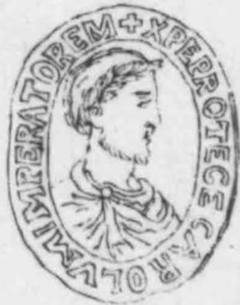
カルテルゴローセ