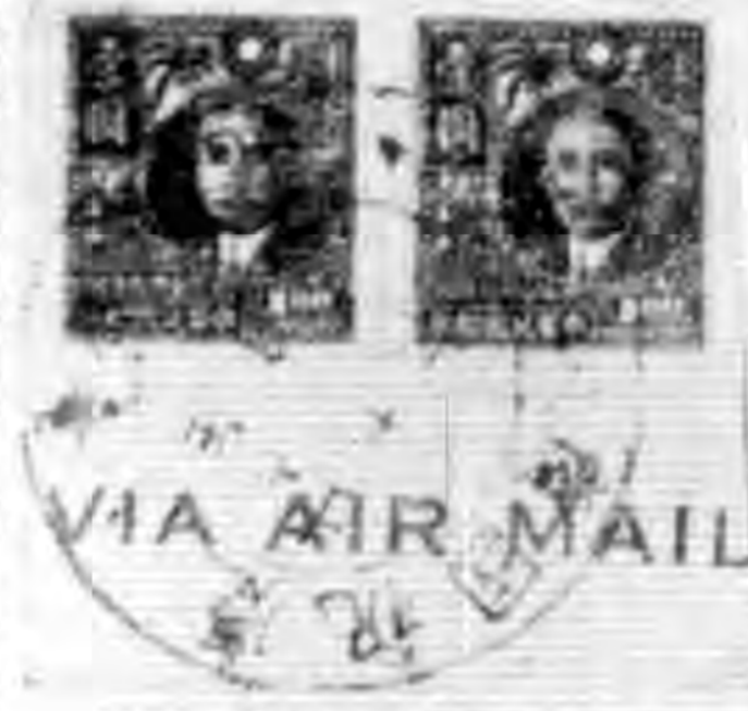
台灣國慶紀念郵票寄月之一

則未聞有使用紀念票者，亦可異也。君所詢者，但此票或即係在現見之者，有十四種，其票面之字樣，係由滬局加蓋，其票面之字樣，係由滬局加蓋。