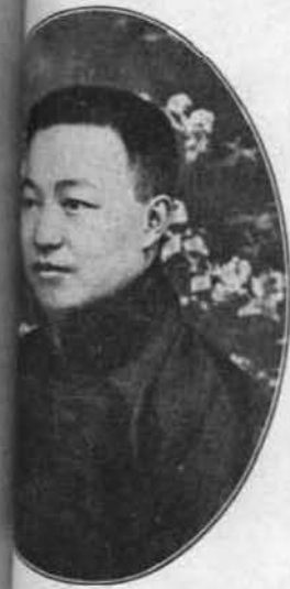
烈 號 炎 興