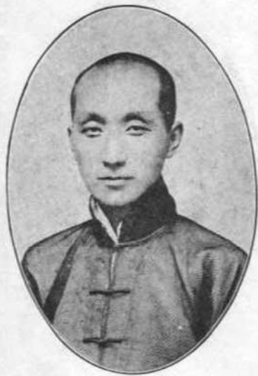
峯 毓 號 鍾 奇