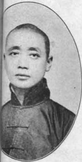
玉 號 麟