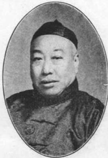
如 環 號 仰 平