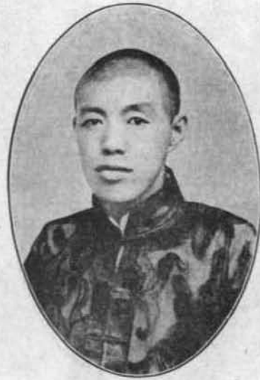
民 濟 號 熾 士