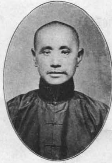
梧 鳳 號 儀 錦