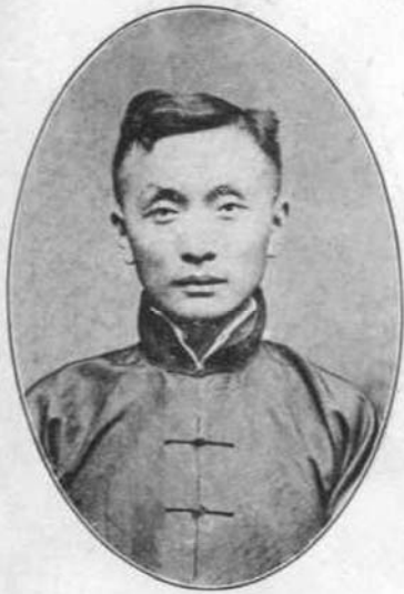
洲 普 號 頤