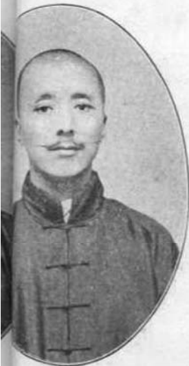
煦 仁 號 詰