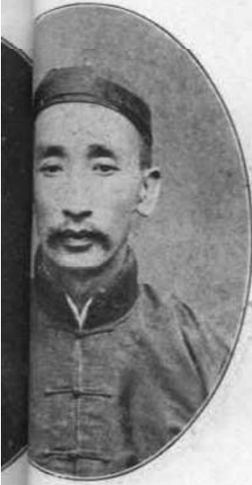
霖 照 號 鑄