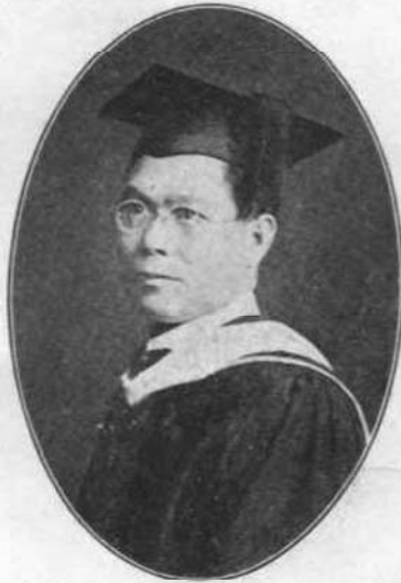
森 焱 號 伯 述