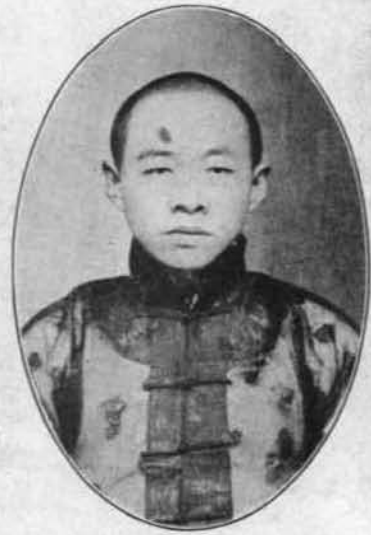
豐 兆 號 雲 煉