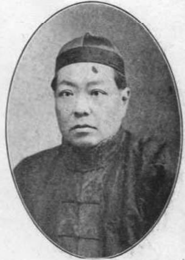
承 燾 號 志 霄