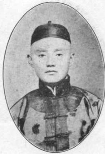
林 蔚 號 栢 蔭