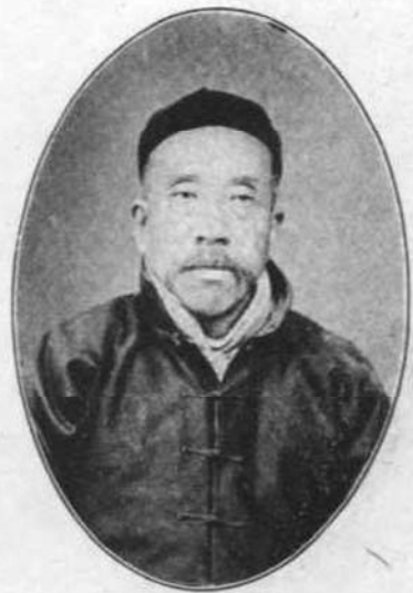
壽 朋 號 士 果