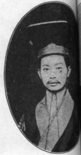
奇 宇 號