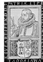
commons:Baltasar de echeave.jpg Q wd:Q4852822 Q Zumaya