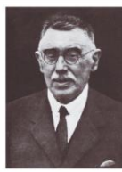
commons:Karmelo Etxebarri.png Q wd:Q831429 Q Azpeitia