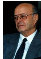
commons:Patxi Altuna euskala... Q wd:Q3370189 Q Azpeitia