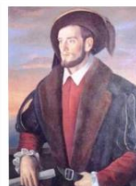
commons:Urdaneta marinela tokia... Q wd:Q316780 Q Ondiza