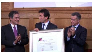
commons:Lhk ausiko ikasituntza JI Alvarez.jpg Q wd:Q45322184 Q Zumaya