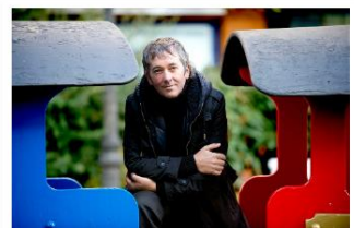
commons:Patxi Zubizarreta.JPG Q wd:Q3370197 Q Ondiza