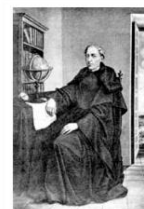
commons:Andres de Urdaneta j... Q wd:Q316780 Q Ondiza