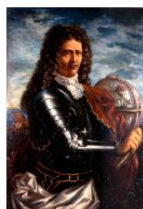
commons:Antonio Gaztañeta.jpg Q wd:Q59018597 Q Monzo