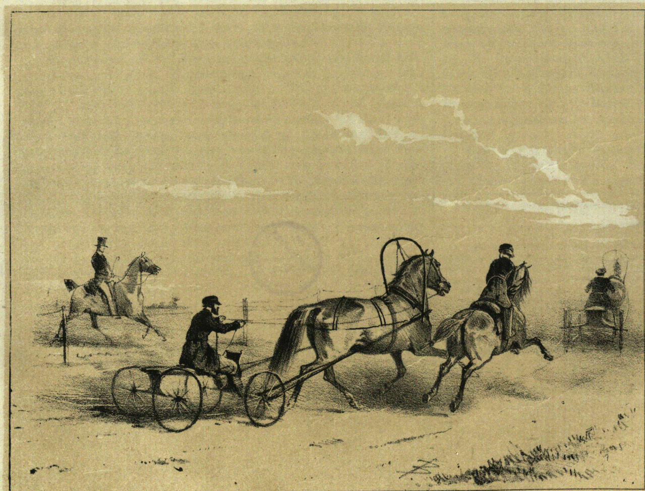
Рысистый бѣгъ въ Царскомъ-Сель 1852 года.