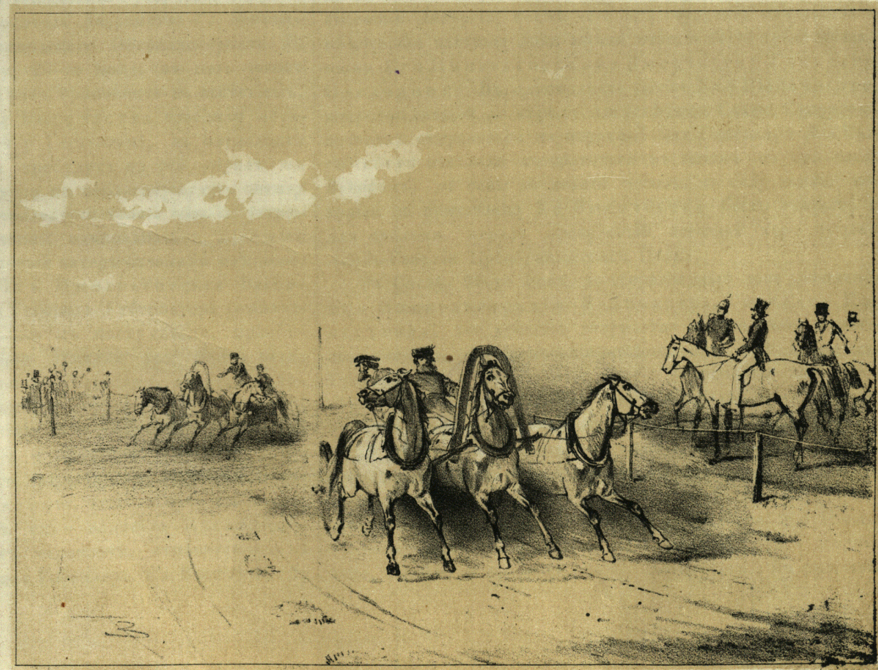
Троичный бѣгъ въ Царскомъ-Сель 1852г.