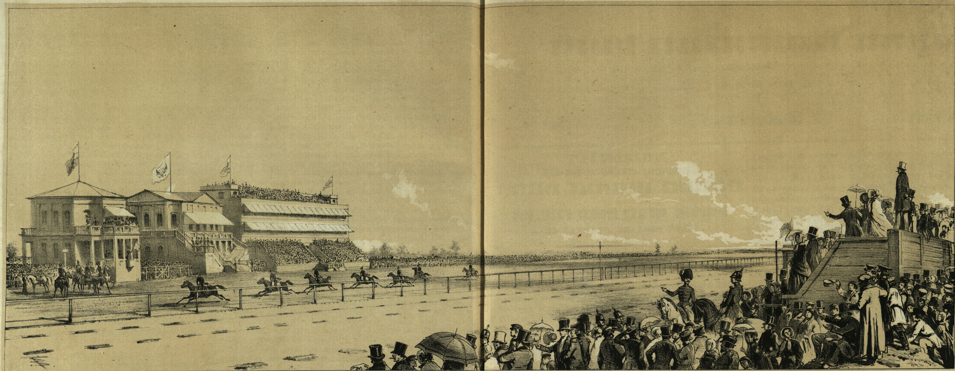
Скачка 24 го Августа 1852г. въ Царскомъ-Сель, на призъ ГОСУДАРСТВЕННАГО Коннозаводства, для Г.г. Офицеровъ на лошадяхъ служащихъ, всякаго происхожденія.