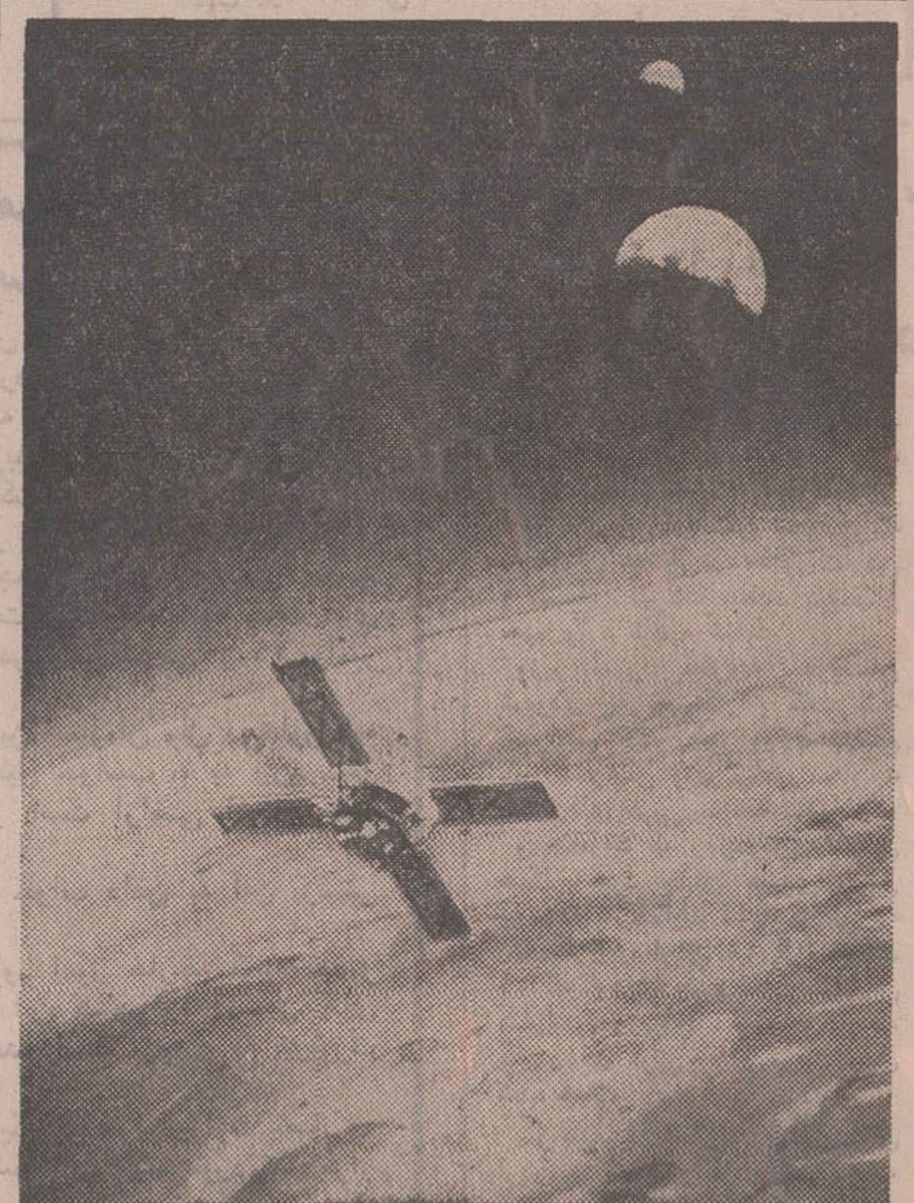
سفینه خودکار «مارینر ۹» آمریکا پس از انجام یک مانور حساس با موفقیت در مدار کره مریخ قرار گرفت. «مارینر ۹» که روز ۳۰ مه بهفضای پرتاب شد پس از طی چهارصد میلیون کیلومتر راه اینک بدور ستاره آسراف آمیز مریخ در گردش است و مدت نود روز عکسها و اطلاعات علمی دقیقی درباره این همسایه آسمانی زمین به ایستگاههای کنترل فضائی مخابره خواهد کرد. در تصویر سفینه مارینر هنگام پرواز بر فراز مریخ نمایش دیده شده است در بالای عکس تصویر کره زمین و ماه دیده میشود.

سفینه های آمریکا و شوروی درباره وجود تحقیقات دامنه داری بعمل میاورند. «مارینر ۹» سفینه آمریکا به سومین قمر مریخ تبدیل شد. در صفحه ۳